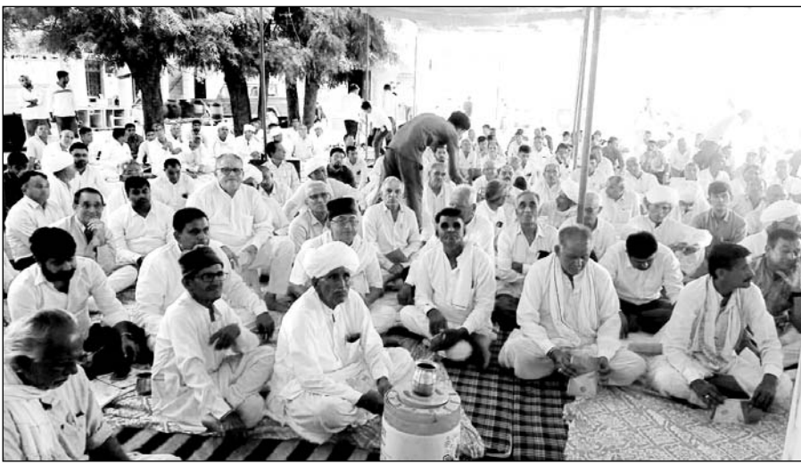
सांचोर में अखिल भारतीय विश्वीय महासभा की बैठक आयोजित हुई।

शिक्षण संस्थान के उत्थान के लिए सकारात्मक सुझाव आए। गुरुद्वारा प्रबंधक कमेटी द्वारा संचालित बिश्नोई धर्मशाला, बालिका छात्रावास,