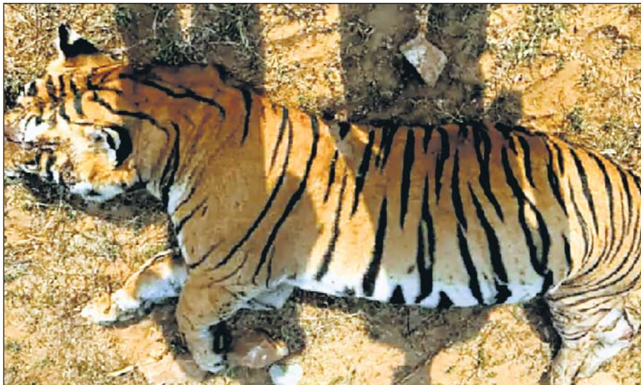
सर्वाइ माधोपुर के रणथम्भौर नेशनल पार्क के निकट उलियाना गांव के पास टाइगर टी-86 की अज्ञात लोगों ने पत्थर एवं धारदार हथियारों से हत्या कर दी।

इस मामले को लेकर वन विभाग सीधा तौर पर कुछ भी कहने को तैयार नहीं है, लेकिन बाघ टी-86 की मौत की पुष्टि करते हुए कहा है कि पोस्टमार्टम हो जाने के बाद मौत के वास्तविक कारणों का पता चल सकेगा।