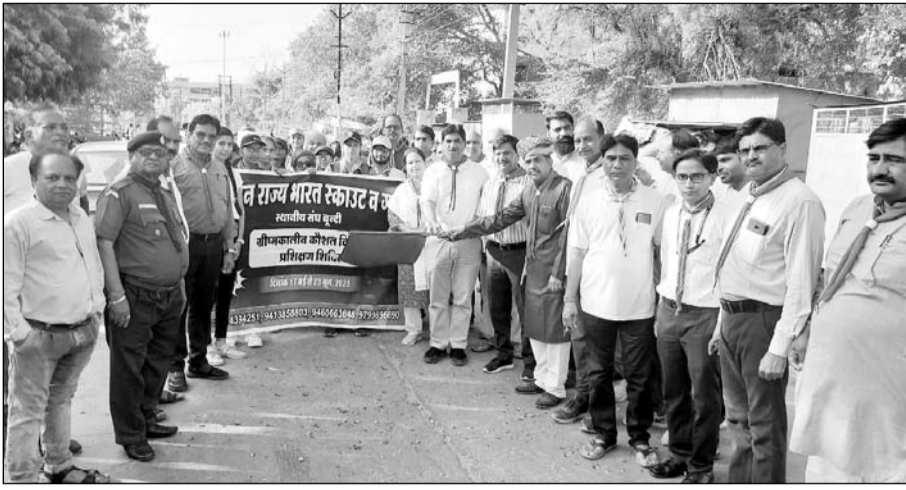
स्काउट गाइड के बच्चों ने विरासत का भ्रमण किया।