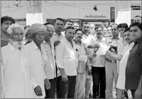
ग्रामीण जनप्रतिनिधियों सहित खुनखुना व्यापार मंडलों और सामाजिक संगठनों ने ज्ञापन सौंपा।

डीडवाना, (निसं)। राज्य सरकार द्वारा नव घोषित डीडवाना-कुचामन जिले का जिला मुख्यालय डीडवाना को बनाने की मांग को लेकर संघर्ष समिति का आंदोलन लगातार जारी है। गत 8 जून को सफलतापूर्वक डीडवाना बंद के बाद अब डीडवाना के कस्बों को भी बंद रखकर जिला मुख्यालय की मांग उठाई जा रही है। इसी क्रम में डीडवाना उपखंड के पांच बड़े कस्बों को बंद रखने का ऐलान किया गया था। इसके तहत शनिवार को खुनखुना कस्बे पूर्णतया बंद रहा। खुनखुना बंद को सभी ग्रामीण जनप्रतिनिधियों सहित खुनखुना व्यापार मंडलों और सामाजिक संघटनों ने समर्थन दिया है, जिससे खुनखुना बंद को बाजार बंद पूर्णतया रहे। बंद का इतना व्यापक असर रहा कि फल सब्जी के थडी और ठेले भी पूरी तरह से बंद रहे। इस मौके पर खुनखुना गांव में रैली निकाली गई, जो विभिन्न मार्गों से होती हुई पुलिस थाना