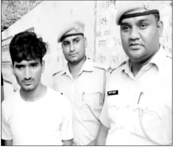
कोटा में वी.डी.ओ. की परीक्षा देने के बाद मुन्ना भाई को पुलिस ने गिरफ्तार किया।

कोटा, (निर्सं।) जिले में ग्राम विकास अधिकारी की मुख्य परीक्षा देते हुए एक मुन्ना भाई को पुलिस ने पकड़ा है। आरोपी किसी दूसरी की जगह परीक्षा देने के लिए पहुंचा था और वह परीक्षा दे भी चुका था। जिसके बाद पुलिस ने उसे गिरफ्तार किया है। इस संबंध में कोटा शहर पुलिस को स्पेशल ऑपरेशन ग्रुप एसओजी के जरिए इनपुट मिला था। जिसके बाद यह कार्रवाई की गई है।