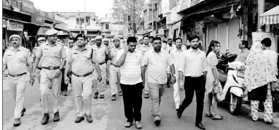
धौलपुर सामाजिक सौहार्द और धार्मिक सद्भाव बनाए रखने के लिए प्रशासन और पुलिस की ओर से धौलपुर शहरी क्षेत्र में शनिवार शाम को फ्लैग मार्च किया।

धौलपुर। सामाजिक सौहार्द और धार्मिक सद्भाव बनाए रखने के लिए प्रशासन और पुलिस की ओर से धौलपुर शहरी क्षेत्र में शनिवार शाम को फ्लैग मार्च किया गया। जो पुराना शहर, महात्मानंद की बगोची, समेत धौलपुर