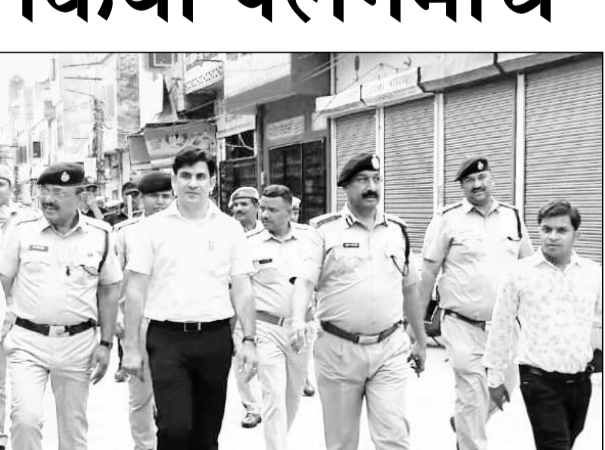
सवाई माधोपुर के प्रमुख स्थानों पर पुलिस के जवानों ने फ्लैगमार्च निकाला।

थाना अधिकारियों को दें। जिले के अमन चैन को नुकसान पहुंचाने वाले असामाजिक तत्वों को किसी भी परिस्थिति में बख्शा नहीं जाएगा उनके खिलाफ कठोर दण्डनात्मक कार्यवाही की जाएगी। जिला पुलिस अधीक्षक ने बताया कि सभी उपखण्ड मुख्यालय पर पुलिस जवानों द्वारा फ्लैगमार्च किया गया है।