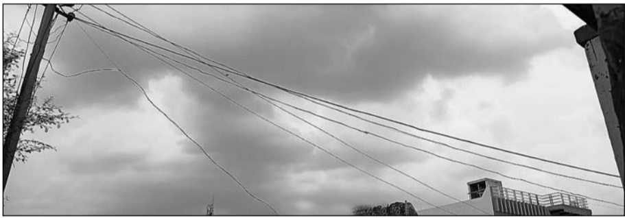
सादुलपुर में बरसात से पूर्व आसमान में छाये घने काले बादल।

सादुलपुर, (निर्सं।) सादुलपुर में शनिवार शाम को 2.30 बजे मौनसून सक्रिय होता नजर आया तथा हरियाणा सीमावृत्ती गाँवों में घनघोर घटाओं में उमड़-धुमड़कर तेज घने काले बादलों के साथ करीबन 20 मिनट तक कहीं अच्युती तो कहीं हल्की बारिश हुई। इस दौरान भाकरा, खैरू बडी, खैरू छोटी, राधा बडी, राधा छोटी