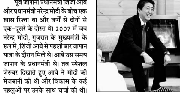
द्विदस की एक श्रृंखला में पीएम मोदी ने आबे के निधन पर गहरा दुःख व्यक्त किया है

पूर्व जापानी प्रधानमंत्री शिंजो आबे और प्रधानमंत्री नरेन्द्र मोदी के बीच एक खास रिश्ता था और वर्षों से दोनों से एक-दूसरे के दोस्त थे। 2007 में जब नरेन्द्र मोदी, गुजरात के मुख्यमंत्री के रूप में, शिंजो आबे से पहली बार जापान यात्रा के दौरान मिले थे। आबे उस समय जापान के प्रधानमंत्री थे। तब स्पेशल जेस्चर दिखाते हुए आबे ने मोदी की मेजबानी की थी और विकास के कई पहलुओं पर उनके साथ चर्चा की थी।