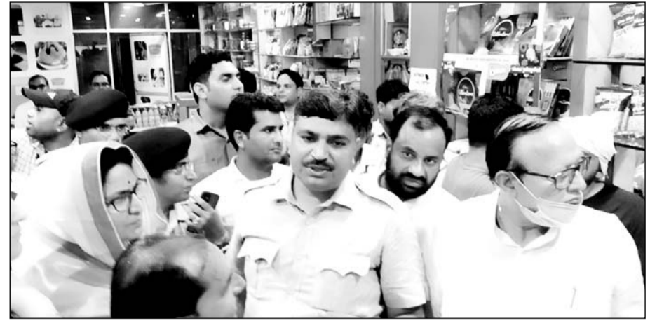
फायरिंग की घटना के बाद मौके पर पहुंचे मंत्रियों व पुलिस अधिकारियों ने घटना का जायज लिया।