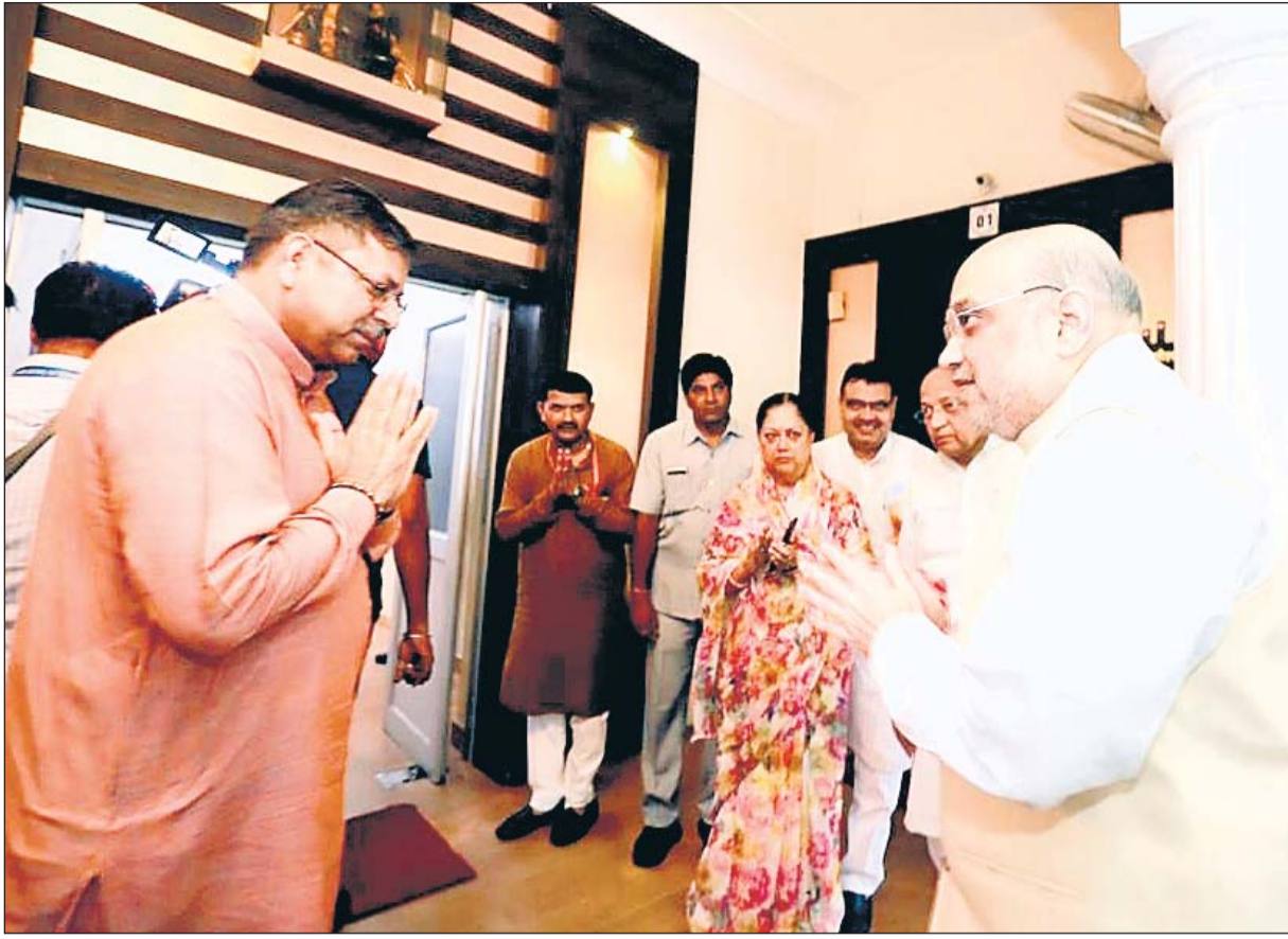
केन्द्रीय गृह मंत्री अमित शाह का जयपुर यात्रा के दौरान पार्टी के प्रदेश मुख्यालय में प्रदेश भाजपा अध्यक्ष सतीश पूनिया ने भावभीना स्वागत किया। इस दौरान अमित शाह ने प्रदेश भाजपा के सभी वरिष्ठ नेताओं से मुलाकात की।