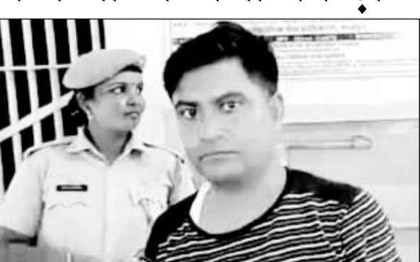
टीचर ने आईडी कार्ड चेक कर फर्जी अभ्यर्थी को पुलिस को सौंपा।

भरतपुर (निर्सं।) भरतपुर में राजस्थान कर्मचारी चयन बोर्ड जयपुर द्वारा आयोजित ग्राम विकास अधिकारी (मुख्य) सीधी भर्ती परीक्षा 2021 का पेपर देते फर्जी अभ्यर्थी को पकड़ा है। युवक किसी दूसरे परीक्षार्थी की जगह पेपर दे रहा था। आईडी कार्ड चेक करते समय टीचर ने जब फर्जी अभ्यर्थी का कार्ड देखा तो शक हुआ जिसके बाद टीचर ने पुलिस को सूचना देकर आरोपी को गिरफ्तार कर लिया।