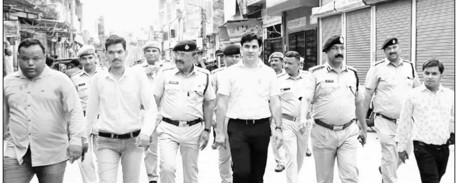
सवाई माधोपुर के प्रमुख स्थानों पर पुलिस के जवानों ने फ्लैगमार्च निकाला।

जिला मजिस्ट्रेट ने ईदुल जुहा के अवसर पर अनाम को मुबारकबाद देते हुए सभी को इस त्योहार को आपसी भाई चारे से मनाने व जिले के अमन एवं शांति के महौल को कायम रखने की अपील की। उन्होंने कहा कि अफीक की अग्रिय घटना की सूचना तत्काल जिला मजिस्ट्रेट कार्यालय, जिला पुलिस अधीक्षक कार्यालय एवं संबंधित पुलिस