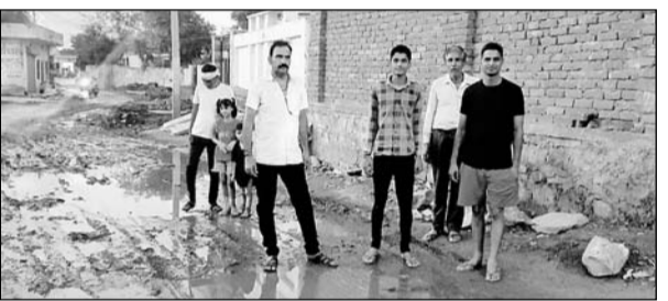
हिण्डौन सिटी के बयाना रोड से जाट की सराय तक का रास्ता जर्जर हो चुका है। इससे लोगों को आवागमन में परेशानी होती है।

हिण्डौन सिटी (का.सं.)। शहर के बयाना रोड से जाट की सराय तक का रास्ता पूरी तरह जर्जर हो चुका है। जगह-जगह गड्ढे बने हुए जिससे लोगों का निकलना तक मुश्किल हो रहा है। समस्या से परेशान होकर लोगों ने प्रदर्शन किया वहीं जनप्रतिनिधि और प्रशासन के अधिकारियों पर बार-बार सड़क निर्माण की मांग को अनसुनी करने का आरोप भी लगाए हैं।