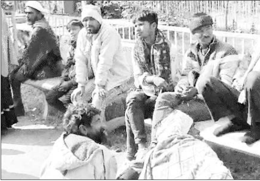
परिजनों की मौजूदगी में शवों का पोस्टमॉर्टम कराया गया।

गंगापूर सिटी, बौली-बामनवास, (निर्स)। नीम-हकीम से नशा छुड़ाने की दवा लेकर निकले दो भाइयों की तबीयत बिगड़ गई। हालत इतनी बिगड़ी कि दोनों ने नाग देवता के स्थान के बाहर ही दम तोड़ दिया। लोगों ने दोनों को अस्पताल पहुंचाया, जहां डॉक्टर ने उनको मृत घोषित कर दिया। जानकारी मिलने पर पुलिस अस्पताल पहुंची, लेकिन परिजनों ने किसी भी प्रकार की कार्रवाई से इनकार कर दिया है। पुलिस ने पोस्टमॉर्टम करवाकर शव परिजनों को सौंप दिया। नाग देवता के स्थान पर नशा का इलाज करने वाले युवक का दावा है कि वह बरसों पुरानी राख, लहसुन की चटनी और एक खास तरह का मिश्रण देकर इलाज करता है। मामला गंगापूर सिटी के पिपलाई गांव का है।