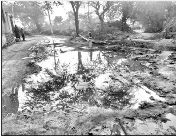
ग्राम श्योपुरा में मुख्य मार्ग पर गंदगी फैली हुई है।

मसूदा, (निर्स)। मसूदा उपखंड क्षेत्र की निकटवर्ती ग्राम पंचायत देवमाली के ग्राम श्योपुरा में मुख्य मार्ग पर गंदगी व पानी का भराव होने से लोगों को भारी परेशानियों का सामना करना पड़ रहा है। लोगों के अनुसार इस गंदगी से बीमारी फैलने का अंदेश भी है।