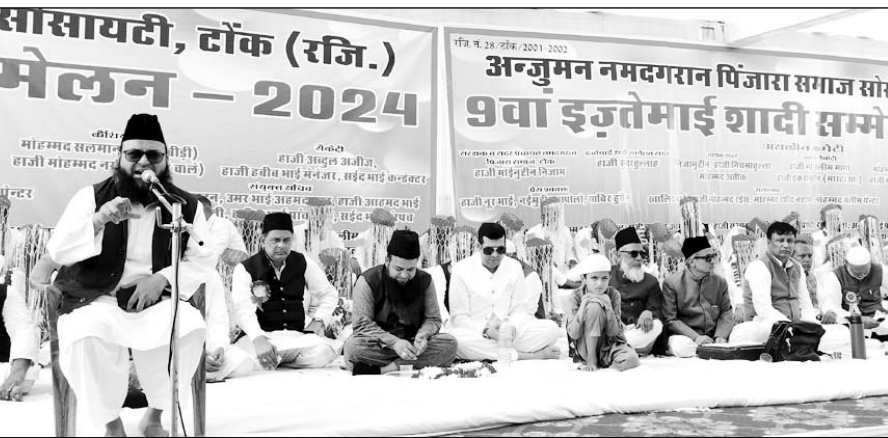
अंजुमन नमदगरान पिंजारा समाज सोसायटी टॉक ने 54 जोड़ों का निकाह कराया।

टॉक, (निर्स)। अंजुमन नमदगरान पिंजारा समाज सोसायटी टॉक द्वारा इस्तेमाई शादी सम्मेलन का आयोजन किया गया, जिसमें 54 जोड़ों का निकाह कराया गया। सम्मेलन के संरक्षक हाजी मोईनुद्दीन निजाम की निगरानी में शादी सम्मेलन की सारी तैयारियां पूरी की गईं।