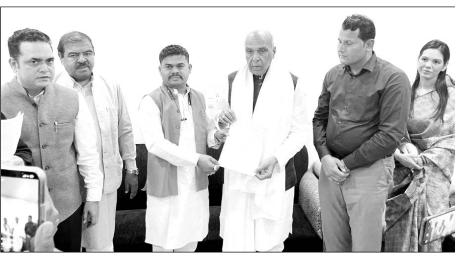
वक्फ संशोधन बिल के लिये मुस्लिम संगठनों ने समिति के अध्यक्ष सांसद जगदंबिकापाल से मुलाकात कर समर्थन पत्र सौंपा।

वक्फ संशोधन को हथियार बनाकर देश को टुकड़ों में बांटने का काम कर रहे हैं। उन्होंने स्वीकार किया कि हमें मंथन करना चाहिए कि वक्फ