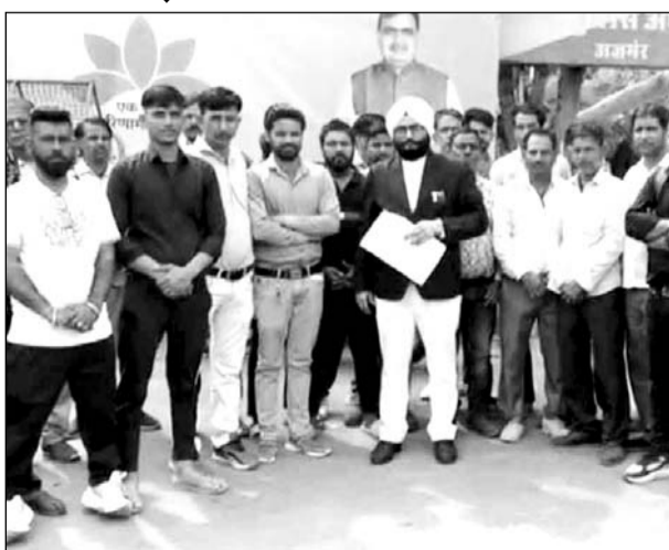
कलेक्ट्रेट पर पीड़ित लोगों ने प्रदर्शन किया।