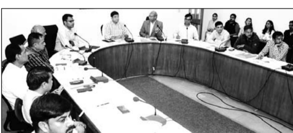
कोटा में कांग्रेस पदाधिकारी के सामने कांग्रेसी कार्यकर्ताओं और नेता द्वारा नाराजगी जताई गई है।

कोटा, (नि.सं.)। कोटा में कांग्रेस का आपसी टकराव थमने का नाम नहीं ले रहा है। कई मौकों पर कांग्रेस के नेता और कार्यकर्ता संगठन प्रमुख पर आरोप लगाते ही रहे हैं और इस दौरान सार्वजनिक तौर पर विवाद भी खड़ा होता रहा है। इन घटनाक्रमों की जानकारी जिला प्रभारी के पास भी है परंतु अनुशासनहीनता पर अभी तक कोई कार्रवाई कांग्रेस की तरफ से नहीं हुई है। अब आलम यह है कि कांग्रेस नेता सरकार से लड़ने की रणनीति बनाने के लिए अलग-अलग जिलों के दौरे पर जा रहे हैं।