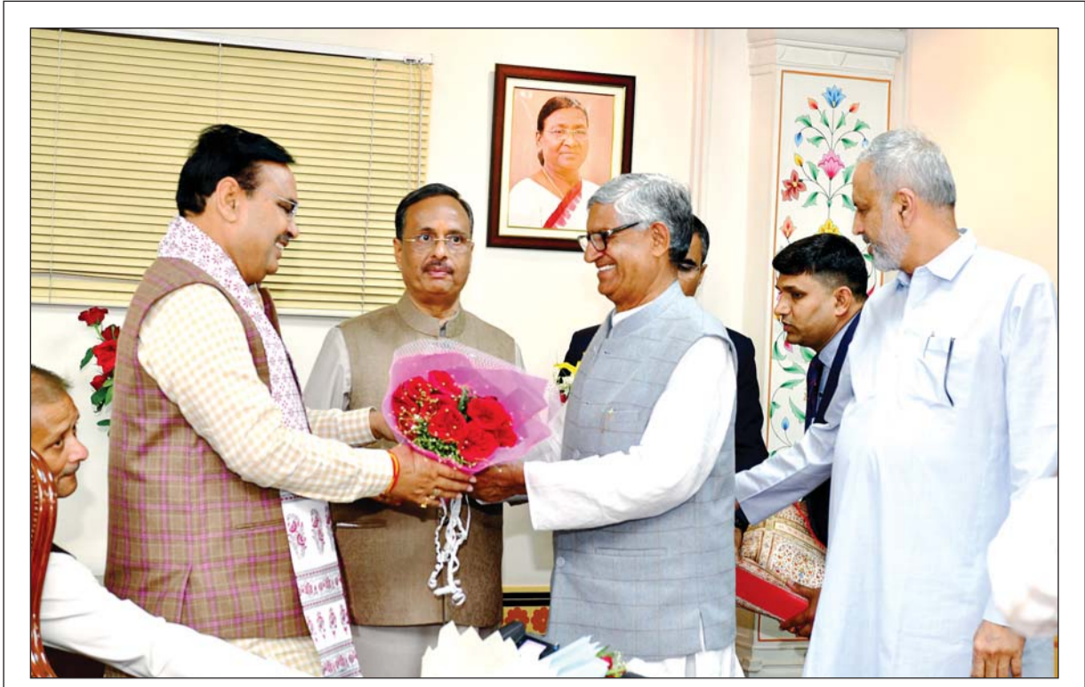
मुख्यमंत्री भजनलाल शर्मा से मंगलवार को विधानसभा में संसदीय राजभाषा समिति गृह मंत्रालय की प्रथम उप समिति के संयोजक और सांसद डॉ. दिनेश शर्मा एवं समिति के सदस्यों ने मुलाकात की। डॉ. दिनेश शर्मा उत्तर प्रदेश से राज्यसभा सांसद हैं और 2017 से 2022 तक उत्तर प्रदेश के उपमुख्यमंत्री रहे हैं। डॉ. दिनेश शर्मा के नेतृत्व वाली उपसमिति विभिन्न सरकारी कार्यालयों में हिन्दी कार्य संचालन का निरीक्षण करती है।