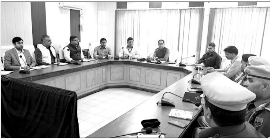
रीट परीक्षा के सफल क्रियान्वयन हेतु समीक्षा बैठक आयोजित आयोजित हुई।

उन्होंने परीक्षा केंद्रों पर भीड को नियंत्रित करने के लिये पर्याप्त पुलिस जाटा लगाने के निर्देश पुलिस