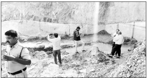
खनिज अभियंता चित्तौड़गढ़ के क्षेत्राधिकार में टीम ने कार्रवाई की।

उदयपुर, (कासं)। अतिरिक्त निदेशक माइंस उदयपुर जोन दीपक तंवर के निर्देशन में खान विभाग की टीम ने चित्तौड़गढ़ के भूपालसागर के पारी गांव में अवैध खनन के खिलाफ बड़ी कार्रवाई की। टीम द्वारा खनिज क्वार्टज का मौके पर 16-16 टन वजन के दो ब्लॉक और एक्सकवेटेड माल पकड़ा गया। इसके साथ ही किए गए खनन का अंकलन करने पर 2592 टन अवैध खनन पाया गया। खनिज क्वार्टज की कीमत लगभग 50 हजार प्रति टन बताई जा रही है। इस तरह से करीब 6 करोड़ रुपये से अधिक के क्वार्टज खनिज का अवैध खनन पाया गया है। अतिरिक्त निदेशक तंवर ने खनिज अभियंता चित्तौड़गढ़ को संबंधित के खिलाफ मामला दर्ज कराने के निर्देश दिए हैं। अतिरिक्त निदेशक दीपक तंवर को