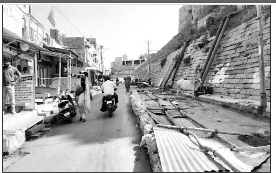
जैसलमेर सोनार दुर्ग की तीन माह पूर्व गिरी दीवार का मुख्य मार्ग, जहां पत्थर गिर गये।

जैसलमेर, (निंसां)। पर्यटन मानचित्र में विश्व प्रसिद्ध सोनार किले का दीवार करने सालाना लाखों देशी विदेशी सेलानी आ रहे हैं। केंद्र, राज्य और स्थानीय प्रशासन को पर्यटकों के जरिये सालाना करोड़ों रुपये का राजस्व प्रदान हो रहा है। वर्ल्ड हेरिटेज की लिस्ट में शामिल जैसलमेर के 868 साल पुराने सोनार किले की दीवार से मंगलवार को 4 बड़े पत्थर अचानक सड़क पर आ गिरे। भारी पत्थरों के गिरने से वहां काम कर रहे दो मजदूरों ने भागकर जान बचाई। यही नहीं, पत्थरों के गिरने से बैरिकेड के साथ-साथ बीएसएनएल का पोल भी टूटकर सड़क पर गिर गया। अचानक हुए इस हादसे से लोग भयभीत हो गए। गमतीत रही कि इस उस दौरान कोई वाहन या व्यक्ति सड़क से नहीं गुजरा, बरना बड़ा हादसा हो सकता था।