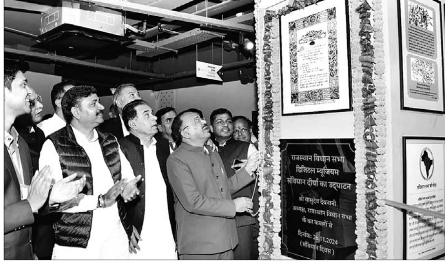
विधानसभाध्यक्ष वासुदेव देवनानी ने मंगलवार को विधानसभा में संविधान दीर्घा का लोकार्पण किया।

जयपुर। विधानसभाध्यक्ष वासुदेव देवनानी ने कहा है कि संविधान के प्रति अश्रद्धा पैदा ना करें। संविधान के मूल ढांचे को कोई बदल नहीं सकता है। संविधान के 22 भागों में हमारी संस्कृति और नैतिकता का विवरण है। उन्होंने कहा कि राष्ट्र का प्रत्येक नागरिक संविधान को पढ़ें, उसे जानें और उसके अनुकूल जीवन जीने का प्रयास करें। संविधान हमारी आत्मा और पवित्र ग्रंथ है। यह हमारे जीवन मूल्य व संस्कृति का स्वाभिमान था है। संविधान सिर्फ एक कानूनी दस्तावेज नहीं है, बल्कि लोकोत्तमिक भारत के लोगों की आकांक्षाओं, मूल्यों और आदर्शों का प्रतिबिम्ब है। देवनानी मंगलवार को विधानसभा में संविधान दिवस पर आयोजित समारोह में राजनैतिक आख्यान संग्रहालय में नवनिर्मित संविधान दीर्घा का लोकार्पण किया। इस संविधान दीर्घा में मूल संविधान के 22 भागों के आरम्भ में दर्शायी गयी कलाकृतियों को प्रदर्शित किया गया है। देवनानी ने बताया कि संविधान दीर्घा का उद्देश्य आमजन और युवाओं में राष्ट्र और राष्ट्र के संविधान का बोध कराने के साथ ही संविधान, सांस्कृतिक और नैतिकता के प्रति जागरूकता लाना है। उन्होंने संविधान दिवस को संविधान निर्माताओं के प्रति श्रद्धाभाव प्रकट करने तथा उनके अविस्मरणीय योगदान के प्रति कृतज्ञता ज्ञापित करने का स्मरण दिवस बताया है।