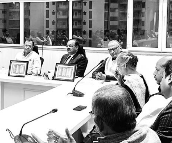
अतिरिक्त सॉलिसीटर जनरल राजस्थान उच्च न्यायालय, भारत सरकार के अन्य वकील एवं एनजीओ हेल्प्स की ओर से राजस्थान सेंटर झालाना के सभागार में 75वां संविधान दिवस कार्यक्रम मनाया गया।