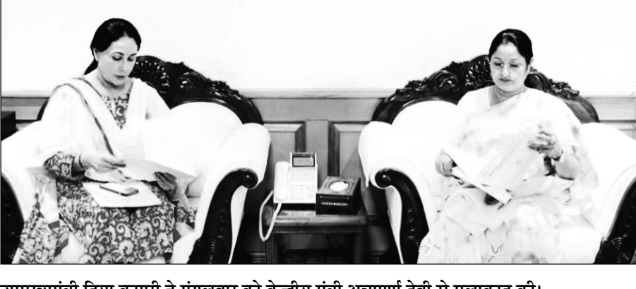
उपमुख्यमंत्री दिया कुमारी ने मंगलवार को केन्द्रीय मंत्री अन्नपूर्णा देवी से मुलाकात की।

जयपुर। देश के सभी राज्यों के महिला एवं बाल विकास विभाग का एक राष्ट्रीय चिंतन शिबिर जनवरी माह में उदयपुर में आयोजित किया जायेगा। इस चिंतन शिबिर में केन्द्रीय मंत्री समेत सभी राज्यों के महिला एवं बाल विकास मंत्री भाग लेंगे तथा आंगनबाड़ी केंद्रों, पोषाहार तथा महिला एवं बाल विकास से जुड़े विभिन्न मुद्दों पर विस्तार से चर्चा कर और राज्यों की आवश्यकतानुसार एक रोडमैप तैयार करेंगे।