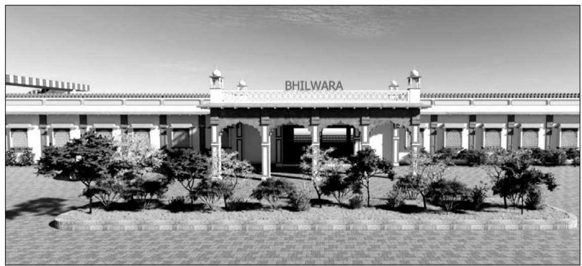
भीलवाड़ा रेलवे स्टेशन ( फाइल फोटो )।