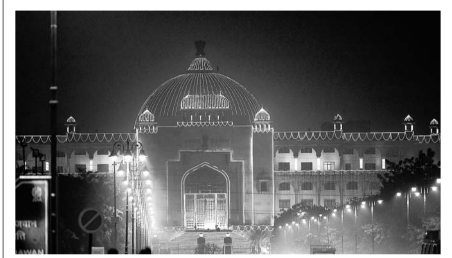
राजधानी जयपुर में डी.जी.-आई.जी. कॉन्फ्रेंस के आयोजन को देखते हुए विधानसभा सहित अन्य प्रमुख जगहों को रोशनी से सजाया गया है।

नहीं की गई। पीड़िता को मुख्यमंत्री राहत कोष से सिर्फ दस हजार रुपए दिए गए। मामला लंबित रहने के दौरान सीआरपीसी में संशोधन हुआ और पीठित प्रतिक्रमा स्कीम, 2011 लागू हुई। जिसमें नाबालिग दुष्कर्म पीड़िता को तीन लाख रुपए देने का प्रावधान किया गया। इस पर याचिकाकर्ता ने इस स्कीम के तहत मुआवजा दिलाने की गुहार की।