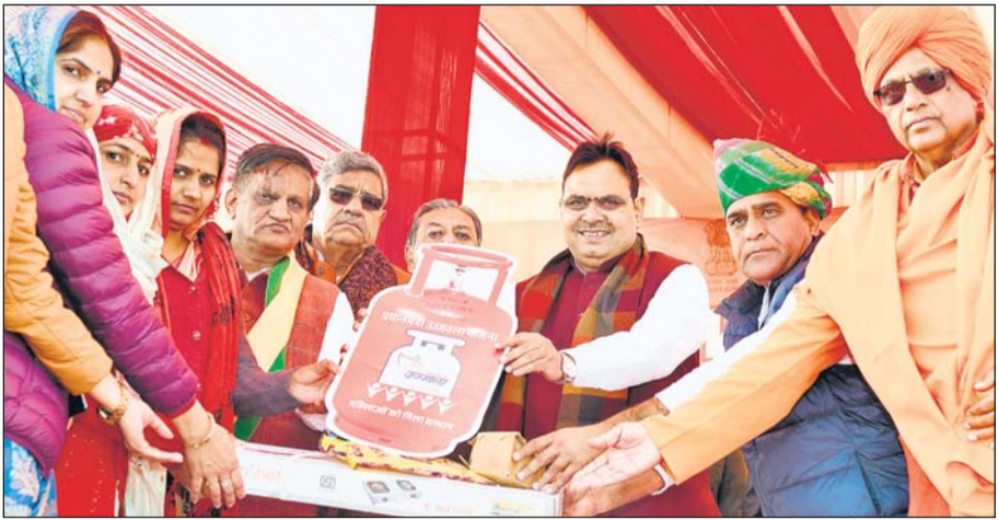
मुख्यमंत्री भजनलाल शर्मा ने बुधवार को सीकर की ग्राम पंचायत बोसाना में आयोजित 'विकसित भारत संकल्प यात्रा' शिविर में प्रधानमंत्री उज्वला योजना के लाभार्थियों को गैस सिलिण्डर व चूल्हे वितरित किए। इस अवसर पर सांसद सुमेधानंद सरस्वती, धोद विधायक गोवर्धन वर्मा, खंडेला विधायक सुभाष मील और पूर्व मंत्री सुभाष महरिया सहित कई जनप्रतिनिधि भी मौजूद थे।

■ धोद में पानी की समस्या पर कार्य योजना बना कर शीघ्र काम शुरू होगा।