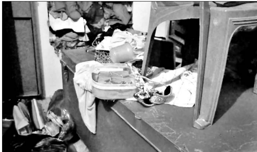
चोरी की वारदात के बाद सामान बिखरा पड़ा है।

परिवार पिछले दिनों श्रीबालाजी के दर्शन करने गया हुआ था