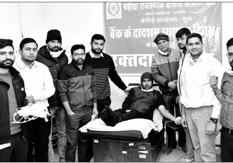
चूखू में बड़ौदा बैंक के स्थापना दिवस के उपलक्ष पर रक्तदान किया गया।