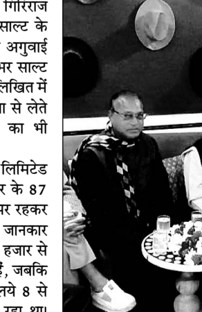
सांभर साल्ट सफिकट हाउस में केंद्रीय मंत्री गिरिराज सिंह को सांभर साल्ट प्रबंधन की भाजपाईयों ने जानकारी दी।

लम्बे समय तक दैनिक वेतन (डेलीवेज) पर नियमित कर दिया जाता था। परन्तु अभी रहने वाले कार्मिकों को 5-7 साल बाद वर्तमान कम्पनी प्रबन्धन कार्य द्वारा 20-20