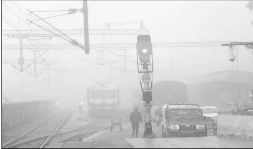
कोहरे की चादर में लिपटा अजमेर का रेलवे स्टेशन।

जीरो दृश्यता के चलते वाहन चालक हुए परेशान, सुबह कई क्षेत्रों में कोहरा छाया रहा