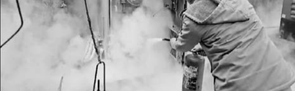
पैनल में लगी आग को बुझाया।