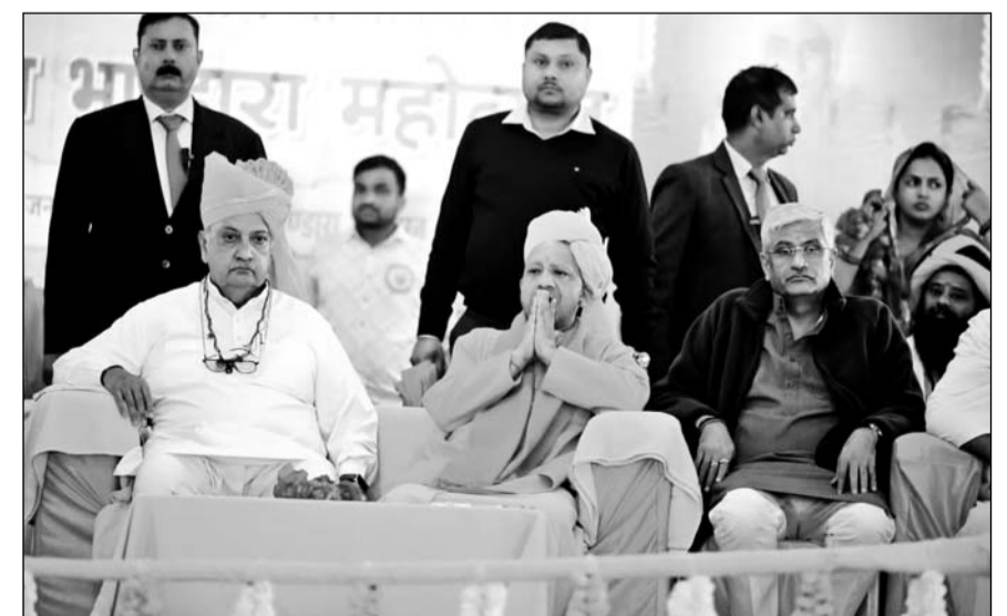
केंद्रीय मंत्री गजेंद्रसिंह, यूपी सीएम योगी आदित्यनाथ पालासनी में आयोजित कार्यक्रम में पहुंचे।

केंद्रीय जलशक्ति मंत्री गजेंद्र सिंह शेखावत आज पालासनी गांव में ब्रह्मलीन आर्यश्रम योगी कैलाशाश्रम