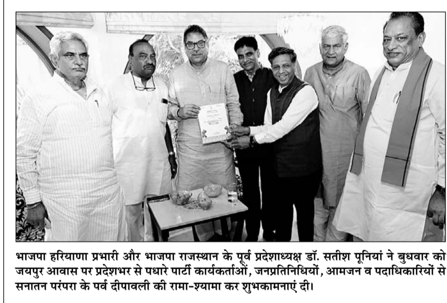
भाजपा हरियाणा प्रभारी और भाजपा राजस्थान के पूर्व प्रदेशाध्यक्ष डॉ. सतीश पूर्निया ने बुधवार को जयपुर आवास पर प्रदेशभर से पधारे पार्टी कार्यकर्ताओं, जनप्रतिनिधियों, आमजन व पदाधिकारियों से सनातन परंपरा के पर्व दीपावली की रामा-श्यामा कर् शुभकामनाएं दीं।