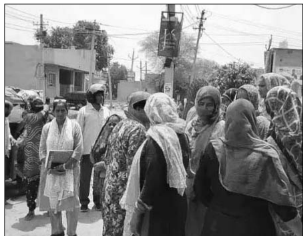
अलवर के अंबेडकर नगर विस्तार कॉलोनी के मुख्य रोड पर मंदिर के पास शराब ठेका हटाने की मांग को लेकर महिलाओं ने नारेबाजी की।

महिलाओं ने विरोध प्रदर्शन कर प्रशासन के खिलाफ जमकर नारेबाजी की और तुरंत शराब ठेका बंद करने की मांग की। महिलाओं का कहना है कि अब यहां से निकलना मुश्किल हो जाएगा। ठेका बंद कराने के लिए अलवर कलेक्टर के पास भी पहुंचे हैं।