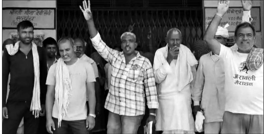
ग्राम पंचायत न्यौराणा में मजदूरों ने पंचायत कार्यालय के बाहर नारेबाजी की।

मजदूरों ने आरोप लगाया कि सरपंच और ग्राम विकास अधिकारी मनरेगा श्रमिकों के साथ भेदभावपूर्ण रवैया अपना रहे हैं। उनका कहना है कि पंचायत में बार-बार मनरेगा कार्य बंद कर दिए जाते हैं, जबकि आसपास की पंचायतों में लगातार रोजगार उपलब्ध कराया जा रहा है। इससे न्यौराणा के जांब कार्डधारी श्रमिकों को आर्थिक परेशानियों का सामना करना पड़ रहा है। श्रमिकों ने बताया कि कई बार मांग करने के बावजूद उन्हें काम नहीं दिया जा रहा है। रोजगार के अभाव