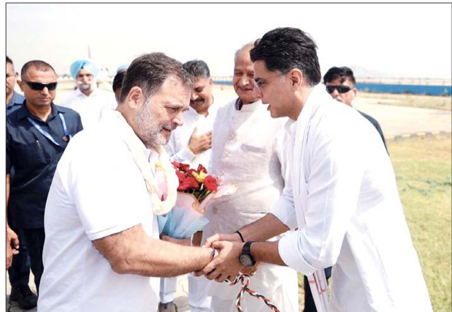
लोकसभा के नेता प्रतिपक्ष राहुल गांधी पुष्कर में नवनि्युक्त जिलाध्यक्षों के प्रशिक्षण शिविर के समापन सत्र में पहुंचे। इस दौरान कांग्रेस महासचिव सचिन पायलट व नेता प्रतिपक्ष टीकाराम जूली ने किशनगढ़ एयरपोर्ट पर उनका स्वागत किया।

उन्होंने राजस्थान में कांग्रेस प्रदेशाध्यक्ष गोविंद सिंह डोटासरा और नेता प्रतिपक्ष टीकाराम जूली की जोड़ी को "जय-वीरू" की जोड़ी जैसी बताते हुए तारीफ की। उन्होंने कहा कि यह