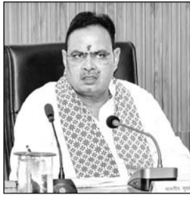
मुख्यमंत्री भजनलाल शर्मा

-कार्यालय संवाददाता- जयपुर। मुख्यमंत्री भजनलाल शर्मा के नेतृत्व में राजस्थान में आधारभूत ढांचे के विकास को नई गति मिली है। रेलवे, सड़क, ऊर्जा, पेट्रोलियम और नागरिक उड्डयन जैसे महत्वपूर्ण क्षेत्रों में बड़े स्तर पर परियोजनाओं पर काम चल रहा है। सांख्यिकी एवं कार्यक्रम कार्यान्वयन मंत्रालय की 'पैमाना' रिपोर्ट के अनुसार प्रदेश में 2.72 लाख करोड़ रुपए से अधिक लागत की कुल 81 परियोजनाएं प्रगतिरत हैं, जिससे राजस्थान की विकास यात्रा को नई दिशा मिल रही है।