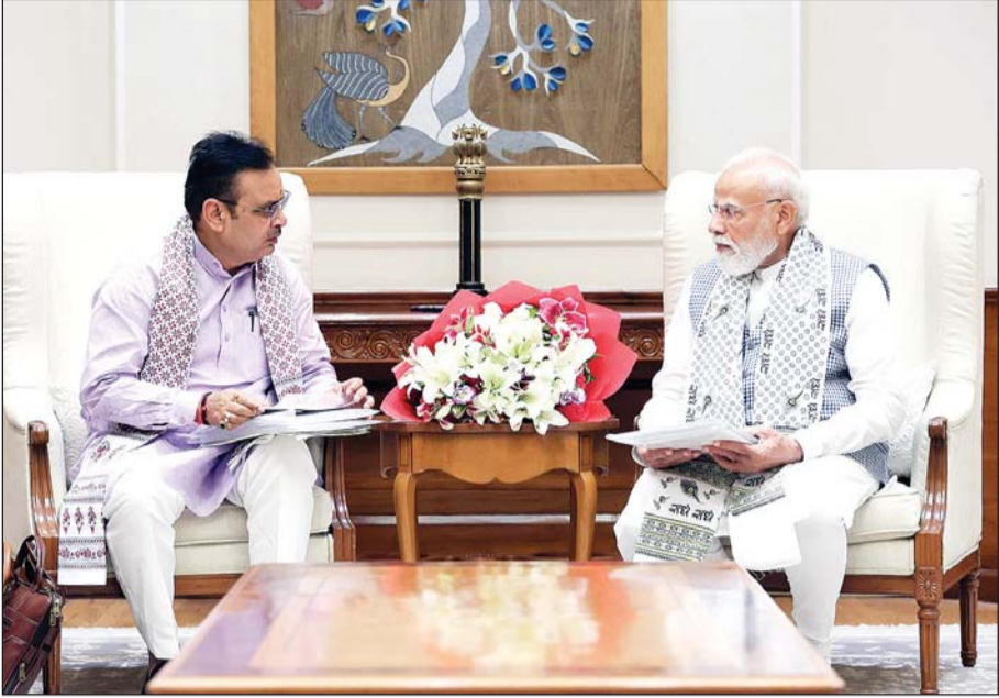
मुख्यमंत्री भजनलाल शर्मा ने सोमवार को नई दिल्ली में प्रधानमंत्री नरेन्द्र मोदी से उनके निवास पर शिष्टाचार भेंट की।

उन्होंने प्रधानमंत्री के साथ विकास, सुशासन व जन कल्याण से जुड़े विषयों पर गहन चर्चा की