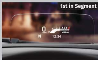
Head Up Display