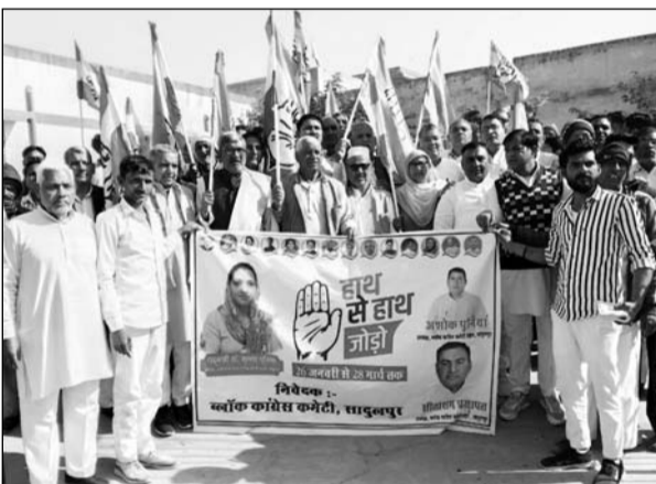
बूथ नंबर 106, 107 व 108 में ब्लॉक कांग्रेस कमेटी सादुलपुर ने 'हाथ से हाथ जोड़ो' अभियान का आगाज किया।