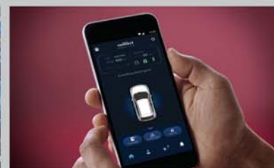
In-built Suzuki Connect

NEXA Safety Shield Standard Across All Variants