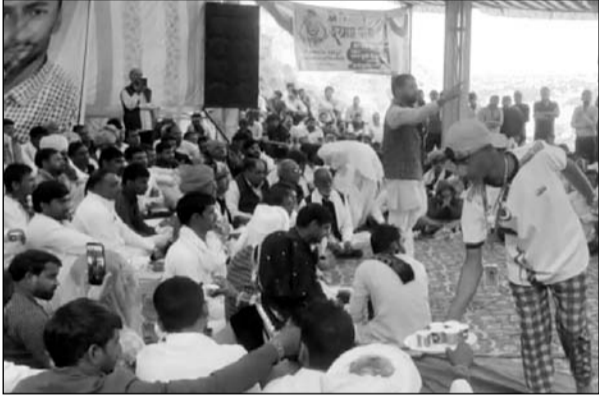
कार्यक्रम में आमजन के साथ कई जनप्रतिनिधियों ने हिस्सा लिया।

पाटन, (निसं)। निकटवर्ती ग्राम पंचायत दलपतपुरा में लादी परिवार की ओर से जीण माता मंदिर प्रांगण में रात्रि एवं भंडारे के दिन जागरण एवं भंडारे का आयोजन किया गया, जिसमें सांस्कृतिक कार्यक्रम के साथ-साथ कई जनप्रतिनिधियों ने भी हिस्सा लिया।