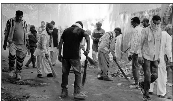
महासफाई अभियान में सेवा कार्य में जुटी साध-संगत।

वहीं इस खुशी में राजस्थान प्रदेश की साथ संगत ने पूरे राज्य में एक साथ सफाई अभियान चलाकर राज्य को निखाया। इस सफाई महा अभियान की शुरुआत साध संगत के आग्रह पर पूज्य गुरु संत डॉ. गुरमीत राम रहीम सिंह जी इन्सा ने यूपी के शाह सतनाम जी आश्रम बरनावा से ऑनलाइन स्वयं झाड़ू लगाकर किया। वहीं इस कार्य अभियान का शुभारंभ राजस्थान क्रीडा परिषद अध्यक्ष पदमश्री डॉ. कृष्णा पूर्निया ने किया। इसके पश्चात एक साथ पूरे राजस्थान के हर गाँव, शहर, कस्बे और संभाग के साथ-साथ चूख जिले के