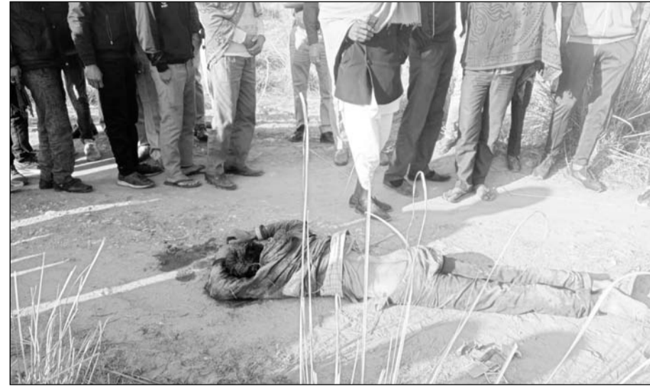
युवक की लाश मिलने के बाद मौके पर ग्रामीणों की भीड़ लग गई।

चौमू/कालाडैरा, (निर्स)। ग्राम डंगरी खुर्द के लालासर से नदी की ओर जाने वाले वाली सड़क के किनारे शनिवार सुबह एक युवक का लहलुहान हालत में शव मिलने से सनसनी फैल गई। वहीं स्थानीय लोगों ने रेनवाल थाना पुलिस को घटना की सूचना दी और सूचना मिलने पर रेनवाल थाना प्रभारी उमराव सिंह मय पुलिस जाब्ता घटना स्थल पर पहुंचे और घटनास्थल का मौका