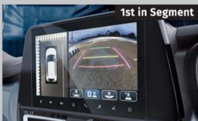
360 View Camera