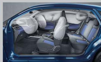
6 Airbags ^