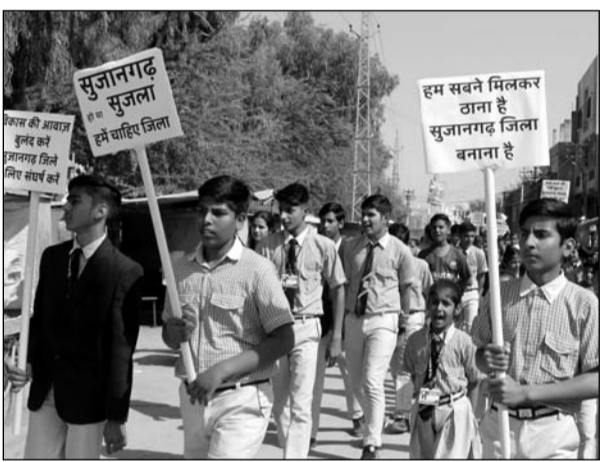
सुजानगढ़ के मुख्य मार्गों से जिले की मांग को लेकर रैली निकालते स्कूली बच्चे।