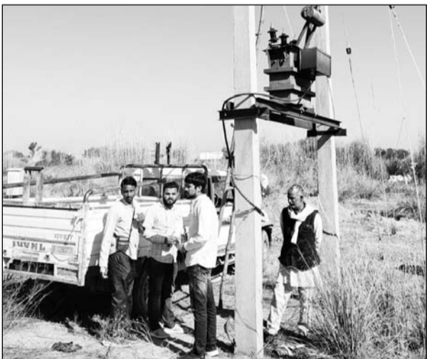
कोटपुतली में जल जीवन मिशन के नलकूपों का बिजली विभाग की टीम ने कनेक्शन काटा।