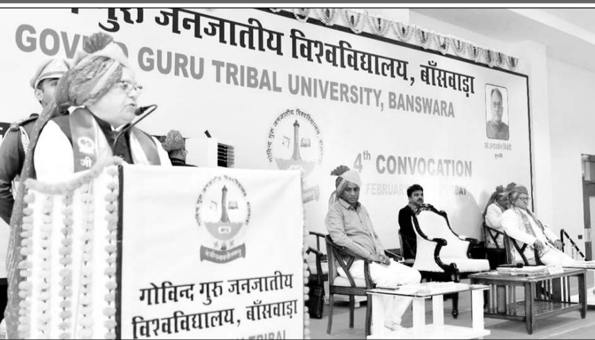
बांसवाड़ा में गोविंद गुरु जनजातीय विश्वविद्यालय के दीक्षांत समारोह को राज्यपाल ने संबोधित किया।

उन्होंने दीक्षांत समारोह में उपाधि प्राप्त करने वाले छात्रों की अपेक्षा छात्राओं की संख्या अधिक होने पर हर्ष व्यक्त करते हुए कहा कि यह बालिका शिक्षा के क्षेत्र में एक सुखद एवं सहायनी पहल है। राज्यपाल कलराज मिश्र ने समारोह में तीस टॉपर को गोल्ड मेडल व 11 शोधार्थियों को पीएच.डी की उपाधि प्रदान की। उन्होंने विश्वविद्यालय द्वारा नई शिक्षा नीति के आलोक में ऐसे पाठ्यक्रम बनाए जाने की भी आवश्यकता जताई जिससे