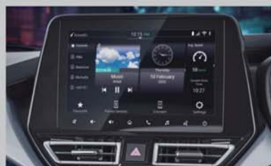
22.86cm SmartPlay Pro+