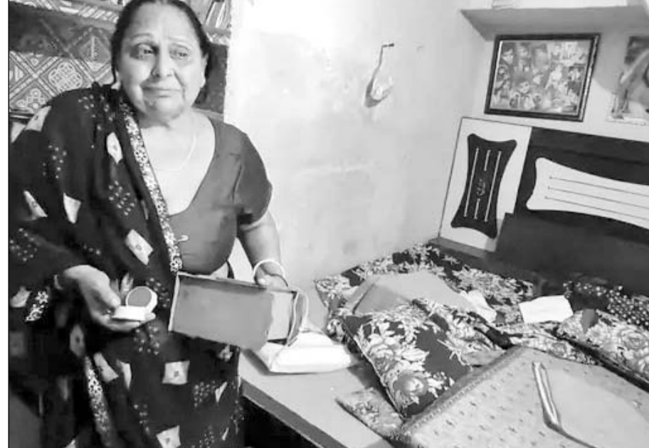
चोरी वारदात के बाद बृद्धा ने जानकारी दी।

पीड़िता अपनी भतीजी की शादी में शामिल होने गई थी