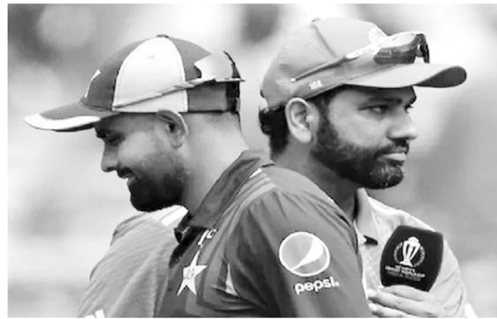
बोर्ड के अनुसार, पाकिस्तान में सुरक्षा के संबंधित दिक्कतें हैं, इसलिए टीम पाकिस्तान को कोशिश कर रहे हैं कि भारत और पाकिस्तान के बीच मैच के बिना चैम्पियंस ट्रॉफी की चमक फीकी पड़ जाएगी और सबसे अहम बात ये है कि इससे बड़े पैमाने पर वित्तीय नुकसान होगा।

नई दिल्ली, 29 नवम्बर। चैम्पियंस ट्रॉफी को लेकर आईसीसी की आज अहम बैठक कर रही है। जिसमें अगले साल होने वाली चैम्पियंस ट्रॉफी के लंबे समय से प्रतीक्षित कार्यक्रम को लेकर मुख्य चर्चा करने वाली है तो दूसरी ओर भारत सरकार की ओर से पहली बार पूरे मामले पर बयान आया है। चैम्पियंस ट्रॉफी की मेजबानी पाकिस्तान के पास है और बीसीसीआई ने आईसीसी को बता दिया है कि वह टीम को पाकिस्तान नहीं भेजेगा। पाकिस्तान दूसरी तरफ टूर्नामेंट को हाइब्रिड मॉडल के तहत आयोजित नहीं करने पर अड़ा हुआ है। आईसीसी बोर्ड की बैठक वरुअल तरीके से होगी और इसमें चैम्पियंस ट्रॉफी के कार्यक्रम को लेकर कोई हल निकलने की संभावना है। आईसीसी के फैसले से ठीक पहले भारत के विदेश मंत्रालय के प्रवक्ता रणधीर जयसवाल ने एक लाइन में बड़ा बयान दिया है। उन्होंने साफ-साफ लहजे में कहा कि, बीसीसीआई ने बयान जारी किया है।