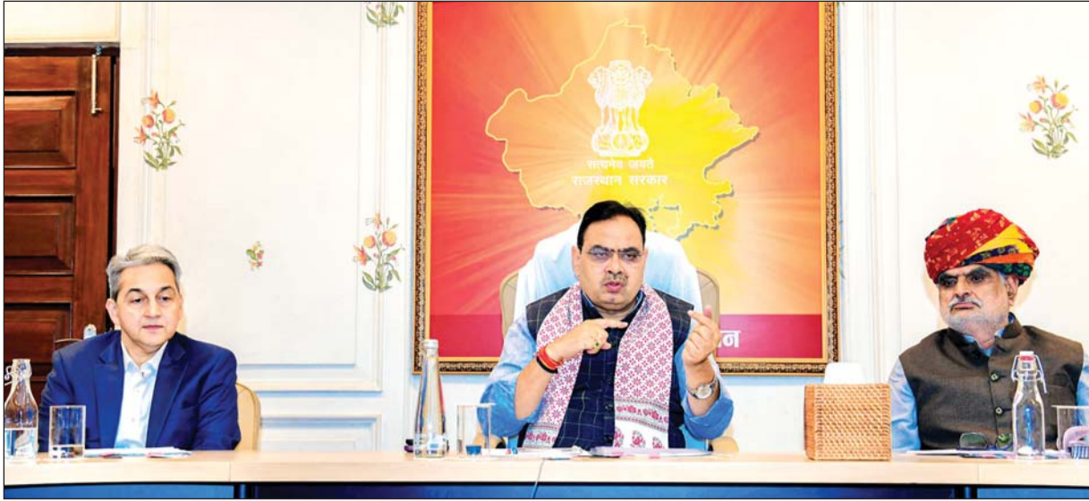
मुख्यमंत्री भजनलाल शर्मा ने नगरीय विकास विभाग की समीक्षा बैठक में विभागीय घोषणाओं की समीक्षा कर उनकी कार्यप्रगति की जानकारी ली तथा उन्हें शीघ्र पूरा करने के निर्देश दिए।