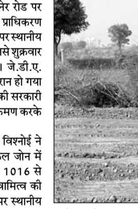
करके इस बेशकीमती 250 बीघा सरकारी जमीन पर पुनः कब्जा लिया। इसके अलावा जोन-14 में संगानेर स्थित ग्राम वाटिका में मालियों की ढाणी गुलमोहर गार्डन कॉलोनी के पास करीब 12 बीघा निजी खातेदारी कृषि भूमि पर अवैध तरीके से बसाई जा रही कॉलोनी को भी ध्वस्त किया। काश्तकार ने ना तो धू-रूपांतरण कराया और ना ही जेडीए से कोई

जयपुर (कासं)। राजधानी जयपुर में गोनर रोड पर स्थित गोविंदपुरा रोपाड़ा में जयपुर विकास प्राधिकरण की 250 बीघा बेशकीमती सरकारी जमीन पर स्थानीय काश्तकारों से अवैध कब्जा कर रखा था, जिसे शुक्रवार को जे.डी.ए. की प्रवर्तन टीम ने हटाया। जे.डी.ए. दस्ता जब यहां कार्रवाई करने पहुंचा तो हैरान हो गया कि करीब 1300 करोड़ रु. बाजार मूल्य की सरकारी जमीन पर काश्तकारों ने कई तरह से अतिक्रमण करके कब्जा जमा रखा था।