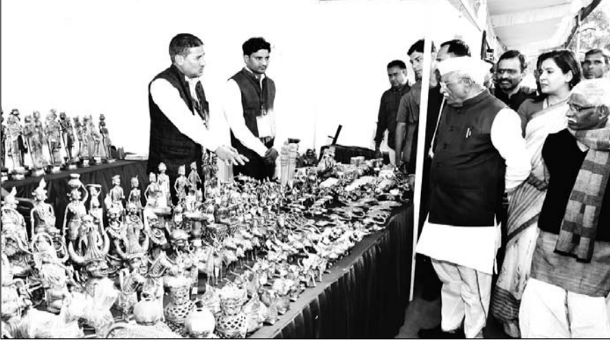
राज्यपाल हरिभाऊ किसनराव बागडे ने जवाहर कला केंद्र के शिल्प ग्राम में जनजातीय कार्य मंत्रालय, भारत सरकार, ट्राइफेड द्वारा आयोजित “आदि महोत्सव” का शुभारम्भ किया।

राज्यपाल ने आदिवासी परंपराओं के संरक्षण पर जोर देते हुए प्रकृति पोषण से जुड़े उनके कार्य अपनाए जाने की आवश्यकता जताई। उन्होंने जनजातियों के समग्र विकास के लिये उनसे जुड़े क्षेत्र की आवश्यकताओं को ध्यान में रखकर उनके आजीविका के अधिकाधिक अवसर प्रदान करने की आवश्यकता जताई। उन्होंने कहा कि देश की गरीबी तभी कम होगी जब राष्ट्र