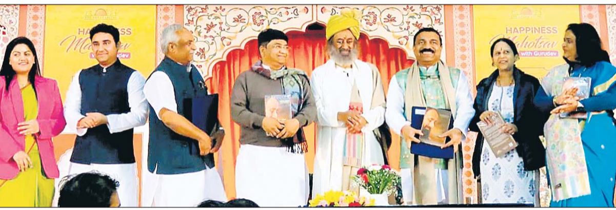
प्रसिद्ध वैश्विक आध्यात्मिक गुरु और मानवतावादी, गुरुदेव श्री श्री रविशंकर ने वर्षों के बाद जयपुर शहर का दौरा किया। अपनी बहुप्रतीक्षित यात्रा के दौरान गुरुदेव ने 3000 से अधिक प्रतिभागियों की उपस्थिति वाले एसएमएस इनडोर स्टेडियम, जयपुर में हैप्पीनेस महोत्सव के प्रतिभागियों को संबोधित किया।

जयपुर, (का.सं.)। राजस्थान विद्युत उत्पादन निगम प्रशासन के राणा प्रताप सागर पन बिजलीघर की समस्त विद्युत इकाईयों वर्ष 2019 में चंबल नदी में आई भीषण जल विभिषिका में पूर्णतः जलमग्न हो गयी थी एवं 50 वर्ष पुरानी इन इकाईयों से पुनः विद्युत उत्पादन को असंभव मान लिया गया था। राजस्थान विद्युत उत्पादन निगम प्रशासन के सक्षम मार्गदर्शन एवं अभियन्ताओं के अथक प्रयासों से राणा प्रताप सागर पन विद्युत गृह की 43 मेगावाट क्षमता की इकाई संख्या 1 से दिसम्बर 2021 एवं इकाई संख्या 4 से जून 2022 से पुनः विद्युत उत्पादन शुरू किया जा चुका है। इसी कड़ी में निरन्तर प्रयासरत रहते हुए 43 मेगावाट क्षमता की इकाई संख्या 3 को आज सिक्रोनाइज कर पुनः विद्युत उत्पादन शुरू कर दिया गया है। पूर्ण क्षमता से संचालित होने पर इस इकाई से प्रतिदिन 10.32 लाख यूनिट विद्युत उत्पादन किया जायेगा।