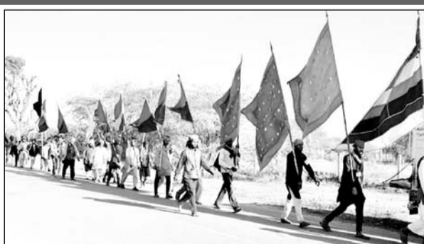
विभिन्न राज्यों से छड़ियां लेकर अजमेर दरगाह पहुंचे मलंग।

जायरीन में मची संदल पाने की होड़, कलंदरों का जुलूस आज