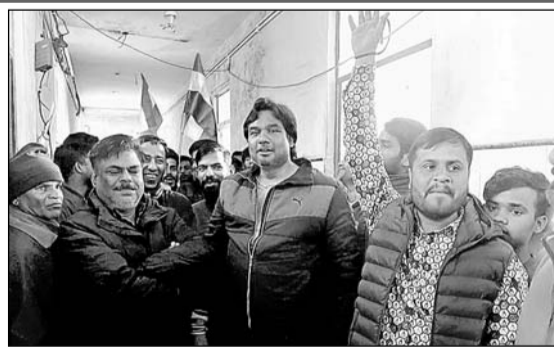
मालवीय नगर जोन पर विरोध जताते वार्ड 148 व 149 के लोग।