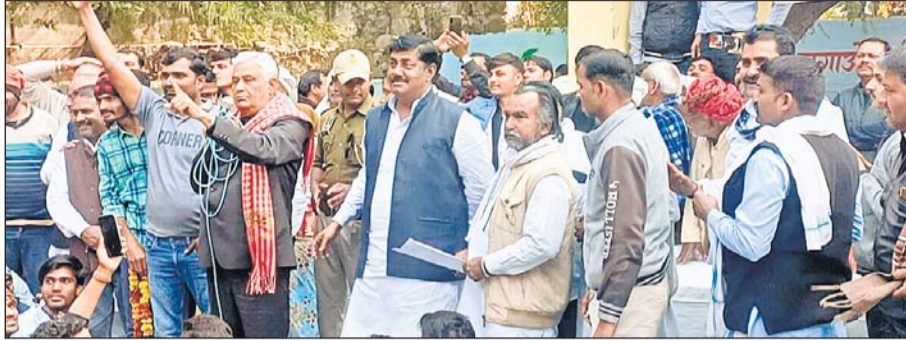
उपखंड मुख्यालय स्थित नेहरू गार्डन में जयपुर कूच एवं बेरोजगार युवा संवाद कार्यक्रम को राज्य सभा सांसद डॉ किरोडी लाल मीणा ने संबोधित किया।

इस दौरान राज्यसभा सांसद मीणा ने बेरोजगार युवाओं के साथ संवाद के दौरान संबोधन में कहा कि प्रदेश में भ्रष्टाचार बढ़ा है एवं इस भ्रष्टाचार की चपेट में लाखों युवाओं का भविष्य खराब हुआ है। राज्यसभा सांसद डॉ किरोडी मीणा ने नेहरू गार्डन में राज्य की गहलोत सरकार पर जमकर हमला बोलते हुए कहा कि प्रदेश की जनता से संपूर्ण कर्जा माफी की बात कही थी फिलान कर्जा माफ हुआ वह सबके सामने है। उन्होंने कहा की वे हजारों बेरोजगार युवाओं के साथ 24 जनवरी को विधानसभा का घेराव करेगे और