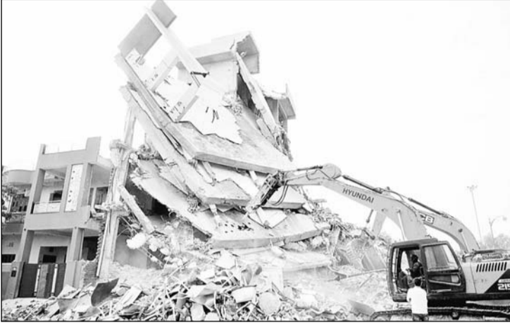
जेडीए के प्रवर्तन दस्ते ने गोपालपुरा बाईपास पर सुखविहार कॉलोनी में बनी पांच मंजिला अवैध बिल्डिंग को शनिवार को जमींदोज कर दिया।