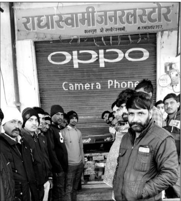
चोरी की वारदात के बाद मौके पर लोगों की भीड़ जमा हो गई।

दुकान के बाहर लगे सीसीटीवी कैमरे को भी तोड़ दिया। वहीं चोरों ने मलिकपुर गांव स्थित एक परचून की दुकान से 10 हजार की नगदी समेत अन्य सामान चुरा ले गए। गोविन्दगढ़ कस्बे में चोरी के प्रयास की फुटेज एक सीसीटीवी कैमरे में कैद हो गई। फुटेज में एक संदिग्ध बोलेंगे कार व उसमें सवार दो जने शटर तोड़ने का प्रयास करते नजर आ रहे हैं। गोविन्दगढ़ कस्बे