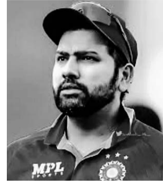
के बाद भारत के 113 पॉइंट्स हो गए हैं। पहले नंबर-1 पर काबिज न्यूजीलैंड के 2

नई दिल्ली, 21 जनवरी। टीम इंडिया ने रायपुर में खेले गए मुकाबले में न्यूजीलैंड को 8 विकेट से हरा दिया। इसके साथ ही भारतीय टीम ने 3 मैचों की सीरीज में 2-0 की अजेय बढ़त हासिल कर ली है। भारत अब वनडे रैंकिंग में नंबर-1 होने के भी बेहद करीब आ गया। रैंकिंग में अब रोहित एंड कंपनी के 113 पॉइंट्स हो गए और वह एक पायदान की छलांग के साथ तीसरे नंबर पर पहुंच गई है। अगर टीम इंडिया सीरीज का तीसरा मैच भी जीत लेती है तो वह नंबर-1 पर काबिज हो जाएगी। यह कैसे होगा आगे समझते हैं। न्यूजीलैंड के खिलाफ दूसरे वनडे से पहले भारतीय टीम 111 रैंकिंग पॉइंट्स के साथ नंबर 4 पर थी। इस मुकाबले में जीत