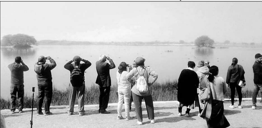
उदयपुर में बर्ड फेस्टिवल के दूसरे दिन शनिवार को विविध जलाशयों पर बर्ड वॉचिंग करते पक्षी प्रेमी।