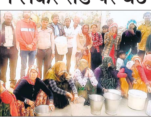
महिलाएँ रोड पर खाली बर्तन लेकर धरने पर जा बैठी और विभाग के खिलाफ गुस्सा प्रकट किया।

जिसका अभी तक कोई उपयोग नहीं हुआ है। ग्रामीणों का यह भी कहना है कि जार्ड नंबर 13 की दोनों ढाणियों में आज तक पेयजल लाइन तक नहीं बिछाई गई है। महिलाओं को 3 किलोमीटर दूर जाकर पानी लेकर आना पड़ता है। बताया जा रहा है कि पानी में भी फ्लोराइड की मात्रा