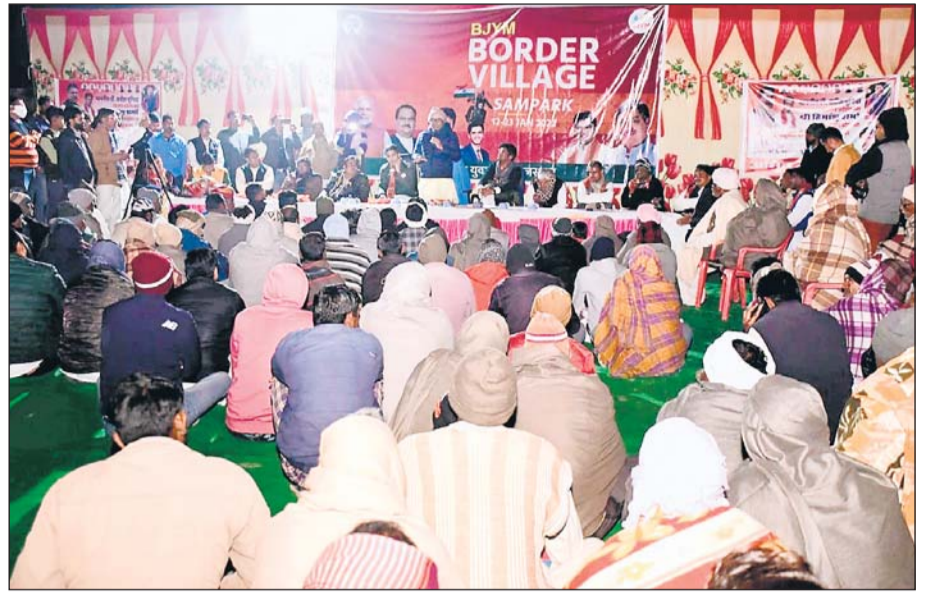
भाजपा प्रदेश अध्यक्ष डॉ. सतीश पूनियां ने वाईब्रेंट बॉर्डर विलेज कार्यक्रम में बीकानेर जिले के खाजूवाला विधानसभा क्षेत्र के कालूवाला गांव में लोगों से केन्द्र की मोदी सरकार की कल्याणकारी योजनाओं को लेकर संवाद किया।

जयपुर, बीकानेर। प्रधानमंत्री नरेंद्र मोदी के आह्वान पर देशभर में सभी वर्गों को जोड़ने के क्रम में भाजपा प्रदेश अध्यक्ष डॉ. सतीश पूनियां ने वाईब्रेंट बॉर्डर विलेज यानि जीवंत सीमांत ग्राम कार्यक्रम के तहत सीमावर्ती गांवों में आमजन से संवाद के क्रम में बीकानेर जिले के खाजूवाला विधानसभा क्षेत्र के कालूवाला गांव में रात्रि प्रवास कर आज रात बिता रहे हैं, जहां लोगों से केन्द्र की मोदी सरकार की कल्याणकारी योजनाओं को लेकर संवाद किया और संस्कृति पर भी विस्तृत चर्चा की।