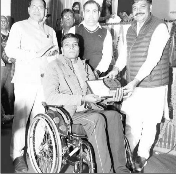
सामाजिक न्याय एवं अधिकारिता मंत्री टीकाराम जूली ने शनिवार को वर्ष 2022-23 में विशेष योग्यजनों के लिए स्कूटी वितरण योजना का शुभारम्भ किया।

सामाजिक न्याय एवं अधिकारिता मंत्री ने समारोह में 35 विशेष योग्यजनों एवं 17 विशेष योग्यजनों के लिए