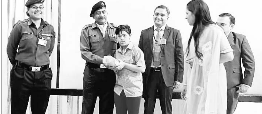
जयपुर के आमेर रोड स्थित वायुसेना विद्यालय के वार्षिकोत्सव 'प्रयास' में शनिवार को महाराणा प्रताप सभागार में मेधावी विद्यार्थियों को पुरस्कार प्रदान किये गये।