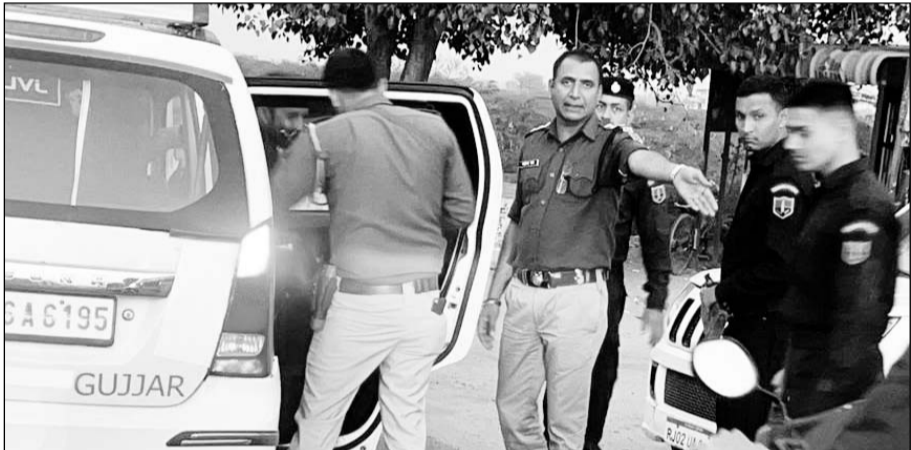
बहरोड़ पुलिस ने हरियाणा के दोनों बॉर्डर पर नाकाबंदी के दौरान वाहनों की जांच की।