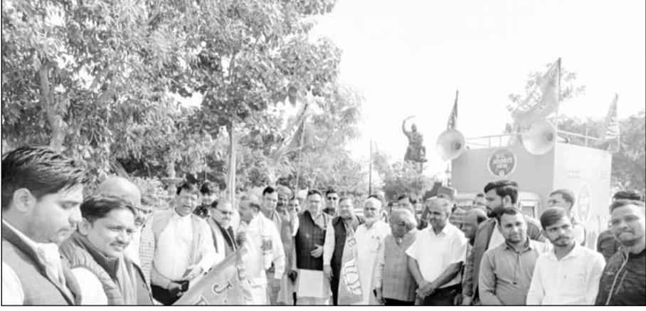
भरतपुर में भाजपा के प्रदेश महामंत्री भजन लाल शर्मा ने जनआक्रोश रथ को रवाना किया।

भरतपुर, (निस)। भारतीय जनता पार्टी की भरतपुर विधानसभा की जनआक्रोश यात्रा रथ का शुभारंभ भारतीय जनता पार्टी के प्रदेश महामंत्री भजन लाल शर्मा ने झंडी दिखाकर यातायात चौराहा महाराजा सूरजमल स्मारक से रवाना किया। यातायात चौराहे से रवाना होकर यह जन आक्रोश यात्रा गांव बछामदी, नगला बरेला, बड़ेरा, पिडयानी, इकरन, उंदरा होते हुए चिकसाना पहुंचा। इन सभी गांव में जगह जगह यात्रा का भव्य स्वागत हुआ एवं नुककड सभाएं एवं चौपालें आयोजित हुईं तथा लोगों की समस्याएं सुनी एवं लोगों ने अपनी समस्याओं को पत्रक में लिखकर शिक्षागत पेटी में डाला। नुककड सभा एवं चौपालों को संबोधित करते हुए प्रदेश महामंत्री भजनलाल शर्मा ने कहा जनआक्रोश यात्रा के माध्यम से जो पेंसिलर केंद्रों पर सरकार का रथ है और जो बादा खिलाफी गहलोल सरकार ने की है उसे जनता तक पहुंचा सके। पिछले 4 साल के अंदर राजस्थान की सरकार के जो काम हैं वह जनता के