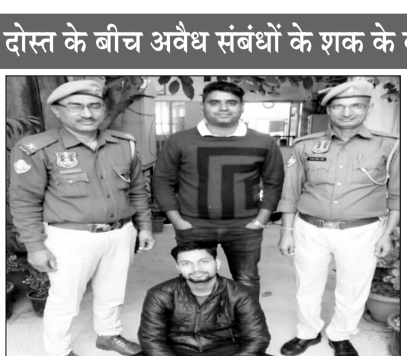
सिंधी कैंप थाना पुलिस ने युवती को जहर देकर मारने वाले शातिर आरोपी को गिरफ्तार किया।

प्रेमिका और उसके दोस्त के बीच अवैध संबंधों के शक के कारण की थी हत्या