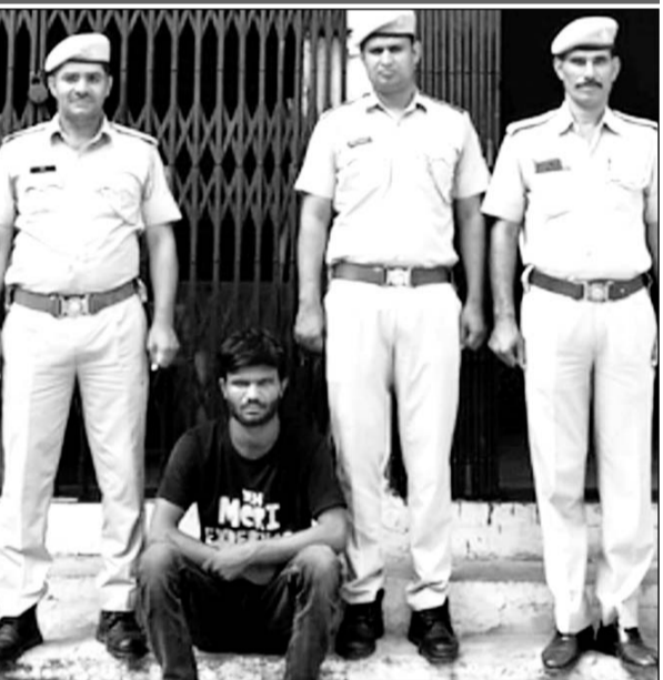
पुलिस ने त्वरित कार्रवाई कर आरोपी को गिरफ्तार किया।

दौसा, (निर्स)। नाबालिग से दुष्कर्म के मामले में जेल गए आरोपी द्वारा जमानत मिलने पर पीड़िता के परिजनों को धमकी देकर पैसे की मांग करने का मामला सामने आने पर पुलिस ने त्वरित