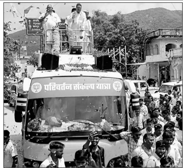
बीजेपी की संकल्प परिवर्तन यात्रा का फूल बरसाकर स्वागत किया।

जयपुर/पुष्कर। भाजपा परिवर्तन संकल्प यात्रा 15 सितंबर को अजमेर और नागौर जिले में विभिन्न विधानसभा क्षेत्रों में पहुंच रही है। भाजपा परिवर्तन संकल्प यात्रा अजमेर से पुष्कर के नागेश्वर महादेव मंदिर पुष्कर घाटी, हरबल गार्डन, रामधाम चौराहा, महात्मा ज्योतिबा फुले राष्ट्रीय संस्थान पर जेसीबी से पुष्करवां कर स्वागत किया गया तथा युवा मोर्चा ने मोटरसाइकिल पर केसरिया साफा पहनकर रैली निकाली गई। रथ पर भाजपा के राष्ट्रीय महामंत्री एवं प्रदेश प्रभारी अरुण सिंह, विधानसभा उपनेता प्रतिपक्ष डॉ. सतीश पूनिया, राज्यसभा सांसद राजेंद्र गहलोत ने कार्यकर्ताओं व आमजन का अभिनंदन किया।