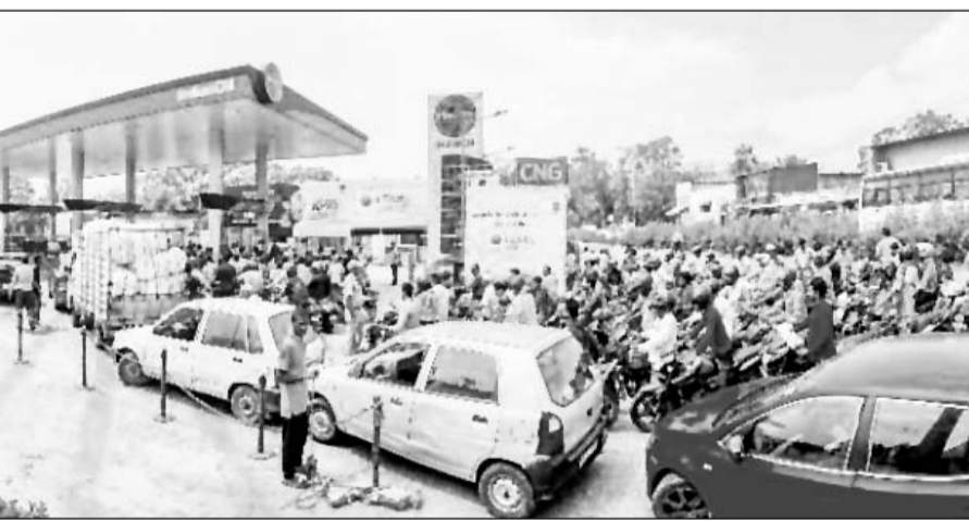
पेट्रोल पंप संचालकों की हड़ताल स्थगित होने के बाद शुक्रवार को पेट्रोल-डीजल भरवाने वालों की कतारें लग गईं।