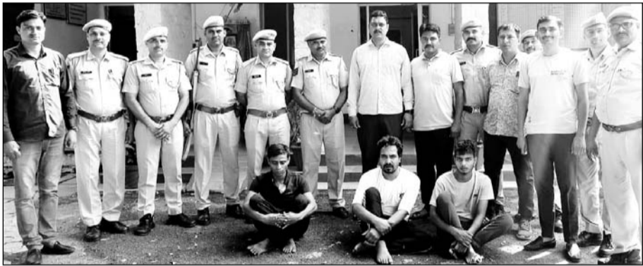
पुलिस ने दोहरे हत्याकांड मामले में आरोपियों को गिरफ्तार किया।

झालावाड़, (निर्स)। दोहरे हत्याकाण्ड के मामले में पुलिस ने चार आरोपियों को गिरफ्तार किया है। पुरानी रंजिश के चलते की दम्पती की हत्या की जानकारी सामने आई है।