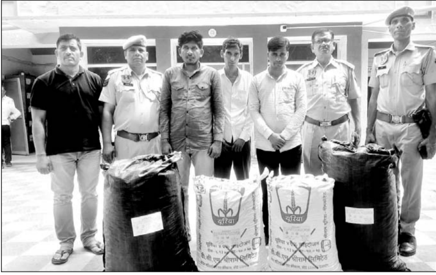
पुलिस मुख्यालय क्राइम ब्रांच की टीम ने तस्करों को पकड़ा।

जयपुर, (निसं)। पुलिस मुख्यालय क्राइम ब्रांच की टीम ने जयपुर आयुक्तालय के थाना चौमूँ और जयपुर ग्रामीण जिले के अमरसर थाना इलाके में मादक पदार्थों की तस्करी में लिप्त चार तस्करों को पकड़वा कर 72 किलोग्राम अवैध अफीम डोडा पोस्त बरामदगी की कार्रवाई की है।