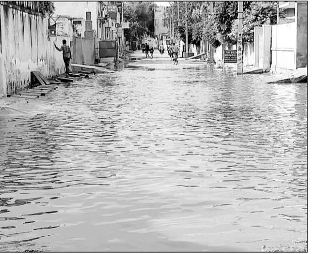
बीदासर में बरसात के बाद बड़ौदा बैंक मार्ग पर पानी भर गया।

बीदासर, (निसं)। कस्बे में गुरुवार की रात्रि नौ बजे के बाद आसमान में बादल छा गये तथा तेज आवाज के साथ बिजली कड़कने के साथ हल्की बरसात हुई। जिससे लम्बे समय से गर्मी व उमस से परेशान आमजन को मौसम में ठण्डक झुल जाने से राहत मिली। लगभग 15 मिनट तक हुई बरसात से कस्बे के मुख्य मार्गों पर पानी ही पानी हो गया जिससे आमजन को परेशानियों का सामना करना पड़ा। वहीं शुक्रवार की सुबह 8 बजे बाद फिर हल्की बरसात का दौर शुरू हुआ जो आधे घण्टे तक रिमझिम बरसात के रूप में चला। जिससे कस्बे के मुख्य मार्गों पर कीचड़ ही कीचड़ हो गया। जमकर बरसात नहीं होने से दिनभर गर्मी व उमस से लोग हाल बेहाल रहे।