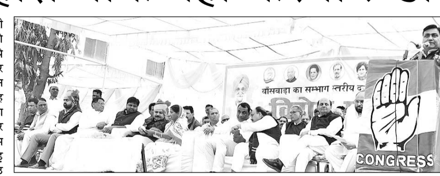
बांसवाड़ा को संभाग का दर्जा खत्म किये जाने को लेकर धरना प्रदर्शन कार्यक्रम आयोजित हुआ।

उन्होंने कहा कि आने वाले विधानसभा सत्र में हम लोग सरकार को छठी का दूध याद दिला देंगे। उन्होंने आने वाले पंचायत और नगर पालिका चुनाव के लिये कमर कसने का आह्वान किया और कहा कि राजीव गांधी ने पंचायत चुनाव के लिये रोज पांच साल में चुनाव का कानून बना दिया था, लेकिन ये लोग संविधान को