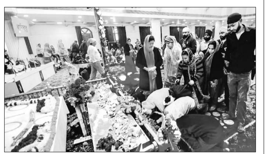
जयपुर के राजापाक गुरुद्वारे में गुरु गोबिंद सिंह जयंती पर विशेष रूप से सजाया गया और विशेष पूजा की गई। वहीं सुबह से ही अटूट लंगर बरताया गया।

जिलों का दर्जा समाप्त कर दिया गया है। गंगपुर सिटी से जिला का दर्जा समाप्त करने के पीछे भी सरकार की राजनीतिक द्वेषता ही है। याचिका में कहा गया कि सरकार ने करीब डेढ़ साल पहले गंगपुर सिटी को जिला बनाया था और उसके बाद यहाँ कई प्रशासनिक नियुक्तियाँ हो चुकी हैं। वहीं विभाग भी बतौर जिला स्तर पर काम कर रहे हैं। कमेटी ने लोगों से आपत्तियाँ मांगने के बाद इसे जिला घोषित किया था। ऐसे में अब महज राजनीतिक द्वेषता के चलते इसे जिला निरस्त करना गलत है। गौरतलब है कि पूर्ववर्ती कांग्रेस सरकार ने अगस्त, 2023 में 3 नए संभाग और 19 जिलों का गठन किया था।