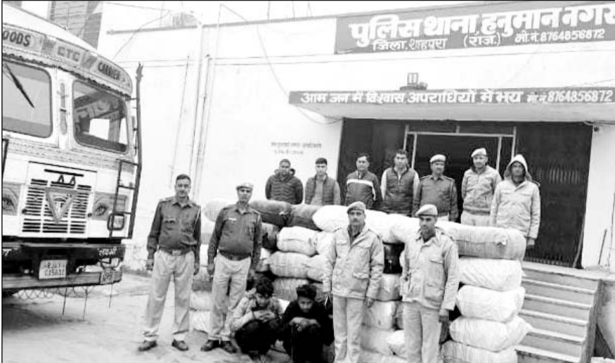
हनुमान नगर थाना पुलिस ने करोड़ों का गांजा बरामद कर तस्करों को गिरफ्तार किया।