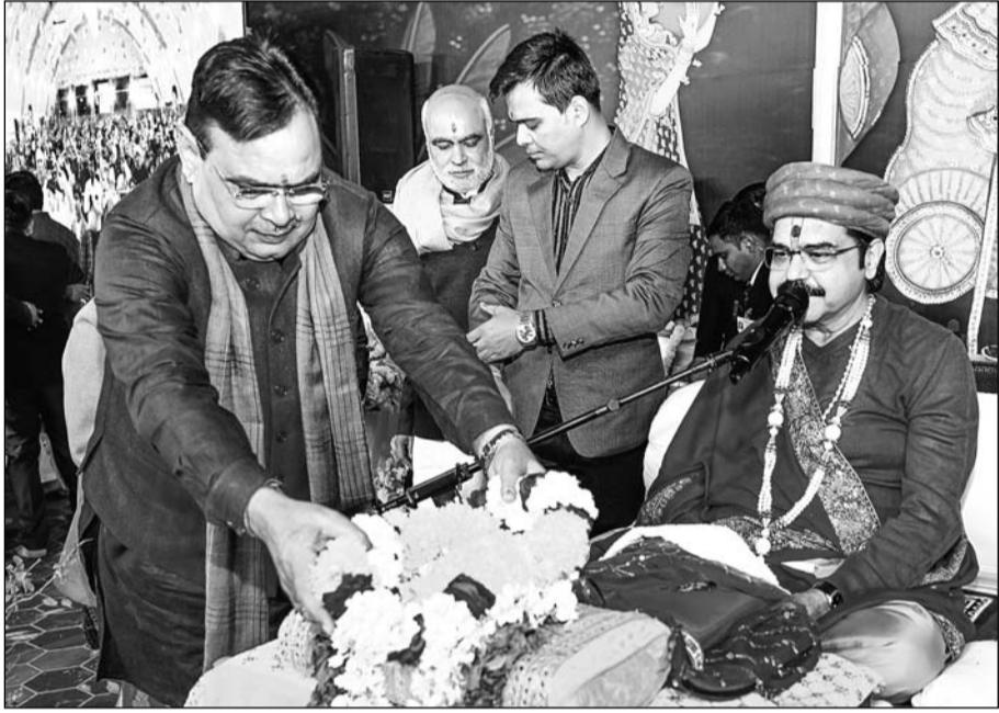
मुख्यमंत्री भजनलाल शर्मा ने सोमवार को विद्याधर नगर में सपत्नीक सुप्रसिद्ध कथा वाचक मृदुल कृष्ण महाराज की भागवत कथा का श्रवण किया।

जयपुर। गिराज संघ परिवार विश्वकर्मा जयपुर के 26 वें वार्षिकोत्सव पर एक विद्याधर नगर सेक्टर-7 स्थित अग्रसेन हॉस्पिटल के पीछे स्थित प्रांगण में चल रही 108 विशाल श्रमद भागत ज्ञानयज्ञ के छठवें दिन सोमवार को व्यासपीठ से आचार्य गोस्वामी मृदुल कृष्ण महाराज ने कहा कि प्रभु श्री कृष्ण की मथुरा लीला जीव के हृदयान्तरकार को नष्ट कर ज्ञान का विकास करती है यानि यह कहा जाए कि मथुरा लीला ज्ञान का संवर्धन करती है।