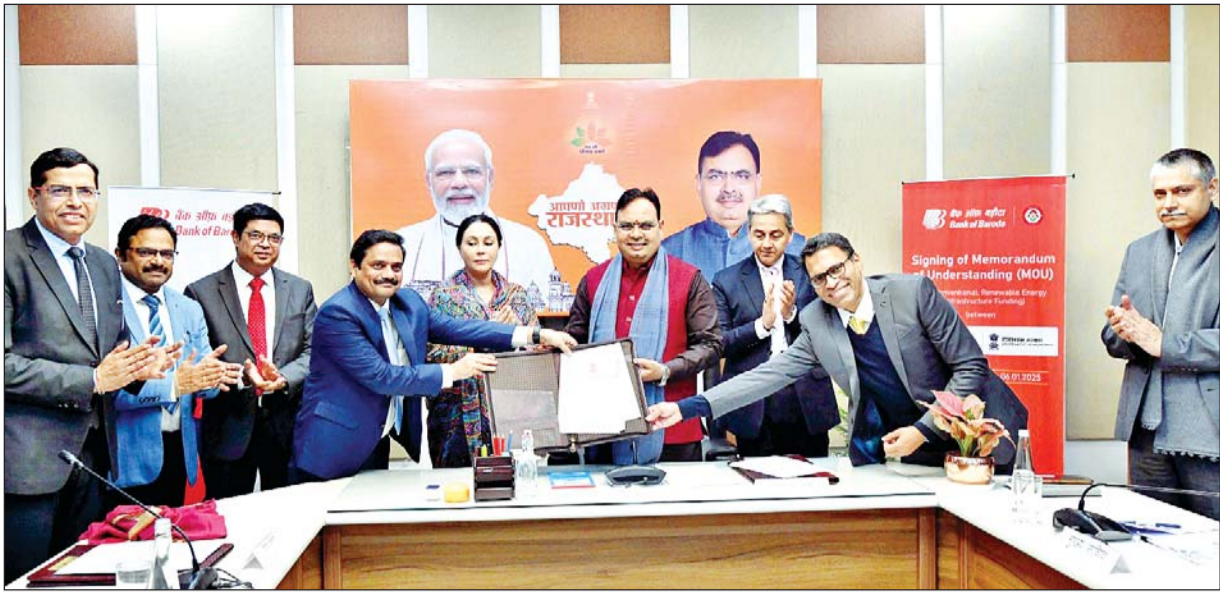
मुख्यमंत्री भजनलाल शर्मा की मौजूदगी में मुख्यमंत्री निवास पर बैंक ऑफ बड़ौदा तथा बैंक ऑफ महाराष्ट्र के साथ एमओयू हुआ। मुख्यमंत्री ने कहा कि राज्य सरकार ने 'विकसित राजस्थान 2047' के तहत पांच वर्षों की कार्य योजना बनाकर 'सर्वजन हिताय' आधारित समावेशी विकास का लक्ष्य रखा है।