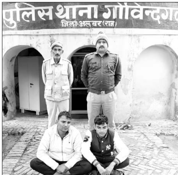
पुलिस ने ठगी के आरोपियों को गिरफ्तार किया।

गोविंदगढ़/अलवर, (निर्स)। गोविंदगढ़ थाना पुलिस ने ऑपरेशन एंटीवॉयस अभियान के तहत दो आरोपियों को गिरफ्तार किया है एवं दो मोबाइल जप्त किये हैं। गोविंदगढ़ थाना पुलिस टीम द्वारा ऑनलाइन ठगी सेक्टर ऑप्लैक्स आदि फ्रॉड के विरुद्ध चलाए जा रहे अभियान एंटीवॉयस के तहत गांव शाकीपुर में दबिश देकर विभिन्न