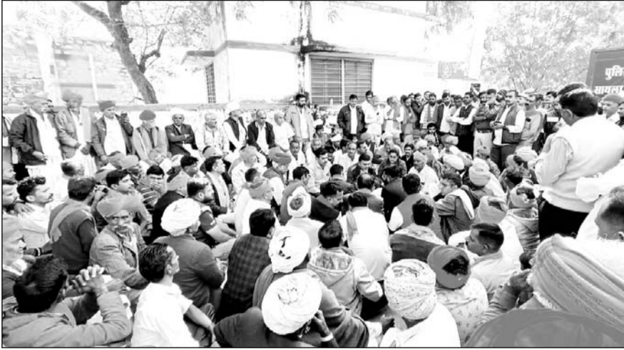
मांगों को लेकर परिजनों व समाज के लोगों ने थाने के बाहर धरना दिया।