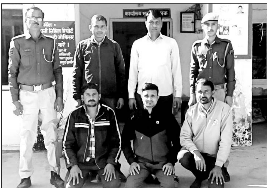
फुलेरा पुलिस ने अवैध पिस्टल के साथ तीन जनों को गिरफ्तार किया।