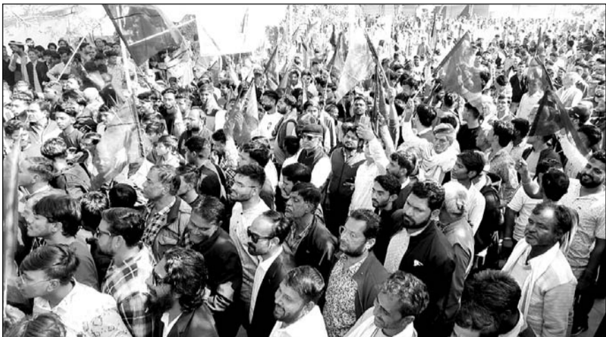
शाहपुरा जिला बचाओ संघर्ष समिति के तत्वाधान में आयोजित महापड़ाव में भारी जनसमूह उमड़ा।

शाहपुरा/भीलवाड़ा, (नि.सं.) अभिभाषण संस्था शाहपुरा के बैनर तले जिला बचाओ संघर्ष समिति के तत्वाधान में संपूर्ण शाहपुरा पूर्णतया बंद सफल रहा। 28 दिसंबर 2024 को सरकार द्वारा शाहपुरा जिले को समाप्त करने के विरोध में 28 जनवरी 2025 को ब्लैक डे मनाया गया, जिसमें शाहपुरा कोरोना के बाद पूर्णतया ऐतिहासिक रूप से बंद सफल रहा। शाहपुरा में व्यापारियों, सब्जी मंडी, चाय की थड़ी, निजी विद्यालय सहित मेडिकल की दुकानें भी पूर्णतया बंद रही और जनता ने जिला बचाओ संघर्ष समिति को संपूर्ण शाहपुरा बंद कर समर्थन दिया। वहीं महलों के चौक में आम सभा में शाहपुरा जिले के विभिन्न क्षेत्रों के ग्रामीण और शहरवासी, विभिन्न सामाजिक संगठनों ने हजारों की संख्या में भाग लिया।