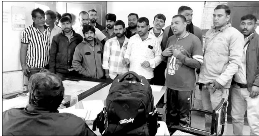
क्षेत्रवासियों ने जलदाय विभाग के अधिकारियों से समस्या समाधान की मांग की।

जलदाय विभाग पर प्रदर्शन के दौरान क्षेत्रवासियों ने बताया कि हर दिन पानी के इंजाम के लिए दूर-दूर तक