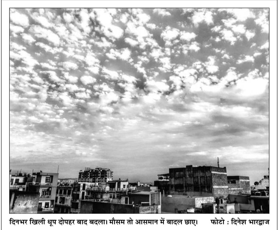
दिनभर खिली धूप दोपहर बाद बदला। मौसम तो आसमान में बादल छाए।