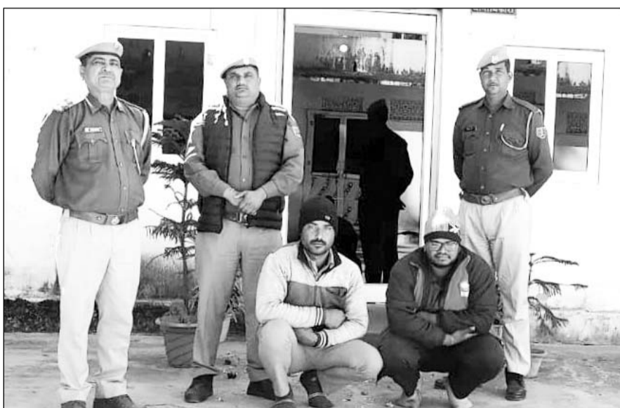
पुलिस ने केमिकल चोरी के मामले में कार्रवाई की।

टैकरों से निकाले गए केमिकल में उतनी ही मात्रा में पानी मिलाकर कंपनी को धोखा दे रहे थे