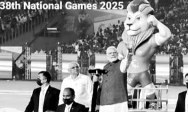
लोगोइसके साथ ही कार्यक्रम में शिव तांडव नृत्य भी हुआ। उससे पहले में हिमालय हूँ की डॉक्यूमेंट्री दिखाई गई।

देहरादून, 28 जनवरी। उत्तराखंड की राजधानी देहरादून में 38वें राष्ट्रीय खेलों का आगाज हो गया है। इस दौरान राजीव गांधी अंतर्राष्ट्रीय क्रिकेट स्टेडियम में पीएम मोदी ने समारोह में खेला का शुभारंभ किया। सोएम धामी ने पीएम मोदी का सिल्वरवापर पर लिखी किताब, शाल और उत्तराखंड की पारंपरिक टोपी पहनाकर स्वागत किया। वहीं जब पीएम मोदी स्टेडियम में पहुंचे तो लोगों ने खास उत्साह दिखाया। पीएम ने दर्शक दीर्घा से हाथ हिलाकर धन्यवाद किया। स्टेडियम में मोदी मोदी के नारे लगे तो वहीं जय श्री राम के नारे भी