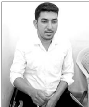
आरोपी प्राइवेट व्यक्ति

जोधपुर, (कासं.) भ्रष्टाचार निरोधक ब्यूरो की टीम ने मंगलवार को जोधपुर जिले के पीपाड़ तहसील कार्यालय में एक प्राइवेट व्यक्ति को चार हजार की रिश्वत लिए जाने के आरोप में पकड़ा है। अब तक जानकारी में पता लगा कि वह तहसीलदार एवं रीडर के नाम से रिश्वत ले रहा था। परिवारी की एक रजिस्ट्री संशोधन के नाम पर यह रिश्वत ली गई।