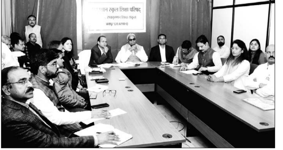
शिक्षा संकुल में हुई एक बैठक में शिक्षा मंत्री मदन दिलावर ने वीसी के जरिए जिला एवं ब्लॉक स्तर के शिक्षा अधिकारियों के साथ बैठक की।

जयपुर। राज्य स्कूल शिक्षा विभाग गत वर्ष की भांति इस बार भी सूर्य नमस्कार में नया विश्व रिकॉर्ड रचने की तैयारी कर रहा है। सूर्य सप्तमी के अवसर पर प्रदेश के सभी राजकीय एवं गैर राजकीय विद्यालयों में एक साथ 3 फरवरी को सूर्य नमस्कार किया जाएगा। इस दौरान गत वर्ष 78,974 स्कूलों में 1.33 करोड़ विद्यार्थियों द्वारा सूर्य नमस्कार में बने विश्व रिकॉर्ड को ब्रेक करने का प्रयास किया जाएगा। शिक्षा संकुल में हुई एक बैठक में शिक्षा मंत्री मदन दिलावर ने वीसी के जरिए जिला एवं ब्लॉक स्तर के शिक्षा अधिकारियों को इस संबंध में निर्देश जारी किए हैं।