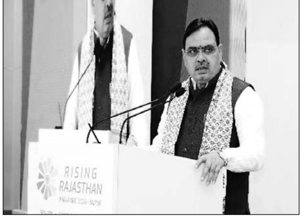
मुख्यमंत्री भजनलाल शर्मा ( फाइल फोटो )।

जयपुर। राइजिंग राजस्थान ग्लोबल इन्वेस्टमेंट समिट-2024 में निष्पादित किए गए एमओयू एक के बाद एक धरातल पर उतर रहे हैं। रीको द्वारा चार और प्रमुख कम्पनियों मेक्सोप इंजीनियरिंग कम्पनी लिमिटेड, रॉकमेन इंडस्ट्रीज लिमिटेड, कोटखावदा प्राइवेट लिमिटेड और सन पॉलिटेक्स प्राइवेट लिमिटेड को औद्योगिक इकाई लगाने के लिए भूखण्ड आवंटित कर दिए गए हैं। इनमें मेक्सोप इंजीनियरिंग कम्पनी लिमिटेड को भिवाड़ी जिले के कारोली औद्योगिक क्षेत्र, रॉकमेन इंडस्ट्रीज लिमिटेड को सलारपुर औद्योगिक क्षेत्र (भिवाड़ी), लाइटपाथ वेंचर्स प्राइवेट लिमिटेड को भीलवाड़ा जिले के उखलिया औद्योगिक क्षेत्र एवं सन पॉलिटेक्स प्राइवेट लिमिटेड को कलडवासा औद्योगिक क्षेत्र (उदयपुर) में भूमि उपलब्ध करवाई गई है।