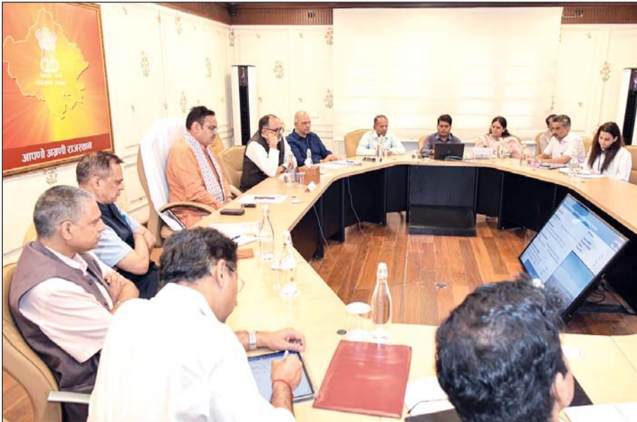
मुख्यमंत्री भजनलाल शर्मा ने शुक्रवार को मुख्यमंत्री कार्यालय में राष्ट्रीय जलमार्ग-48 को लेकर अहम बैठक की।

■ मुख्यमंत्री भजनलाल शर्मा ने भारतीय अंतर्देशीय जल मार्ग प्राधिकरण एवं आईआईटी मद्रास को प्रोजेक्ट के तकनीकी व वित्तीय आंकलन तथा जहाजों के अनुमानित ट्रैफिक की तुलनात्मक व अध्ययन रिपोर्ट तैयार करने के भी निर्देश दिए।