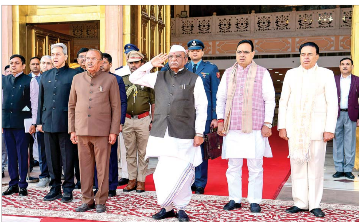
राज्यपाल हरिभाऊ बागड़े ने 16वीं विधानसभा के तीसरे सत्र के प्रथम दिन करीब 1 घंटे 26 मिनट अभिभाषण पढ़ा। उन्होंने पिछली कांग्रेस सरकार को पेपरलीक, जल जीवन मिशन घोटाले, थर्मल प्लांट्स में कोयले की कमी, राजस्थान में बिजली संकट सहित कई मुद्दों पर घेरा।

वसुंधरा राजे के नेतृत्व वाली सरकार ने शुरू किया था। दुर्भाग्य से, विगत सरकार के समय राजनीतिक लाभ के कारण इस परियोजना को अटकया जाता रहा। हमारी सरकार ने इसे राम जल सेतु परियोजना का नाम दिया। मध्य प्रदेश के साथ इस परियोजना को लेकर एमओयू (शेष अंतिम पृष्ठ पर)