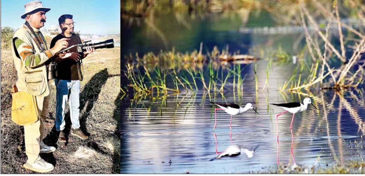
गेपसागर झील पर वन विभाग की ओर से दो दिवसीय मध्य शीतकालीन पक्षी गणना की गई। गणना में पिछले वर्षों के मुकाबले काफी कम पक्षी दिखाई दिए।