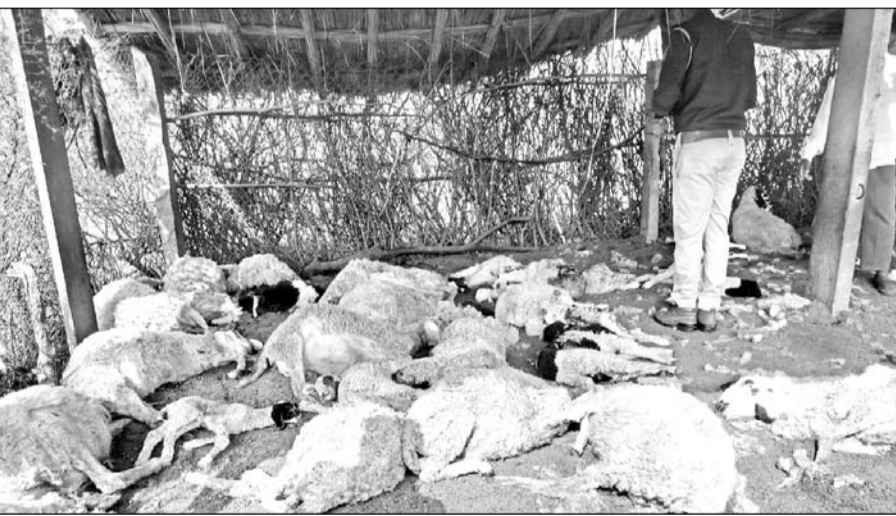
पशुपालन विभाग की टीम व पुलिस ने मौके पर जाकर जानकारी ली।

झुंझुनु, (निर्स)। जिले के उत्तरासर गांव के देवा के बास की गुर्जरों की हाणी में अज्ञात जंगली जानवरों ने पशुपालक में बाड़े में मवेशियों पर हमला कर दिया। जंगली जानवरों के हमले से बाड़े में बंधी करीब 40 भेड़ों की मौत हो गई है, जबकि एक दर्जन से अधिक भेड़े घायल हो गईं।