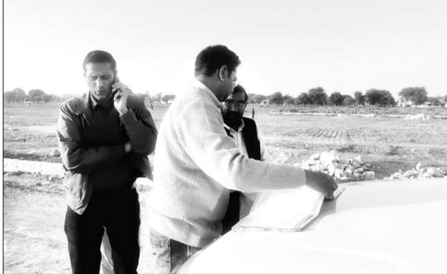
मुहाना गृह निर्माण सहकारी समिति के समापक और जयपुर विकास प्राधिकरण की प्रवर्तन शाखा ने गुरुवार को मुहाना स्थित सचिवालय नगर योजना में अवैध निर्माण व अतिक्रमण को रुकवाया।

जयपुरा। मुहाना गृह निर्माण सहकारी समिति के समापक और जयपुर विकास प्राधिकरण की प्रवर्तन शाखा ने गुरुवार को मौके पर पहुंचकर मुहाना स्थित सचिवालय नगर योजना में अवैध निर्माण व अतिक्रमण को रुकवाया। यह अवैध निर्माण जेडीए के अनुमोदित नक्शे के विपरीत 132 के.वी. की हाईटेशन लाइन के पास सेक्टर रोड पर हो रहा था।