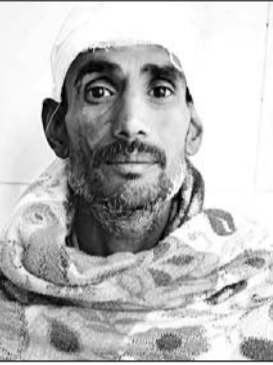
हमले में घायल युवक।