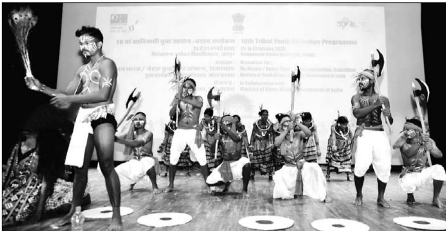
आरएफएफ कैंप, लालवास में आयोजित सांस्कृतिक संध्या में विभिन्न राज्यों के आदिवासी कलाकारों ने अपनी पारंपरिक प्रस्तुतियों से दर्शकों को मंत्रमुग्ध कर दिया

जयपुरा आरएफएफ कैंप, लालवास में आयोजित सांस्कृतिक संध्या में विभिन्न राज्यों के आदिवासी कलाकारों ने अपनी पारंपरिक प्रस्तुतियों से दर्शकों को मंत्रमुग्ध कर दिया। कार्यक्रम भारत सरकार के नेहरू युवा संगठन द्वारा गृह मंत्रालय के सौजन्य से आदिवासी युवा आदान-प्रदान कार्यक्रम के तहत आयोजित किया गया। झारखंड, ओडिशा और छत्तीसगढ़ के लोक कलाकारों ने अपने-अपने क्षेत्रीय नृत्य प्रस्तुत किए, जिनमें कृषि, प्रकृति, पारंपरिक आस्था और सामाजिक संदेश झलकते दिखे।