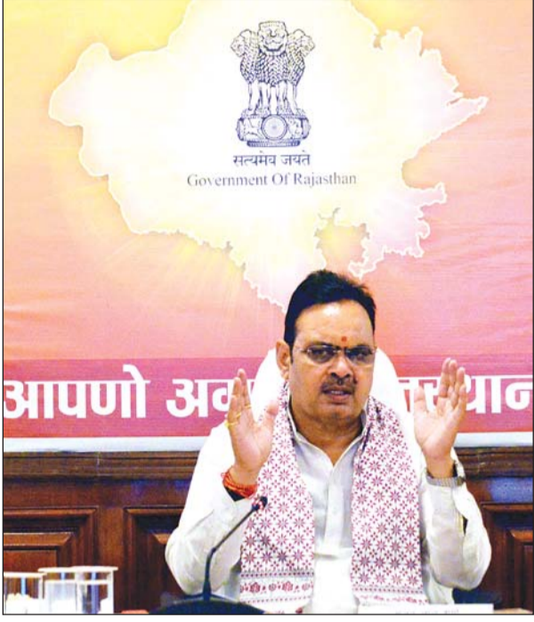
मुख्यमंत्री भजनलाल शर्मा

मुख्यमंत्री ने स्वायत्त शासन विभाग को आशुषि प्रबंधन को सुदृढ़ करने के लिए एकीकृत कंट्रोल रूम