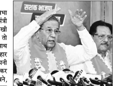
सांसद घनश्याम तिवाड़ी

जयपुर । भाजपा के वरिष्ठ नेता एवं राज्यसभा सांसद घनश्याम तिवाड़ी ने पूर्व मुख्यमंत्री अशोक गहलोत के इंतजार शास्त्र पर तीखी प्रतिक्रिया देते हुए कहा कि भारत में शास्त्र तो 64 ही हुए हैं, शास्त्र जैसे पवित्र शब्द के साथ इंतजार जोड़ना नहीं चाहिए। वे चाहे तो इजहार नामा कर सकते हैं। गहलोत हारने के बाद अपनी उपेक्षा से पीड़ित होकर हताशा का इजहार कर सकते हैं। गहलोत जब-जब मुख्यमंत्री बने, उसके बाद उन्होंने पार्टी को रसातल में पहुंचाया और सत्ता भाजपा के पास आई। इसके चलते कांग्रेस ने तत्त्व ने उन्हें साइड लाइन कर दिया। कांग्रेस पार्टी को रसातल में पहुंचाने वाले गहलोत साहब को दिल्ली में पायलट और राजस्थान में डोटारास के चलते तबज्जो नहीं दी जा रही, ऐसे में वे सोशल मीडिया पर अपने कार्यों का इजहार कर रहे हैं। तिवाड़ी ने पूर्व मुख्यमंत्री गहलोत के कार्यकाल पर कटाक्ष करते हुए कहा कि "फूलां बाई फूलगी, गेल का दिन भूलगी" लोकप्रिय अशोक गहलोत पर चरितार्थ हो रही है। भाजपा के वरिष्ठ नेता घनश्याम तिवाड़ ने कहा कि पूर्व मुख्यमंत्री गहलोत अपना