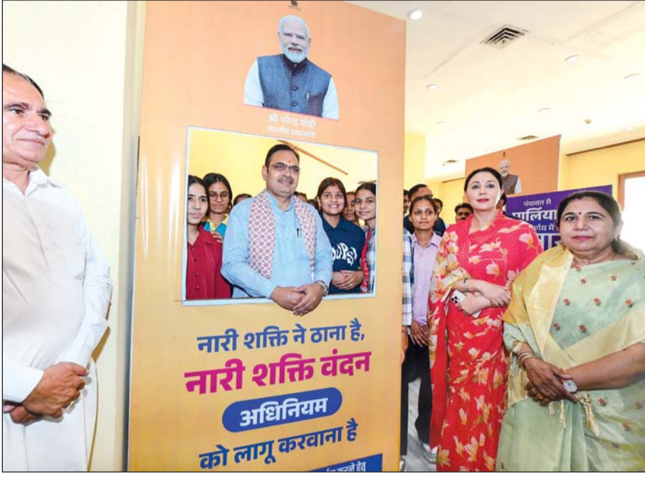
मुख्यमंत्री भजनलाल शर्मा ने बुधवार को बिड़ला ऑडिटोरियम में आयोजित नारी शक्ति वंदन सम्मेलन को संबोधित किया। इस अवसर पर मुख्यमंत्री के साथ छात्राओं ने सेल्फी व्हाइट पर सेल्फी ली।

■ मुख्यमंत्री भजनलाल शर्मा ने कहा कि नारी शक्ति वंदन अधिनियम से महिलाओं को शिक्षा, सुरक्षा, नीति निर्माण जैसे महत्वपूर्ण विषयों में सीधी भागीदारी मिलेगी।