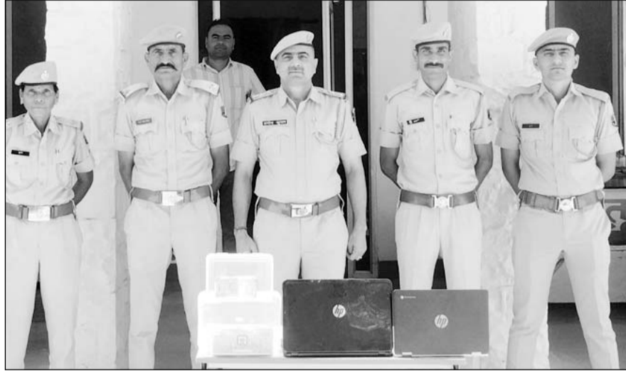
भवानीमंडी पुलिस ने साइबर ठगी के उपकरण सहित आरोपियों को गिरफ्तार किया है।