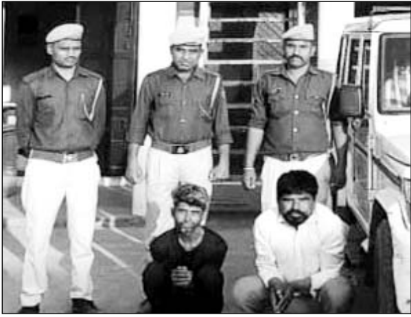
कसारवाडी थाना पुलिस ने गौ हत्या का मुख्य आरोपी और सहयोगी गिरफ्तार किया।