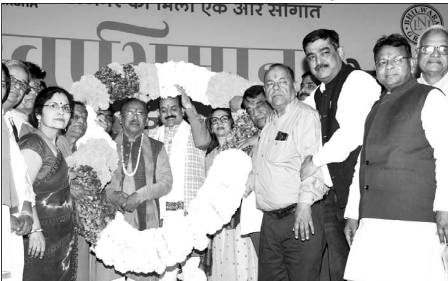
टीम जवाहर फाउंडेशन ने वासुदेव देवानी एवं अतिथियों का 5.1 किलो की माला पहनाकर स्वागत किया।

विधानसभा अध्यक्ष देवानी ने जवाहरलाल नेहरू चिकित्सालय में जवाहर फाउंडेशन द्वारा संचालित स्वाभिमान भोज रसोई का शुभारंभ फीता काटकर किया। देवानी ने जवाहर फाउंडेशन के संस्थापक अध्यक्ष उद्योगपति एवं समाजसेवी रिजु