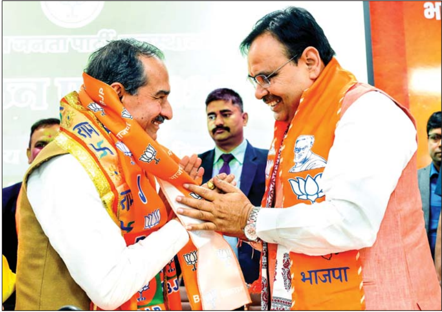
राज्यसभा सांसद मदन राठौड़ फिर से निर्विरोध राजस्थान भाजपा प्रदेश अध्यक्ष बन गए हैं। मुख्यमंत्री भजनलाल शर्मा ने पार्टी का दुष्पटा पहनाकर उनका स्वागत किया।

मुख्यमंत्री भजनलाल ने कहा, भाजपा विचारधारा आधारित पार्टी है, हर कार्यकर्ता विचारधारा का निर्वहन करता है