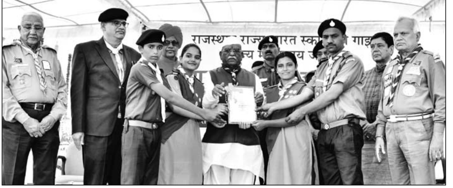
राज्यपाल हरिभाऊ बागडे ने स्काउट-गाइड के उत्कृष्ट प्रदर्शन वाली जिला इकाइयों को राज्य स्तरीय पुरस्कार प्रदान किए।

जयपुर। राज्यपाल हरिभाऊ बागडे ने कहा कि स्काउट गाइड संगठन नहीं, आदर्श कार्य संस्कृति है। उन्होंने कहा कि इस संगठन के जरिए प्रयास किया जाए कि नवयुवकों की बौद्धिक क्षमता बढ़े। इसी से भारत सभी क्षेत्रों में तेजी से विकास की ओर अग्रसर हो सकेगा। राज्यपाल शनिवार को राजस्थान राज्य भारत स्काउट गाइड राज्य