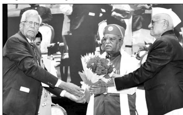
समारोह के दौरान राज्यपाल हरिभाऊ बागड़े का गुलदस्ता भेंट कर स्वागत सम्मान किया।

कहा कि शिक्षा नीति देने वाले मैकाले जब भारत से उनके वहां गया, तब उनके वहां भाषण में कहा कि मैं पूरे भारत में घूमकर आया हूं। कहीं भी एक चोर नहीं मिला। यह बात 1835 की है। उसने कहा था भारत के लोग हमारे गुलाम नहीं बन सकते, क्योंकि उनकी नैतिक ताकत बहुत है, देवधर्म में उनका विश्वास बहाव है। राज्यपाल ने कहा कि मैकाले ने यह भी कहा कि ऐसे लोगों को बहुत दिन तक गुलाम नहीं बना सकते हैं, ऐसा करना है