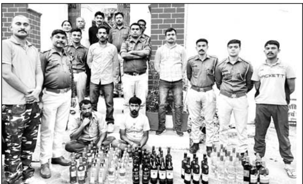
अवैध शराब के साथ तस्करी को गिरफ्तार किया।

झुंझुनूर, (निसं)। चौरासी थाना पुलिस ने अवैध शराब तस्करी के खिलाफ कार्रवाई करते हुए शराब से भरी एक कार को जब्त किया है। वैजा चौकी के सामने नाकेबंदी के दौरान की गई कार्रवाई में पुलिस ने कार से 55 बोतल शराब के बरामद करते हुए एक तस्करी को गिरफ्तार किया है। वहीं दूसरी ओर पुलिस ने धंभोला पावर हाउस तिराहे पर एक पिकअप कैम्पर से 2.50 लाख की शराब जब्त की है। पिकअप कैम्पर में बीच वाली सीट के नीचे मोडिफाई गुप्त केबिन में शराब को छुपाकर रखा था। पुलिस ने दो तस्करी को भी गिरफ्तार कर लिया है।