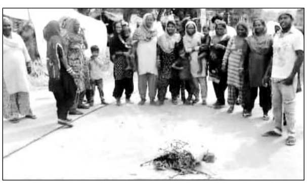
मांगों को लेकर पुतला दहन कर विरोध प्रदर्शन किया।

■ पीड़ित बोले 21 दिन बीत गए नहीं हो रही कोई सुनवाई ■ गत दिनों बारिश का पानी भर जाने से हुआ था नुकसान