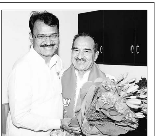
उपमुख्यमंत्री दिया कुमारी और प्रेमचंद बैरवा ने भाजपा के नवनियुक्त प्रदेश अध्यक्ष व राज्यसभा सांसद मदन राठौड़ से मुलाकात कर उनकी शुभकामनाएं दीं।