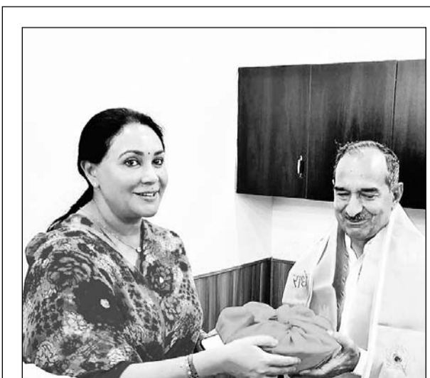
उपमुख्यमंत्री दिया कुमारी और प्रेमचंद बैरवा ने भाजपा के नवनियुक्त प्रदेश अध्यक्ष व राज्यसभा सांसद मदन राठौड़ से मुलाकात कर उनकी शुभकामनाएं दीं।

जयपुर। टीम 39 जहां चाह-वहां राह जन कल्याण ट्रस्ट एवं पानीपेच रोड व्यापार मंडल समिति ने रविवार को इंद्रा कॉलोनी पार्क, माधो कानन पार्क, अजमीद स्वर्णकार पार्क, डी-पार्क, डेजेंट कॉलोनी में वृक्षारोपण कार्यक्रम किया गया। टीम ने 251 पेड़-पौधे लगाए और उनकी सुरक्षा का संकल्प भी लिया।