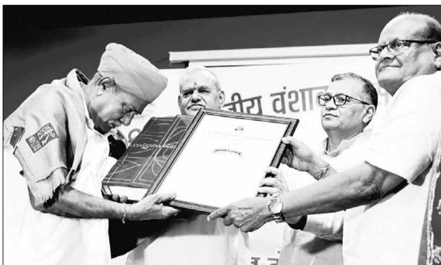
पाथेय कण के सभागार में आयोजित अखिल भारतीय वंशावली संरक्षण एवं संवर्द्धन संस्थान के स्थापना दिवस समारोह में वंशावली लेखकों को सम्मानित किया गया।