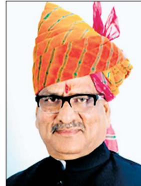
ओम प्रकाश माथुर

जयपुर, 28 जुलाई (का.सं.)। भाजपा के वरिष्ठ नेता ओमप्रकाश माथुर को भाजपा केंद्रीय नेतृत्व ने अब उन्हें उनकी 36 साल की सक्रिय राजनीति है। इसके साथ ही राजस्थान सरकार के पूर्व