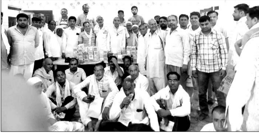
कमीशन और मेहनताना की मांग को लेकर आयोजित बैठक में राशन विक्रेताओं ने रोष जताया।