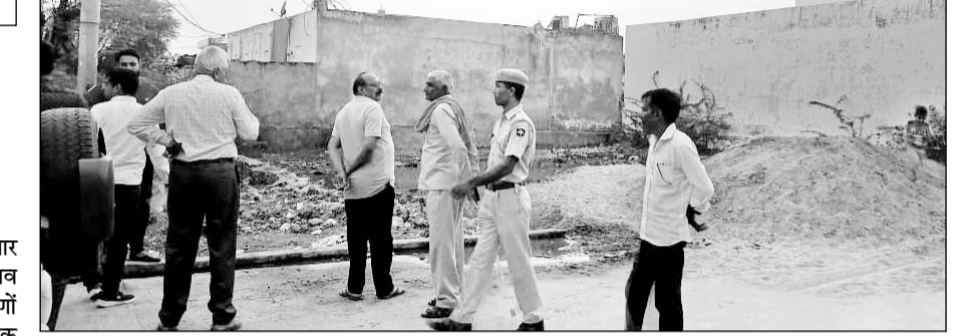
शहर की इन्फ्रा कॉलोनी में कब्जे की शिकायत पर तहसीलदार ने मौका निरीक्षण किया।

मालपुरा, (निर्सं)। मालपुरा नगरपालिका में बीते छह माह से चल रहे अध्यक्ष व ईओ बदलने के खेल का फायदा उठाते हुए बीते दिनों भाजपा पार्श्व द्वारा पांच दिन पहले इन्फ्रा कॉलोनी वार्ड नंबर 31 में रात के अंधेरे में दो भूखण्डों पर कब्जे का प्रयास कॉलोनीवासियों की सजगता से विफल होने तथा तहसीलदार द्वारा जांच रिपोर्ट एसडीएम को सौंपे जाने का मामला सामने आया है।