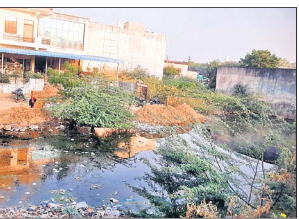
नगर पालिका रोड पर ओम हॉस्पिटल के सामने एकत्रित गंदा पानी बीमारियों को न्यौता दे रहा है।

आसपास के रहने वाले परिवारों में अनजाने में बीमारियों के फैलने की आशंका से भर पैदा होने लगा है। रोडवेज बस स्टैंड के ठीक सामने, कोटखावदा रोड, निमोडिया रोड, टिंटिया रोड, न्यायालय मार्ग पर आबादी के मध्य स्थित खाली स्थानों पर भरा पानी अनेक बीमारियों के कारण बनता जा रहा है। वार्ड 30