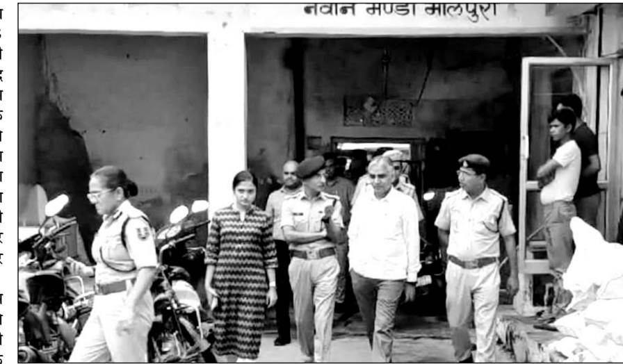
सम्भागीय आयुक्त, आईजी, कलेक्टर व एसपी ने मालपुरा पहुंच व्यवस्थाओं का लिया जायजा

शुक्रवार को जिला कलेक्टर व एसपी ने पंचायत समिति सभागार मे शांति समिति सहित कांवड़ व डिग्गी मैला आयोजन समिति एवं प्रशासनिक अधिकारियों की बैठक लेकर तैयारियों का फिडबैक लिया। बैठक में निर्णय लिया कि आईजी, कलेक्टर व एसपी सहित चार एसपी, आठ