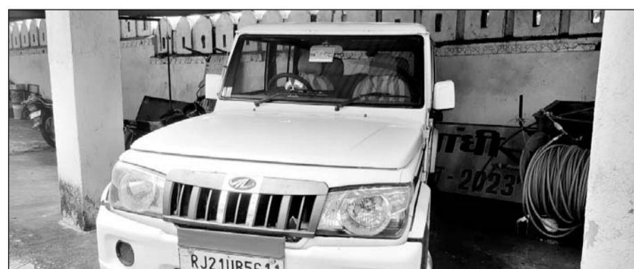
भीण्डर नगर पालिका कार्यालय पार्किंग में पड़ी कार्यवाहक ईओ का निजी वाहन।