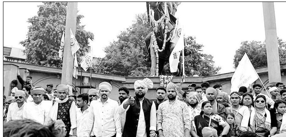
विश्व आदिवासी दिवस पर कॉलेज मैदान में आयोजित जिला स्तरीय कार्यक्रम को सांसद राजकुमार रोट ने संबोधित किया।