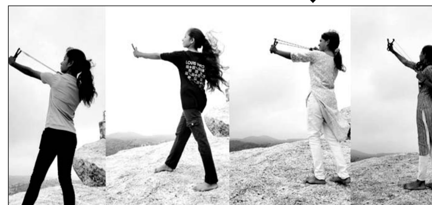
जिले के भीम क्षेत्र में बेटा घणा बेडा माताजी स्थल से सीड्स बॉल अभियान के तहत गुलेल के माध्यम से सीड बॉल का छिड़काव करती युवतियां।