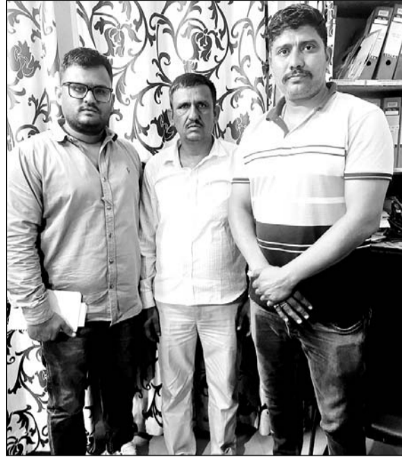
एंटी गैंगस्टर टास्क फोर्स पुलिस मुख्यालय की टीम ने इनामी आरोपी को पकड़ा।