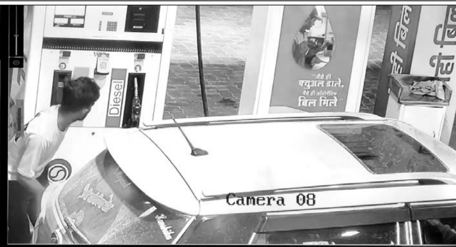
चोरी की पूरी घटना सीसीटीवी में कैद हो गई।

सेल्समैन ने 4150 रुपये का पेट्रोल बिना नंबर की कार में भरा था