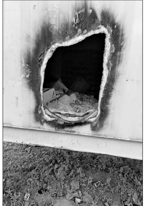
जयपुर-भीलवाड़ा स्टेट हाईवे किनारे ठेके के कंटेनर को काटकर चोरों ने शराब चुराई।