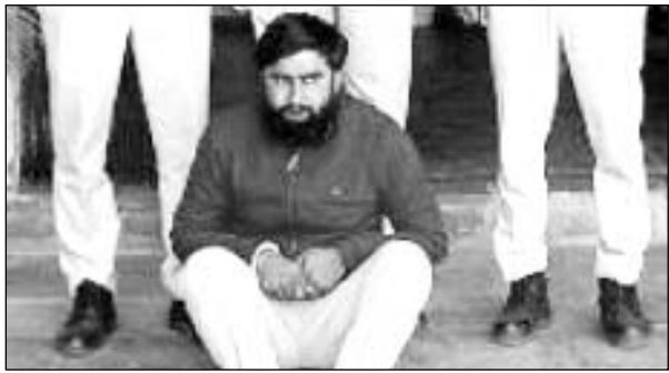
दूध में मिलावट के मामले में पुलिस ने एक जने को गिरफ्तार किया।

ली थी। उन्होंने आमजन से अपील की थी कि क्षेत्र में किसी भी प्रकार का कोई अपराध घटित होता है तो उसकी सूचना तुरन्त पुलिस को दें।