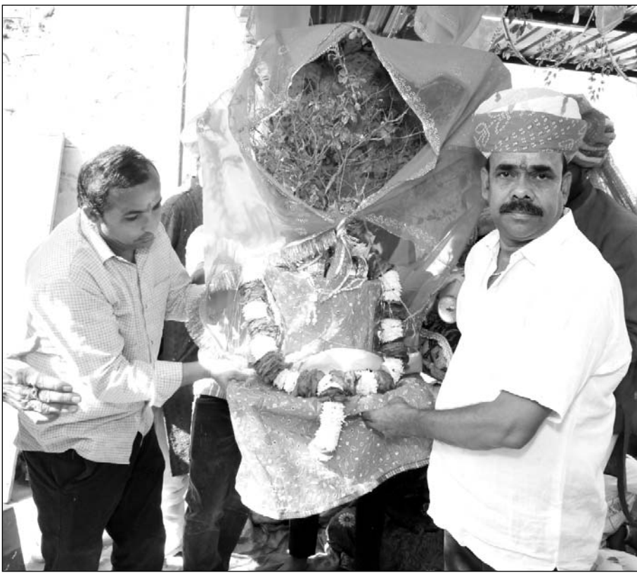
पाली में तुलसी विवाह को लेकर कार्यक्रम आयोजित किया।

जोधपुर, (कासं)। भगवान श्रीहरि विष्णु के चार माह की निद्रा के बाद मंगलवार को देवउठनी एकादशी श्रद्धापूर्वक धूमधाम से मनाई गई। इसके साथ ही आज से वैवाहिक सहित सभी शुभ मांगलिक कार्यक्रम शुरू हो गए। चार माह के चातुर्मास के बाद आज एकादशी से शहर में तुलसी-शालिग्राम विवाह के साथ ही वैवाहिक आयोजनों की धूम मच गई। अबूझ मुहूर्त के साथ ही आज देव उठनी एकादशी पर शहर में सैकड़ों वैवाहिक आयोजन हुए। देव उठनी एकादशी के शुभ योग में मंदिरों में तुलसी विवाह के आयोजन किए गए। देवउठनी एकादशी का पर्व मंगलवार को मनाया गया। चार महीने बाद भगवान श्री हरि विष्णु आज योग निद्रा से जागे। इसके साथ ही मांगलिक कार्यों पर लगा विराम भी हट गया। आज तुलसी-शालिग्राम विवाह के साथ मांगलिक कार्यों की शुरुआत हो गई। अब विवाह, मुंडन, सगाई, गृह प्रवेश सहित सभी मांगलिक कार्य बेरोक-टोक हो सकेंगे क्योंकि इसके लिए शुभ मुहूर्त शुरू हो गए हैं। इससे पहले भगवान विष्णु के योग निद्रा में जाने के साथ ही विवाह मुहूर्त पर विराम लग गया था। चातुर्मास के चार माह बाद आज शहर में फिर शहनाइयों की गूंज सुनाई दी। अब घरों में भगवान सत्यनारायण की कथा और तुलसी-शालिग्राम के विवाह की धूम रहेगी। देवउठनी एकादशी पर आज शहर में कई समाजों के सामूहिक विवाह सम्मेलन हुए। पीपा, बसेटा सहित विभिन्न समाजों की ओर से सामूहिक विवाह आयोजित किए गए। बसेटा विकास सेवा समिति