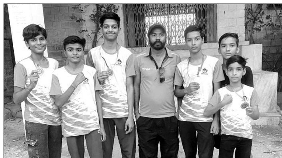
जालोर में स्वर्णगिरी स्पोर्ट्स फाउंडेशन में वुशू खिलाड़ियों का सम्मान किया।