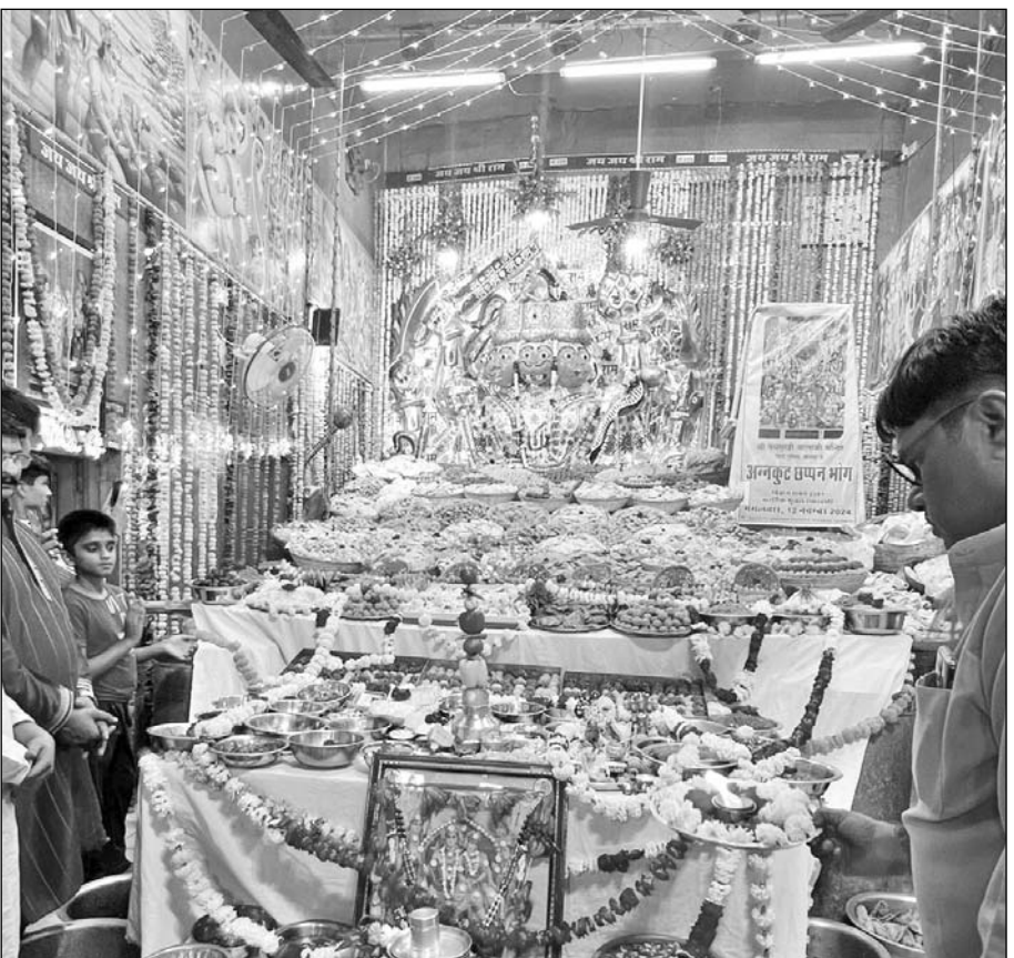
जोधपुर में सिटी पुलिस पचेटिया हिल तलेटी स्थित श्री पंचमुखी बालाजी मंदिर में अन्नकूट महोत्सव हुआ।

जोधपुर, (कासं)। सिटी पुलिस पचेटिया हिल तलेटी स्थित श्री पंचमुखी बालाजी मंदिर में मंगलवार को भव्य अन्नकूट में भारी तादाद में शहर वासियों की भीड़ उमड़ी। मंदिर की सीढ़ियों से लेकर सिटी पुलिस के मोड़ तक लोगों का हजूम पंचमुखी बालाजी के अन्नकूट