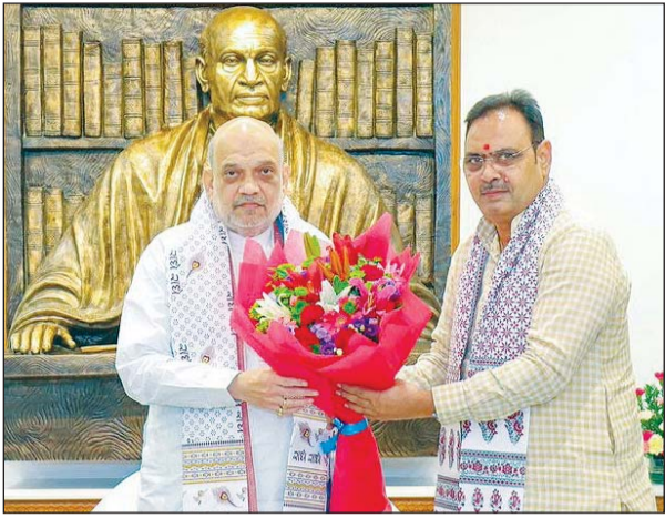
मुख्यमंत्री भजनलाल शर्मा ने गुरुवार को नई दिल्ली में केन्द्रीय गृह एवं सहकारिता मंत्री अमित शाह से शिष्टाचार भेंट की।

नई दिल्ली/जयपुर, 11 जून। मुख्यमंत्री भजनलाल शर्मा गुरुवार को नई दिल्ली में राष्ट्रपति भवन में प्रधानमंत्री नरेन्द्र मोदी की अध्यक्षता में आयोजित नीति आयोग की शासी परिषद की 11वीं बैठक में शामिल हुए। उन्होंने राजस्थान के विकास के विजन, उपलब्धियों एवं भावी कार्ययोजना को प्रस्तुत करते हुए कहा कि राजस्थान विकसित भारत-2047 के लक्ष्य की प्राप्ति में अग्रणी भूमिका निभाने के लिए प्रतिबद्ध है। मुख्यमंत्री ने कहा कि प्रधानमंत्री की संशा के अनुरूप, राज्य सरकार गरीब, युवा, अन्नदाता और नारी शक्ति को राज्य सरकार की नीतियों एवं कार्यक्रमों के केंद्र में रखकर कार्य कर रही है। उन्होंने कहा कि प्रधानमंत्री की युवाओं की शक्ति के उपयोग के मंत्र को आत्मसात करते हुए, राज्य सरकार प्रदेश की 63 प्रतिशत युवा आबादी को विकास का प्रमुख आधार बनाने की दिशा में कार्य कर रही है। प्रधानमंत्री फसल बीमा योजना