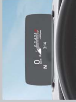
HEAD UP DISPLAY