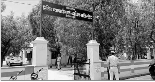
बीदासर कस्बे में स्थित न्यायालय।

बीदासर, (निर्स)। तीन थानाधिकारीयो और मुख्य चिकित्सा एवं स्वास्थ्य अधिकारी के अनुसंधान व निरीक्षण कार्यवाही में गंभीर त्रुटियां पाये जाने पर बीदासर न्यायालय द्वारा नाराजगी जाहिर कर इनके विरुद्ध नोटिस जारी कर प्रकरण को अग्रिम अनुसंधान के लिये लौटा दिया गया।