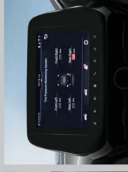
TYRE PRESSURE MONITORING SYSTEM