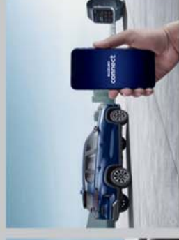
IN-BUILT SUZUKI CONNECT