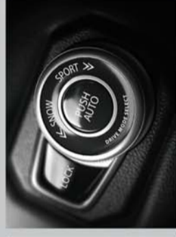
DRIVE MODE SELECTOR