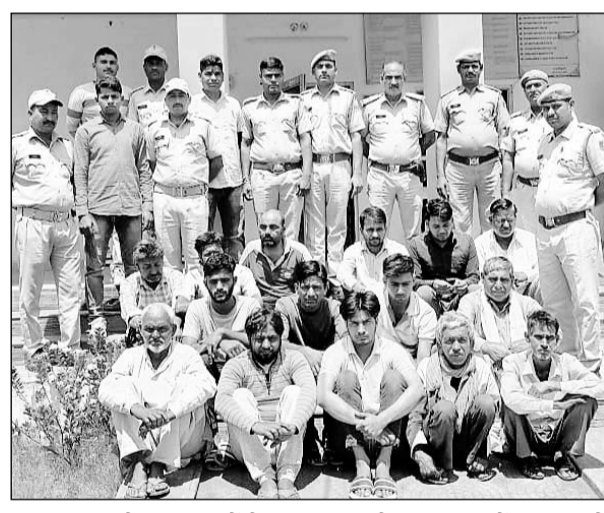
पाटन पुलिस के अपराधियों के धरपकड़ विशेष अभियान में अपराधियों को गिरफ्तार किया।

पाटन, (निर्स)। पाटन पुलिस ने बड़ी कार्रवाई करते हुए 17 वर्ष से फरार हत्या का उद्घोषित पांच हजार रुपये के इनामी बदमाश सहित अपराधियों की धरपकड़ विशेष अभियान में 17 अपराधियों को गिरफ्तार किया है। इसमें एक उद्घोषित अपराधी पांच हजार रुपये का इनामी, 1 हाईकोर, 2