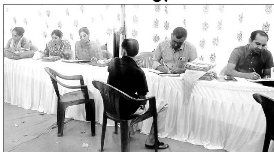
महंगाई राहत कैम्प में कर्मचारी अधिकांश समय खाली बैठे दिखाई पड़े।

कुछ लोगों का कहना है कि सरकार की ओर से इन शिविरों का लगाए जाने का कोई औचित्य नहीं है क्योंकि सरकार के पास व समस्त आंकड़े मौजूद पहले से ही हैं जो सरकार शिविर में पंजीयन के जरिए इकट्ठा करना चाहती है। कुछ जन प्रतिनिधियों ने यह भी बताया कि 2 माह तक लगातार शिविर आयोजित होने की वजह से नगरपालिका के कई महत्वपूर्ण कार्य एक प्रकार से टप हो जायेंगे जो विकास में प्रमुख रूप से भूमिका निभाते हैं।