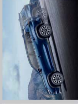
HILL DESCENT CONTROL