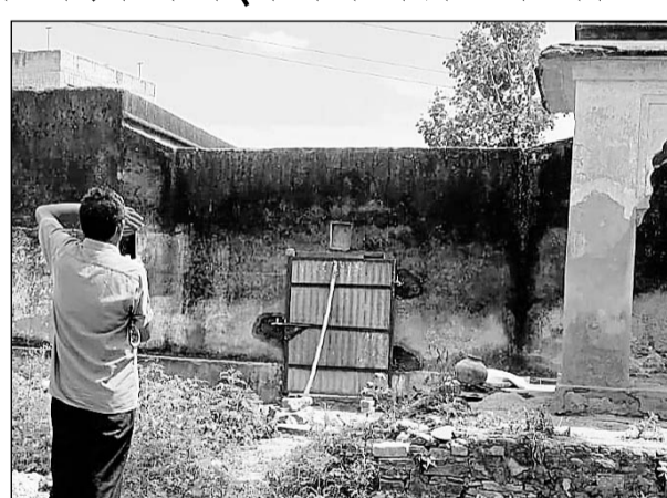
माफ़ी मंदिर जानकी नाथ भूमि पर शमशान घाट में रिपेयरिंग कार्य के बहाने कब्जा किया जा रहा है।