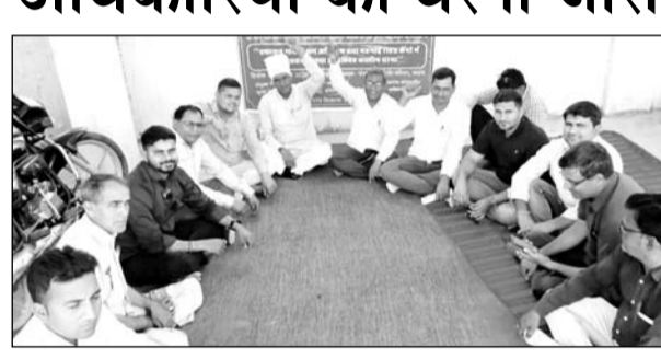
धरने पर बैठे ग्राम विकास अधिकारी।

पाटन, (निर्स)। ग्राम विकास अधिकारी संघ के निर्णयानुसार पंचायत समिति पाटन के ग्राम विकास अधिकारियों ने 7 सूत्रीय मांग पत्र पर प्रशासन गांव के संग अभियान 1 अक्टूबर, 2021 तथा 11 दिसंबर 2021 को किये गये समझौते के 2 वर्ष पश्चात भी आज तक एक भी आदेश जारी नहीं किए जाने पर सरकार द्वारा वादा खिलाफी किये जाने के कारण 21 अप्रैल से लगातार अवकाश पर रहते हुए धरना दिया जा रहा है। मंगलवार को धरने में अधिकांश सरपंच गण भी अपनी मांगों को लेकर उपस्थित रहे एवं