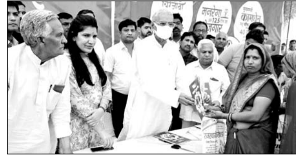
परिवहन मंत्री बृजेंद्र सिंह ओला ने शुंझुनु नगर परिषद में चल रहे स्थाई महंगाई राहत कैम्प का औचक निरीक्षण किया।

सरकार की यह सराहनीय पहल है। जिससे केवल एक जन आधार कार्ड नंबर से आमजन को 10 योजनाओं से लाभान्वित किया जा रहा है। उन्होंने कहा कि इन शिविरों में जिस प्रकार से भीड़ देखने को मिल रही है, उससे यह साफ जाहिर है कि कैम्प के प्रति आमजन का कितना उत्साह बन रहा है। उन्होंने आमजन से शिविरों का अधिकारिक लाभ उठाने की अपील करते हुए कहा कि यह कैम्प 30 जून तक लगातार चलेंगे। आमजन अपने कार्ड, ग्राम स्तर पर लगने वाले शिविरों में तो लाभ ले