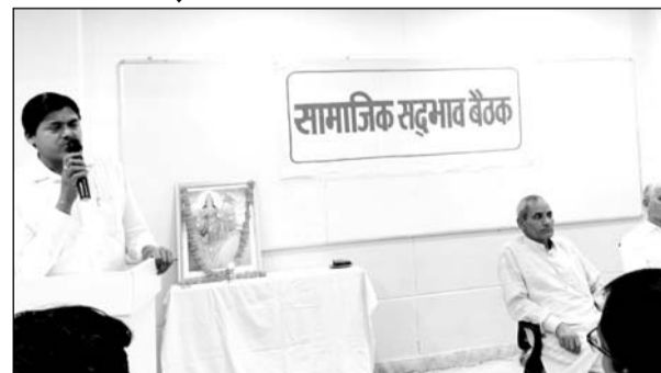
नीमकाथाना में राष्ट्रीय स्वयंसेवक संघ की बैठक संपन्न हुई।