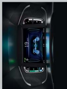
DIGITAL MULTI-INFORMATION DISPLAY