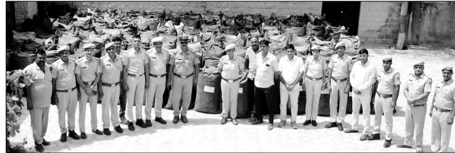
पुलिस ने पौने दो करोड़ का डोडा-पोस्त सहित दो जनों को गिरफ्तार किया।

दो ट्रकों में लादा गया था छह टन डोडा-पोस्त