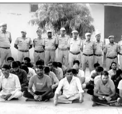
भाबरु थाना पुलिस ने असामाजिक तत्वों के विरुद्ध कार्रवाई की।

पावटा, (निसं)। प्रदेश में तेजी से बढ़ रही आपराधिक घटनाओं, वारदातों को रोकने के लिए राज्य सरकार व पुलिस द्वारा विशेष प्रयास किये जा रहे हैं। हाईकोर, हिस्ट्रीशीटर, बाँधित अपराधियों व अपराधियों व असामाजिक तत्वों के महिम मंडन के लिए सोशियल मीडिया पर अपराधियों को फॉलो करने वाले एवं उनकी पोस्टों को शेयर व लाइक करने के साथ-साथ अवैध हथियारों व बदमाशों के साथ पोस्ट डालने वाले असामाजिक तत्वों के विरुद्ध भाबरु थाना पुलिस द्वारा राजधानी जयपुर की भांति विशेष अभियान चलाकर निरन्तर कार्यवाही की जा रही है।