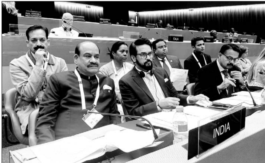
जिनेवा में अंतर-संसदीय संघ की बैठक में लोकसभा अध्यक्ष ओम बिरला के नेतृत्व में भारतीय संसदीय शिष्टमंडल ने भाग लिया।

स्पीकर ओम बिरला समापन दिवस पर आईपीयू की शासी परिषद की बैठक में शामिल हुए। बिरला ने कहा कि भारतीय शिष्टमंडल ने एसेम्बली के मुख्य विषय से जुड़े उन प्रमुख वैश्विक मुद्दों की ओर ध्यानाकर्षित किया, जिनमें भारत ने उल्लेखनीय प्रगति की है और सर्वोत्तम प्रथाओं को साझा किया। इसके साथ ही भारत की वैश्विक प्रतिबद्धताओं को दोहराते हुए परस्पर सहयोग की नीतिगत चर्चा-संवाद में शामिल होकर योगदान दिया। संसदीय सहयोग के माध्यम से समावेशी विकास और शांति की स्थापना के लिए वैश्विक प्रतिबद्धता को आगे बढ़ाने के लिए