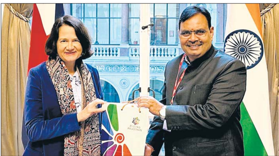
मुख्यमंत्री भजनलाल शर्मा, उप मुख्यमंत्री दीया कुमारी और राजस्थान सरकार के उच्चस्तरीय प्रतिनिधिमंडल ने ब्रिटेन सरकार की मंत्री (इण्डो पैसिफिक क्षेत्र) कैथरीन वेस्ट के साथ मुलाकात की और लंदन के पैलेस ऑफ वेस्टमिंस्टर में ब्रिटेन की संसद का दौरा किया।

लंदन, 17 अक्टूबर। यूरोप की सबसे बड़ी अर्थव्यवस्था जर्मनी में निवेशकों के साथ सफल संपर्क के बाद, मुख्यमंत्री भजन लाल शर्मा, उपमुख्यमंत्री दिया कुमारी और राजस्थान सरकार के उच्च स्तरीय प्रतिनिधिमंडल के अन्य सदस्यों ने आज