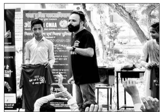
गंगानगर में ऑपरेशन सीमा में नुकड़ नाटक के जरिये स्थानीय कलाकारों ने नशा मुक्ति का संदेश दिया।