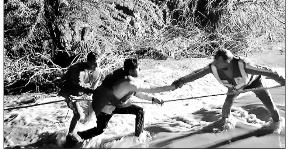
जालोर के निकट धुम्बडिया स्थित सुकड़ी नदी में फंसे लोगों को एनडीआरएफ की टीम ने बाहर निकाला।

कार से माउंट आबू घूमकर लौट रहे थे सिणधरी निवासी पांच व्यक्ति