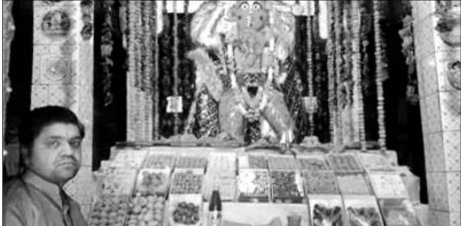
करोली की अनाज मंडी स्थित हनुमान मंदिर पर सजी छप्पन भोग की झांकी

करोली जिला मुख्यालय पर हनुमान जन्मोत्सव कार्यक्रम धूमधाम के साथ मनाया गया। इस अवसर पर नदी दरवाजा बाहर स्थित बैठा हनुमान मंदिर में महा आरती के साथ विशेष पूजापाठ और प्रसादी का आयोजन किया गया। इसी प्रकार अनाज मंडी स्थित हनुमान मंदिर पर छप्पन भोग के साथ महाआरती का आयोजन किया। बैठा हनुमान भक्त मंडली द्वारा मंदिर पर विशेष अनुष्ठान का आयोजन किया। हनुमान जन्मोत्सव पर लॉगरा क्षेत्र स्थित डगर वाले हनुमान मंदिर पर भी विश्व धार्मिक अनुष्ठान, हनुमान चालीसा, सुंदर काण्ड पाठ के साथ