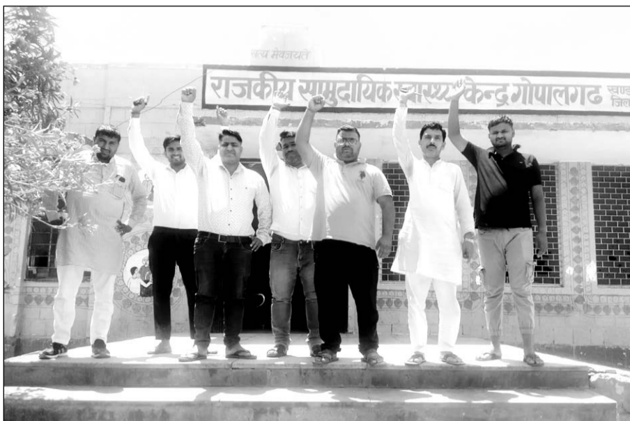
आदर्श सामुदायिक स्वास्थ्य केंद्र गोपालगढ़ पर बिगड़ी चिकित्सा व्यवस्थाओं को लेकर ग्रामीणों ने प्रदर्शन किया।

गोपालगढ़ कस्बे के आदर्श सामुदायिक स्वास्थ्य केंद्र पर चिकित्सा व्यवस्थाओं को लेकर बढ़ती जा रही अनियमितताओं, चिकित्सकीय स्टाफ का समय पर अस्पताल ना आना, ज्यादातर समय अस्पताल से बिना छुट्टी लिए ही बाहर रहना, यदि अस्पताल पर मौजूद है तो अपने क्वार्टर में रहना, मरीजों को दवाई न देना, प्रसव कराने को लेकर एक भी महिला नर्स का मौजूद