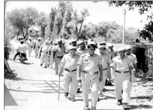
फ्लैग मार्च निकाल कर लोगों को भय मुक्त होकर मतदान करने का संदेश दिया।