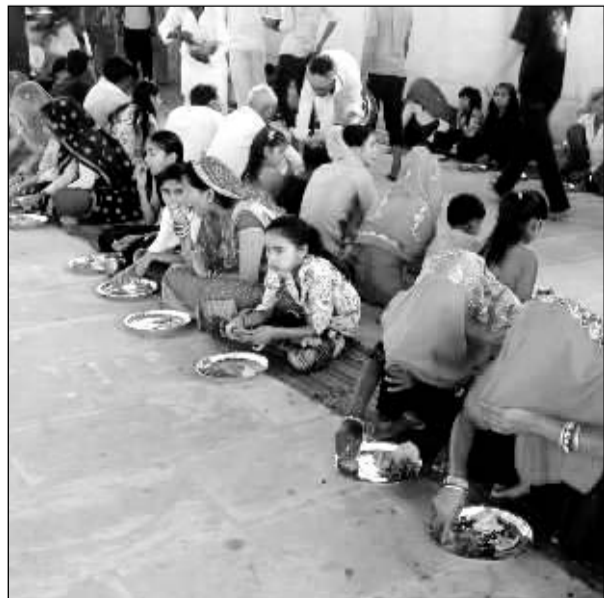
करोली के निकट चैनपुर आश्रम पर भंडारे में प्रसादी ग्रहण करते लोग।