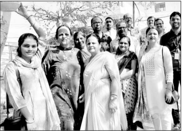
पृथ्वी दिवस के उपलक्ष्य में श्री बांके बिहारी जी मंदिर परिसर में पक्षियों को पानी के लिए परिंडे लगाए गए।