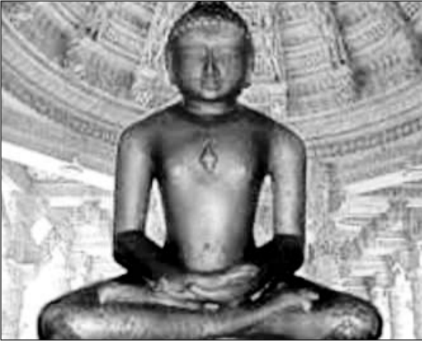
भगवान महावीर स्वामी।

अपने पूरे साधना काल के दौरान महावीर ने कठिन तपस्या की और मौन रहे। राजा बिम्बिसार, कुनिक और चेटक भी महावीर स्वामी के अनुयायी थे। गंधार नदी के तट पर स्थित इस मंदिर में श्रीमहावीरजी की मूर्ति विराजित है। आमतौर पर भारत में एक शिखर वाले मंदिर बहुतायत में हैं। लेकिन यहाँ स्थित तीन शिखर वाले मंदिर की बात ही कुछ और है। इस मंदिर में देश-विदेश से जैन धर्मानुयायियों के अलावा गुर्जर और मीणा समुदाय के लोग भी आते हैं। यहाँ