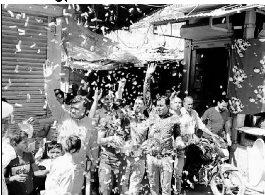
जिले के अन्य उपखंड क्षेत्र और आसपास के गांव में हनुमान जयंती महोत्सव धूमधाम से मनाया गया।

मंदिर पहुंचे भक्तों ने अपने इष्ट हनुमान जी के दर्शन कर खुशहाली की कामना की। शहर के मंदिरों में बालाजी महाराज का पंचामृत अभिषेक कर उन्हें चोला चढाया गया। नई पोशाक धारण करवा कर विशेष श्रृंगार किया गया। गंगापुर सिटी शहर के चौक बालाजी, पुराने अनाज मंडी के सीताराम जी मंदिर, उदई मोड के मनोरथ सिद्ध हनुमान जी मंदिर, पंचायत समिति स्थित ममलेश्वर महादेव मंदिर, रोडवेज बस स्टैंड पास स्थित नवदेव महादेव मंदिर, कर्मचारी कॉलोनी के चमत्कारी हनुमान जी मंदिर, उषाडमल बालाजी के अलावा आसपास के मंदिरों में सुबह विशेष साफ-सफाई कर बालाजी