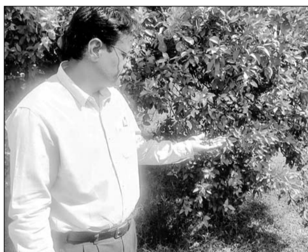
गोबर की खाद व संतुलित मात्रा में खाद व उर्वरक देने से फल कम गिरते हैं।

कोट एवं बीमारियों का नियंत्रण भी करते रहे।