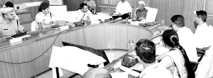
कोटा में राज्यपाल ने जिला स्तरीय अधिकारियों से संवाद कर निर्देश दिए।

कोटा, (निर्स)। राज्यपाल हरिभाऊ बागडे ने कहा कि स्वयं सहायता समूहों से जुड़ी महिलाएं आगे बढ़ने की भावना से कार्य करें और स्वयं को आर्थिक रूप से सशक्त बनाएं। उन्होंने महिला स्वयं सहायता समूहों को प्रोत्साहित करने के निर्देश दिए। राज्यपाल सोमवार को जिला परिषद सभागार में जिला स्तरीय अधिकारियों के साथ संवाद के दौरान राज्य व केंद्र प्रवर्तित योजनाओं एवं कार्यक्रमों की प्रगति की समीक्षा कर रहे थे।