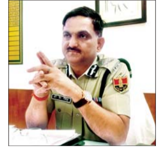
ए.डी. डी.जी.पी. वी.के. सिंह

■ जेल प्रहरी भर्ती परीक्षा 2018 में एटीएस पहले ही 7 लोगों को गिरफ्तार कर चुकी है, एसओजी भी अलग कार्यवाही कर कई लोगों को गिरफ्तार कर चुकी है।