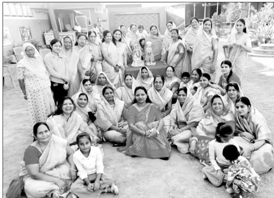
पाली में गणेश महिला मंडल ने गणगौर उत्सव आयोजित किया।

पाली, (नि.सं.)। गणेश महिला मंडल ने गणगौर उत्सव निजी गाडहन में आयोजित किया। महिला मंडल अध्यक्ष भाग्यवंती