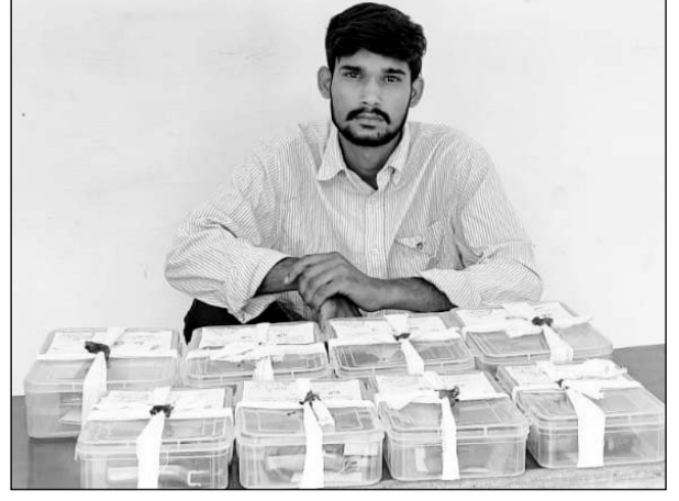
चंदवाजी थाना पुलिस ने अवैध हथियारों के साथ आरोपी को पकड़ा।