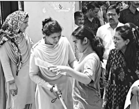
जयपुर के परीक्षा केन्द्रों पर नीट परीक्षा देने पहुंचे अभ्यर्थियों को गहन जांच के बाद ही प्रवेश दिया गया।

राजधानी में कुल 36508 ने भाग लिया, 851 परीक्षार्थी अनुपस्थित