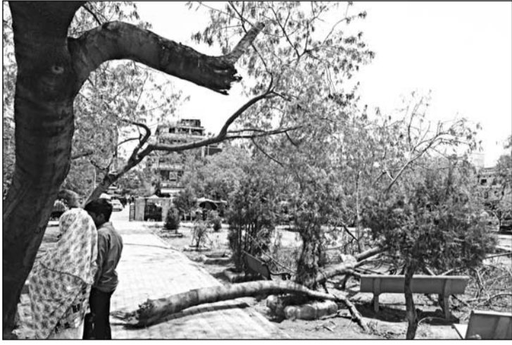
राजधानी जयपुर में शनिवार देर शाम आए तेज अंधड़ के कारण मुख्य सड़कों, पार्कों और विद्युत लाइनों पर पेड़ टूटकर गिर गए। अंधड़ के कारण प्रभावित हुई विद्युत सप्लाय को सुचारु करने के लिए जयपुर डिस्कॉम की टीम रविवार देर शाम तक जुटी रही।