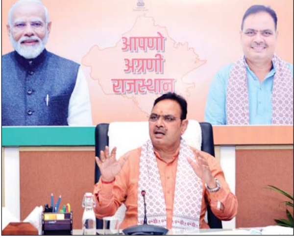
मुख्यमंत्री भजनलाल शर्मा ने रविवार को मुख्यमंत्री निवास पर वन विभाग की बैठक ली।

के साथ-साथ किसानों की आय में वृद्धि के लिए राज्य सरकार किसानों को फलदार पौधे उपलब्ध करवाएगी। ऐसे में वन विभाग फलदार पौधों के वितरण की भी योजना बनाए। उन्होंने पहाड़ी एवं वन क्षेत्रों में ड्रोन सीडिंग एवं अरावली क्षेत्र में सघन वृक्षारोपण के भी निर्देश दिए।