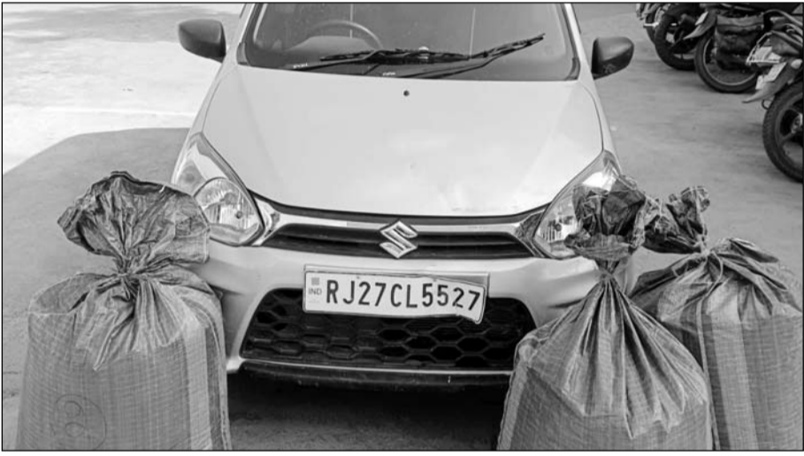
भीण्डर पुलिस ने कार जब्त कर अवैध अफीम डोडा-चूरा बरामद किया।

भीण्डर, (निर्स)। उदयपुर रेंज में अवैध मादक पदार्थों की तस्करी पर लगाम कसने के लिए चलाए जा रहे विशेष अभियान ऑपरेशन त्रिनेत्र के तहत भीण्डर पुलिस को बड़ी सफलता हाथ लगी है। शनिवार देर रात गश्त के दौरान पुलिस ने एक संदिग्ध कार का पीछा कर 47 किलो 80 ग्राम अवैध अफीम डोडा-चूरा जब्त किया और एक आरोपी को गिरफ्तार किया है।