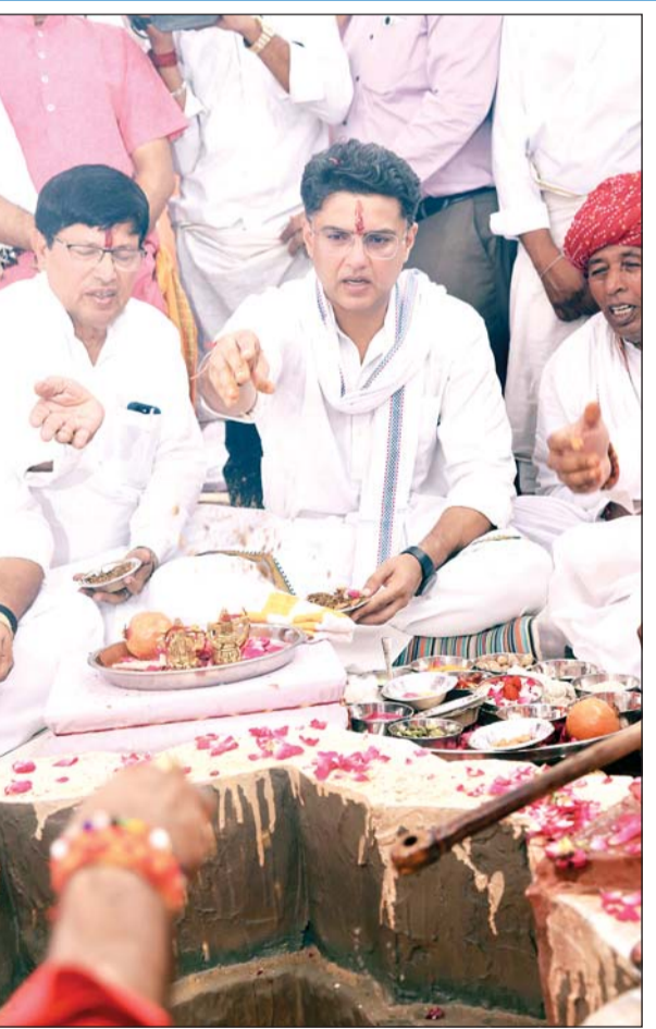
कांग्रेस महासचिव व पूर्व उपमुख्यमंत्री सचिन पायलट ने रविवार को श्री बैकुंठ धाम बरनाघर आसीन्द में आयोजित भगवान देवनारायण के 51 कुंडीय विष्णु महायज्ञ एवं मूर्ति प्राण प्रतिष्ठा महोत्सव में शिरकत की।

उन्होंने कहा कि हर जनप्रतिनिधि को जनभावनाओं को सुनकर उसके आधार पर काम करना चाहिए