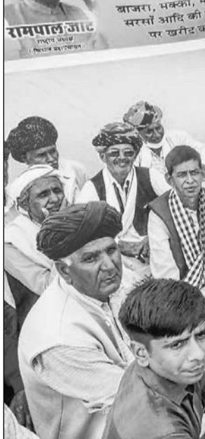
किसान महापंचायत के बैनर तले प्रदेशभर से जयपुर आये किसानों ने बाइस गोदाम पर धरना दिया।

जयपुर, (कासं)। किसान महापंचायत के बैनर तले प्रदेशभर से आए सैकड़ों किसानों ने विधानसभा का घेराव किया।