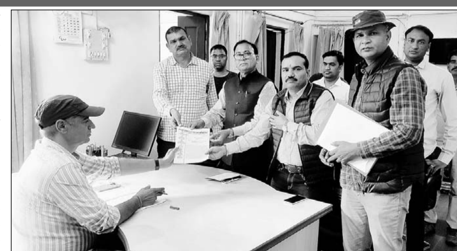
अवैध रूप से रायल्टी की वसूली को लेकर एसडीएम को ज्ञापन सौंपते क्रेसर संचालक।