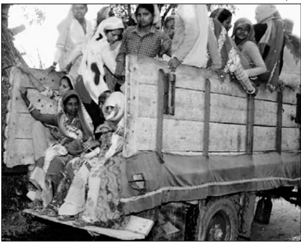
सरसों की कटाई के लिए दूसरे गांवों से मजदूर लेकर आते किसान।

गोहू चने की भी जल्द शुरू होगी कटाई :- किसानों ने बताया कि सरसों की कटाई के बाद चने, गोहू की की भी कटाई करनी है। साथ ही शादी विवाह का सीजन भी आ रहा है। कई घरों में अगले माह शादी भी है। इस कारण जल्दी से कटाई से फ्री होना चाहते हैं। मौसम खराब हो गया तो मेहनत बेकार हो जाएगी। मजदूरों को आसपास के गांवों से ट्रॉलियों के अलावा अन्य वाहनों से खेत पर लाया और वापस पहुंचाया जा रहा है।