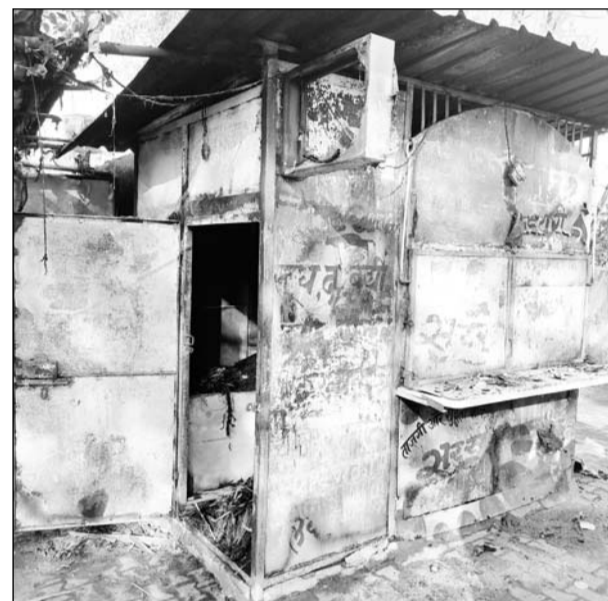
दमकल ने करीब एक घंटे की मशक्कत के बाद आग पर काबू पाया।

■ बूथ में आग लगने का कारण शॉर्ट सर्किट माना