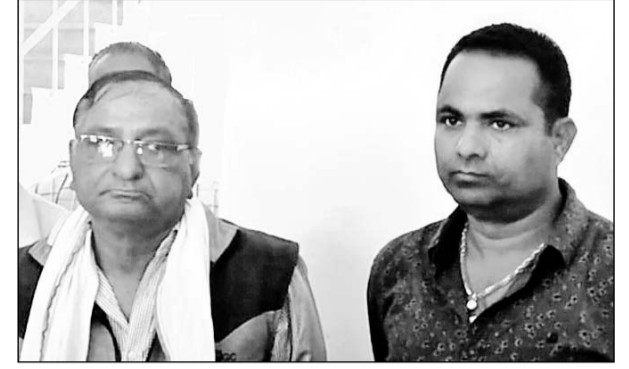
नागौर एसीबी की टीम ने रिश्त के आरोपियों को गिरफ्तार किया।

ठेकेदार की सिक्क्योरिटी राशि लौटाने और बिल पेमेंट के लिए मांगी थी रिश्त