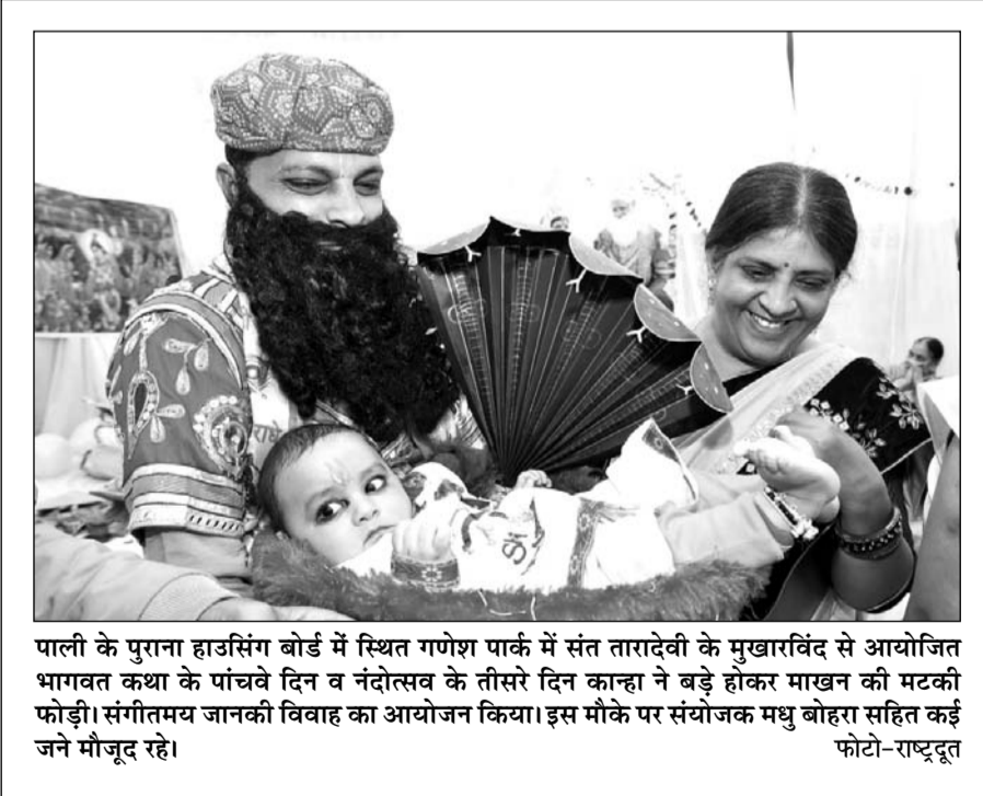
पाली के पुराना हाउसिंग बोर्ड में स्थित गणेश पार्क में संत तारादेवी के मुखारविंद से आयोजित भागवत कथा के पांचवे दिन व नंदोत्सव के तीसरे दिन काहना ने बड़े होंकर माखन की मटकी फोड़ी। संगीतमय जानकी विवाह का आयोजन किया। इस मौके पर संयोजक मधु बोहरा सहित कई जने मौजूद रहे।

लोग उपस्थित थे। जिला कलक्टर टीना डाबी के निर्देश पर नववर्ष की पूर्व संध्या पर जिले के सभी उपखंड अधिकारियों को गरीब और बेसहारा लोगों के सर्दी से बचाव के लिए जरूरतमंदों को कंबल वितरित किए गए। इसके साथ ही अपने यहां सर्दियों में रैन बसों की माकूल व्यवस्था करने और अन्य सुविधाएं सुनिश्चित करने के निर्देश दिए।