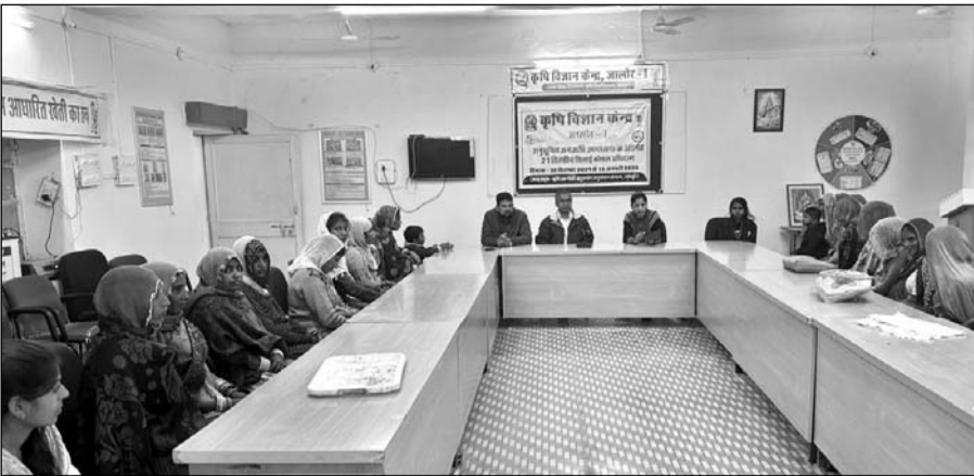
जालोर के निकट कृषि विज्ञान केंद्र केशवना में अनुसूचित जनजाति वर्ग की महिलाओं के लिए सिलाई कला प्रशिक्षण कार्यक्रम का शुभारंभ हुआ।

जालोर, (कासं)। कृषि विज्ञान केंद्र केशवना में विभिन्न तकनीकी हस्तक्षेपों के माध्यम से अनुसूचित जनजाति वर्ग के परिवार की महिलाओं में प्रशिक्षण के माध्यम से स्थायी आजीविका उत्पन्न कर आय में वृद्धि कर उनके जीवन स्तर में सुधार लाने के उद्देश्य से अनुसूचित जनजाति परियोजना के तहत केंद्र में जनजातीय महिलाओं के लिए 21 दिवसीय "सिलाई कला कौशल" प्रशिक्षण का शुभारंभ हुआ। प्रशिक्षण के आरंभ में अनुसूचित जनजाति की