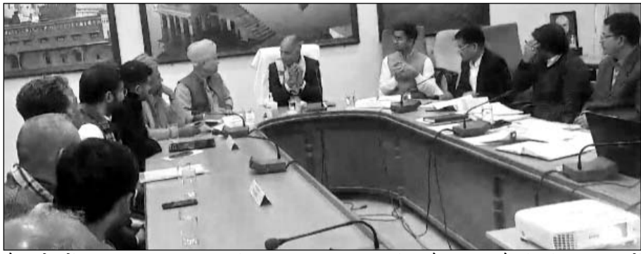
जैसलमेर में जन स्वास्थ्य अभियांत्रिकी एवं भू जल विभाग मंत्री कन्हैयालाल चौधरी की अध्यक्षता में बैठक हुई।

जैसलमेर, (नि.सं.)। जन स्वास्थ्य अभियांत्रिकी एवं भू जल विभाग मंत्री कन्हैयालाल चौधरी की अध्यक्षता में मंगलवार को जिला कलेक्टर सभाकक्ष जैसलमेर में बाड़मेर, बालोतरा, जैसलमेर जिले की पेयजल विभागीय समीक्षा बैठक आयोजित हुई। इस महत्वपूर्ण बैठक में विभाग की महत्वपूर्ण गतिविधियों, जल जीवन मिशन, अमृत 2.0 योजना सहित विभागीय योजनाओं और परियोजनाओं की विस्तृत समीक्षा की गई।