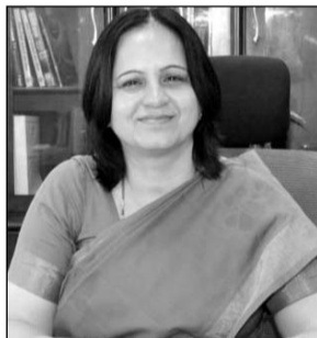
आई.ए.एस. मंजू राजपाल।