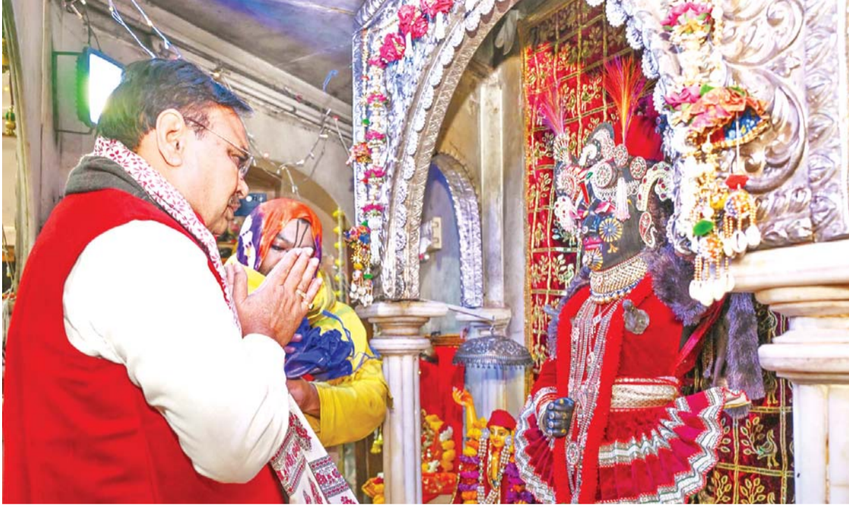
मुख्यमंत्री भजनलाल शर्मा ने नववर्ष की पूर्व संध्या पर डींग जिले के पूंछरी का लौठा के श्रीनाथ जी मंदिर में पूजा की और प्रदेश की खुशहाली की कामना की। इससे पहले वे मेहदीपुर बालाजी भी गए जहां उन्होंने पूजा अर्चना की। सूत्रों ने बताया कि मुख्यमंत्री नववर्ष के प्रथम दिन पूंछरी का लौठा धाम में गिराज महाराज के भी दर्शन करेंगे तथा विशेष पूजा कार्यक्रम में शामिल होंगे।