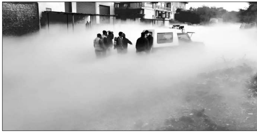
राजधानी जयपुर के विश्वकर्मा इंडस्ट्रियल एरिया में मंगलवार को ऑक्सीजन प्लांट में टैंकर का बॉल्व टूटने से हडकंप मच गया।

-कार्यालय संवाददाता- जयपुर। राजधानी जयपुर के विश्वकर्मा इंडस्ट्रियल एरिया में मंगलवार को ऑक्सीजन प्लांट में टैंकर का बॉल्व टूटने से हडकंप मच गया। कार्बन डाई ऑक्साइड गैस लिकेज के कारण जैसे ही पूरे इलाके में धुंआ फैला तो लोगों में दहशत का माहौल बन गया। सूचना पाकर मौके पर पहुंची विश्वकर्मा थाना पुलिस ने मेन वॉल्व बंद करवाकर लीकेज को बंद करवाया। गैस की वजह से दृश्यता कम होने के चलते वाहनों को धीमी गति से निकाला गया।