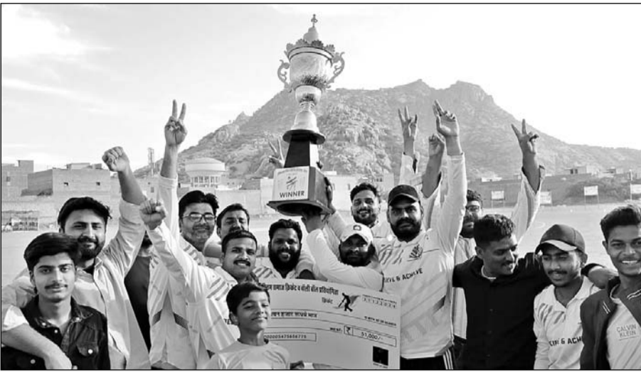
जालोर में मुस्लिम समाज क्रिकेट प्रतियोगिता का खिताब जानिसार क्लब ने जीता।

जालोर, (कासं)। जालोर मुस्लिम समाज क्रिकेट व वॉलीबॉल प्रतियोगिता के अंतिम दिन मंगलवार को क्रिकेट प्रतियोगिता का फाइनल मैच जानिसार क्लब और जुंजाणी के बीच खेला गया। जानिसार क्लब ने रोमांचक जीत दर्ज की। वहीं वॉलीबॉल में पठान ब्रदर्स की टीम विजेता रही।