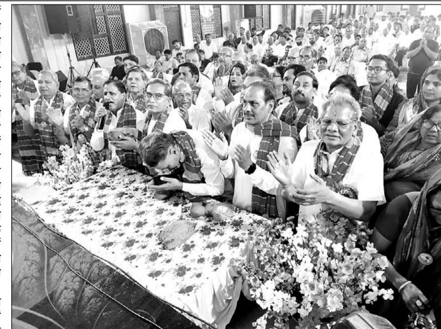
अखिल भारतवर्षीय धर्म जागृति संस्थान का सप्तम राष्ट्रीय अधिवेशन संपन्न हुआ।