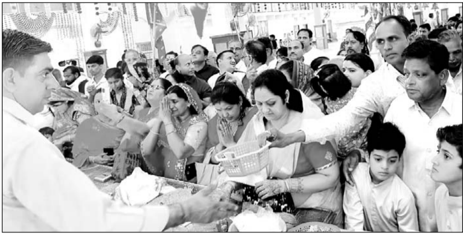
क्षेत्र के प्रमुख शक्तिपीठ बाड़ी माता मंदिर के दर्शन करते श्रद्धालु।

बिजयनगर, (निसं)। चैत्र नवरात्र के पावन अवसर दुर्गा अष्टमी के अवसर पर क्षेत्र के प्रमुख शक्तिपीठ बाड़ी माता मंदिर पर श्रद्धालुओं का दर्शन के लिए भीड़ लगी रही। मंगलवार प्रातः काल से ही श्रद्धालु पैदल एवं अपने वाहनों पर सवार होकर बाड़ी माता मंदिर पहुंचने श्रद्धालुओं ने नारियल माता अंगरक्षत्री प्रसाद चढ़ाकर मंदिर में स्थापित बाड़ी