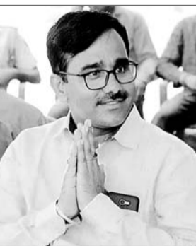
विधायक मनोज न्यांगली।

सादुलपुर, (निर्स)। सादुलपुर में एक बार फिर लोकसभा चुनाव के बीच ही राजनीतिक सरगमियां तेज हो गई हैं। चूरू जिले की सादुलपुर विधानसभा क्षेत्र से बसपा से विधायक मनोज न्यांगली मंगलवार को बसपा को छोड़कर शिवसेना में शामिल हो गये। जिसको लेकर लोगों की अलग-अलग प्रतिक्रियाएं आ रही हैं। इस दौरान विधायक मनोज न्यांगली ने कहा कि लोकसभा चुनाव चल रहा है, जिसमें पार्टी के गठबंधन के अनुसार बचे हुए समय में चूरू लोकसभा क्षेत्र से भाजपा के उम्मीदवार को जितकर मोदी जी की सरकार बनानी है। वहीं दूसरी तरफ सादुलपुर विधानसभा क्षेत्र से बसपा से दूसरी बार विधायक बने मनोज न्यांगली के बसपा छोड़ने से राजस्थान में बहुजन समाज पार्टी (बीएसपी) को बड़ा झटका लगा है। जानकारी के अनुसार प्रदेश में पार्टी के दो विधायक शिवसेना (शिदे गुट) में शामिल हो गए हैं। मुंबई में महाराष्ट्र