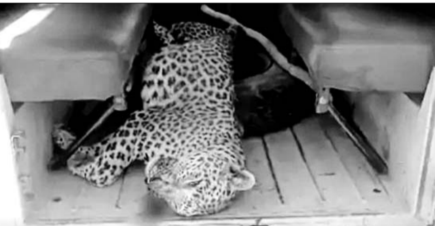
वन विभाग की टीम अंतिम संस्कार के लिए लेपर्ड के शव को सागवाड़ा वन विभाग के ऑफिस ले गई।

■ तालाब से नहाकर लौट रहे युवक पर लेपर्ड ने हमला कर घायल कर दिया था