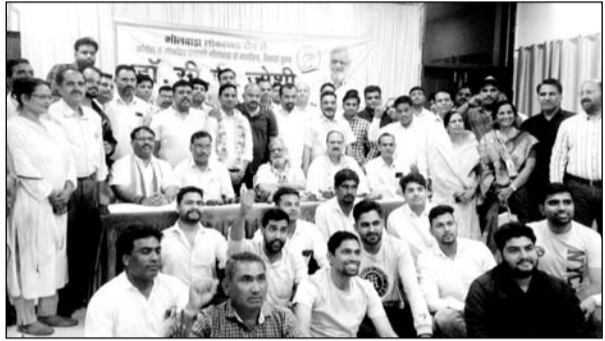
राजस्थान विधानसभा के पूर्व अध्यक्ष एवं कांग्रेस प्रत्याशी डॉ. सीपी जोशी ने पत्रकार वार्ता को संबोधित किया।

जोशी मंगलवार को एक होटल में पत्रकार वार्ता को संबोधित कर रहे थे, उन्होंने कहा कि मैंने पिछली बार 2009 में भीलवाड़ा से लोकसभा चुनाव लड़ा और यहां की जनता से वादा किया था कि अगर वह जिले की पेयजल समस्या का समाधान नहीं करा पाए तो दोबारा चुनाव नहीं लड़ेंगे और मैंने अपने वादे पर काम करते हुए 1600 गांवों को पेयजल उपलब्ध करने के लिए 3200 करोड़ रुपए की लागत से बनी चंबल पेयजल परियोजना को पूर्ण करवाया। जोशी ने पुनः चुनाव में उतरने का कारण बताते हुए कहा कि कांग्रेस ने जब