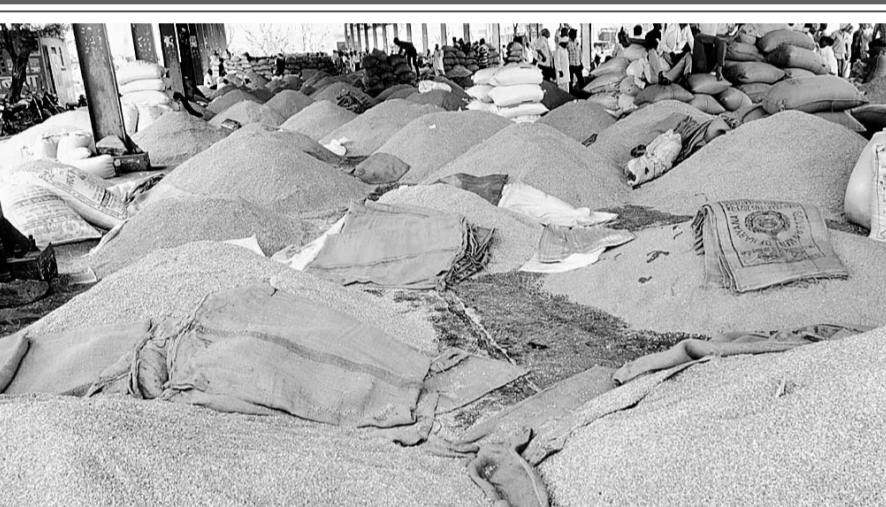
निवाई कृषि उपज मण्डी में नई सौंफ की व्यापारियों ने बोली लगाई।

■ मण्डी में सरसों, चना, गेहू व जौ सहित कई जिंसे भी बिकने के लिए आ रही है