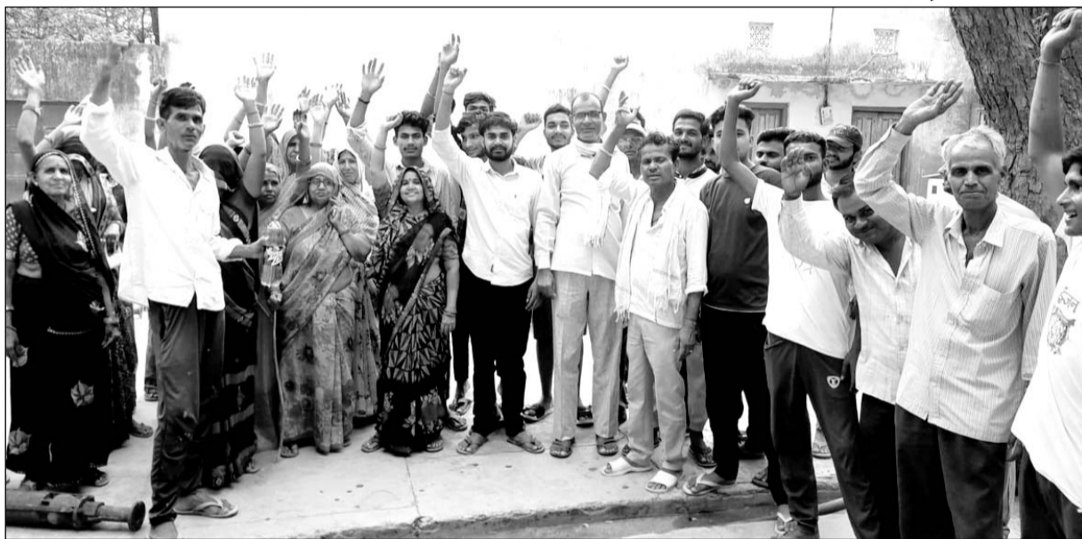
चिड़वावा शहर के वार्ड 38 में भगतों का मोहल्ला निवासियों ने जलदाय कार्यालय पर प्रदर्शन किया।

वार्डवासियों के आक्रोश को देखते हुए अधिकारियों और कर्मियों ने वार्डवासियों का गुस्सा शांत करवाया और जल्द से जल्द समस्या