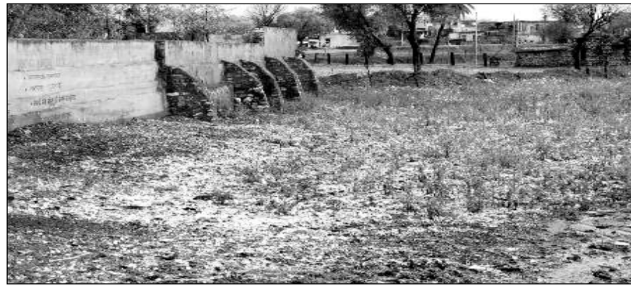
करौली क्षेत्र में बुधवार को हुई ओलावृष्टि से फसलों को नुकसान हुआ।