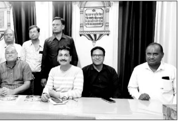
ब्यावर में श्री माहेश्वरी पंचायत बोर्ड की ओर से 7 दिवसीय महेश नवमी महोत्सव- 2023 के तहत कई आयोजन हो रहे हैं।