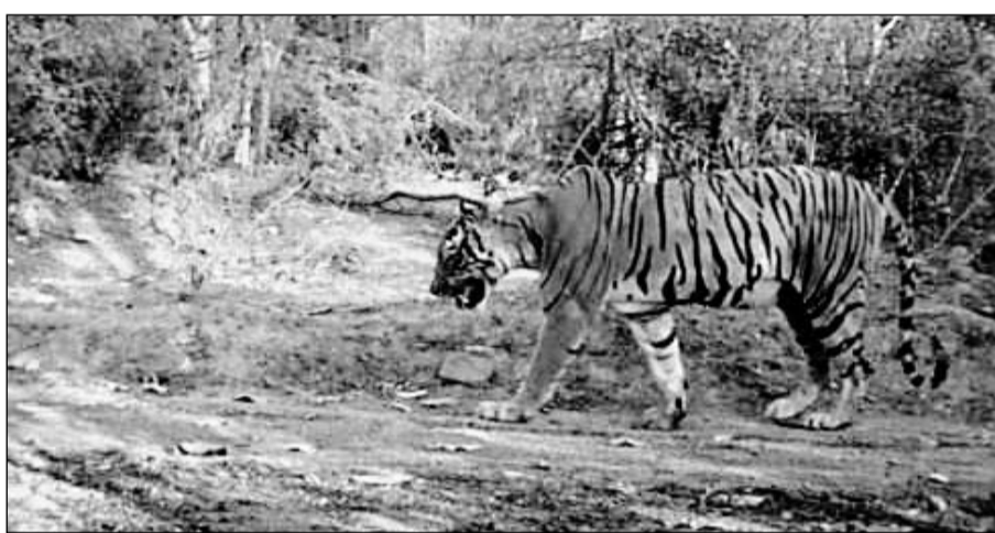
बाघिन टी-69 रणथम्भौर के खंडार क्षेत्र में दो शावकों के साथ वन कर्मियों को दिखाई दी।