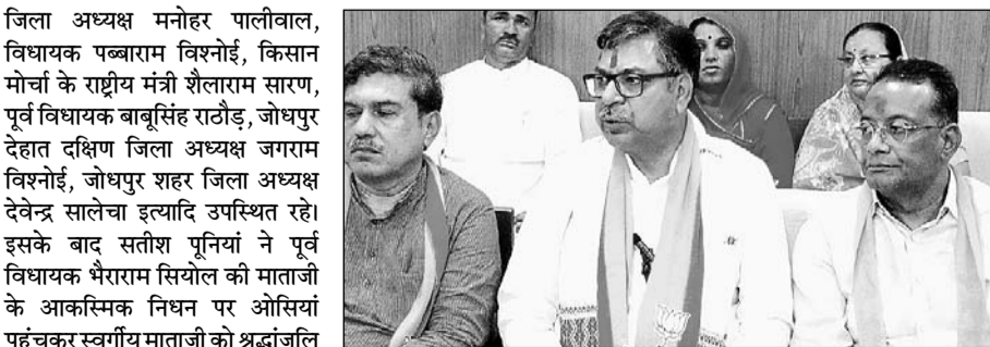
भाजपा पूर्व प्रदेशाध्यक्ष डॉ. सतीश पूनिया ने प्रेस वार्ता की।