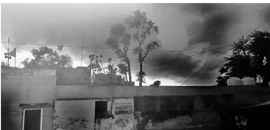
आकाश में अचानक छाये हुए बादल।

सड़कें दोपहर तक सुनसान सी नजर आने लगी थी। इसके चलते क्षेत्र में चारों ओर गर्मी का लॉकडाउन सा नजारा देखा जा रहा था। इसी बीच बुधवार को करीब 11:15 तेज आंधी के साथ हवा में ठंडक का एहसास होने लगा धीरे-धीरे आकाश में घने काले बादल मण्डराने लगे और करीब एक बजे पूरा आकाश काले बादलों से आच्छादित हो गया और मेघ गर्जना के साथ बूंद-बांदी शुरू हो गई। साथ ही देखते ही देखते मध्यम गति