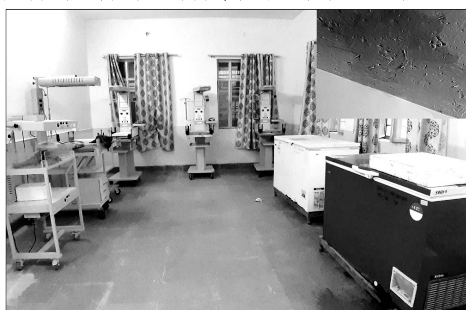
सुजानगढ़ में नव उद्घाटित श्री दुर्गादत्त फतेहपुरिया राजकीय मातृ एवं शिशु चिकित्सालय के न्यू बॉन स्ट्रेबलाइजिंग यूनिट की छत टपकने लग गई।

एमसीएच को शुरू करने के लिए करीब दो साल पहले जब प्रयास शुरू हुए तो नागरपरिधद सभापति एवं आयुक्त द्वारा उरडा रोड से अस्पताल तक सड़क बनाने का वादा किया गया