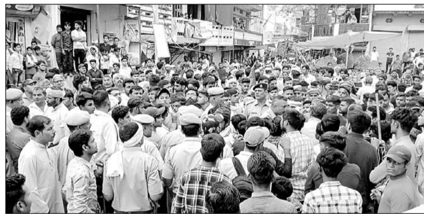
शोभायात्रा के दौरान विवाद होने पर पुलिस मौके पर पहुंची।

जुरहरा (निसं)। कस्बे में बुधवार को भगवान परशुराम की शोभायात्रा स्थानीय ब्राह्मण समाज ने धूमधाम से निकाली। कस्बे के पुराने रामलीला मैदान से बैडबाजों के साथ आरंभ हुई शोभायात्रा कस्बे के मैन बाजार, चौपडा बाजार से होते हुए बस स्टैंड पर पहुंची। जहां किसी बात को लेकर ब्राह्मण समाज के युवकों व बस स्टैंड पर ही मौजूद कुछ लोगों से कहासुनी हो गई।