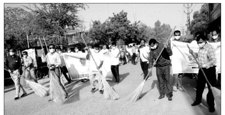
नगर परिषद क्षेत्र जालौर में स्वच्छ भारत मिशन के अन्तर्गत 17 सितम्बर से 2 अक्टूबर 2024 तक स्वभाव स्वच्छता, संस्कार स्वच्छता की थीम पर कई गतिविधियों का आयोजन हो रहा है।

जालौर, (कासं)। नगर परिषद क्षेत्र जालौर में स्वच्छ भारत मिशन के अन्तर्गत 17 सितम्बर से 2 अक्टूबर 2024 तक "स्वभाव स्वच्छता, संस्कार स्वच्छता" की थीम पर विभिन्न गतिविधियों का आयोजन किया जा रहा है। नगरपरिषद जालौर द्वारा "स्वभाव स्वच्छता, संस्कार स्वच्छता" अभियान के तहत मंगलवार को जालौर क्लब में कार्यक्रम का आयोजन किया गया।