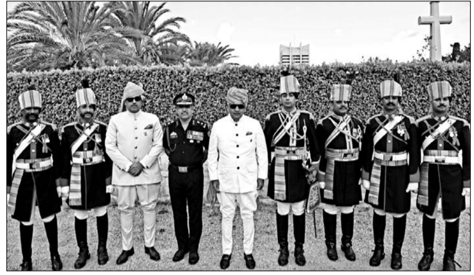
हाइफा डे महाराजा हनवन्त सैनिक स्कूल चौपासनी में समारोह पूर्वक आयोजित होगा।

जोधपुर, (कासं)। 106 वं हाइफा डे सोमवार 23 सितम्बर को शाम 6.15 बजे चौपासनी शिक्षा समिति के तत्वाधान में महाराजा हनवन्त सैनिक स्कूल चौपासनी में समारोह पूर्वक आयोजित होगा।