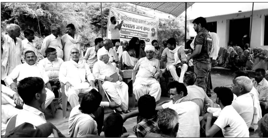
कालिया बाबा काला पहाड़ को खनन से बचाने और इसे धार्मिक क्षेत्र घोषित करने की मांग को लेकर चल रहे आन्दोलन में कई जनप्रतिनिधियों ने शिरकत की।

लोगों ने कहा कि सभी लीजों को समाप्त कराने के लिये आन्दोलन जारी रहेगा। इस पर्वत की गुफाओं में अनेकानेक संत-महात्मा तपस्या करते हैं और संत भक्तों द्वारा अनवरत