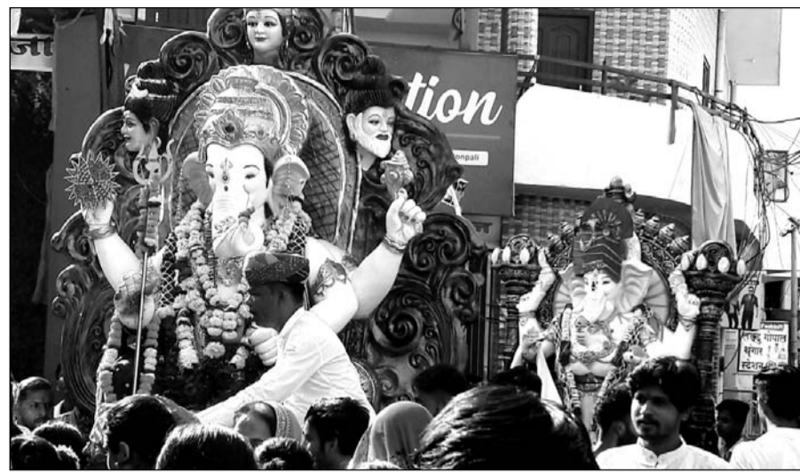
10 दिन तक गणपति बप्पा की पूजा अर्चना के बाद अनंत चतुर्दशी पर पाली शहर में श्रद्धालुओं ने लाखोटिया तालाब पर प्रतिमाओं का विसर्जन किया।

शहर में गणेश चतुर्थी के दिन विभिन्न सामाजिक, व्यापारिक संस्थाओं और गली मोहल्लों के साथ घरों में अस्थायी रूप से स्थापित किये गये गणेश प्रतिमाओं का आज विसर्जन किया गया।