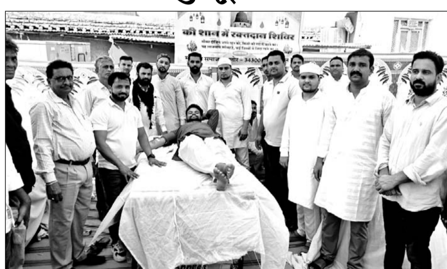
जालौर के जामा मस्जिद मैदान में रक्तदान शिविर का आयोजन किया।

रक्तदान शिविर में रक्तदान करने पर मुस्लिम समाज ने सभी रक्तदाताओं का आभार जताया रक्तदान शिविर में