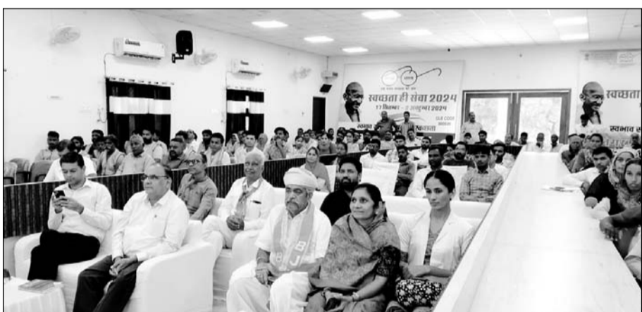
स्वच्छता ही सेवा 2024 का जिला स्तरीय शुभारंभ कार्यक्रम बालोतरा पंचायत समिति सभागार में आयोजित किया।

बालोतरा, (निसं)। स्वच्छता ही सेवा 2024 जिला स्तरीय शुभारंभ कार्यक्रम मंगलवार को बालोतरा पंचायत समिति सभागार में आयोजित किया गया। इस अवसर पर उपराष्ट्रपति जगदीप धनखंड ने जिला स्तरीय कार्यक्रम में वीसी के माध्यम से "स्वच्छता ही सेवा -2024" अभियान के उद्घाटन पर मुख्य अतिथि के रूप में उन्होंने स्वच्छता