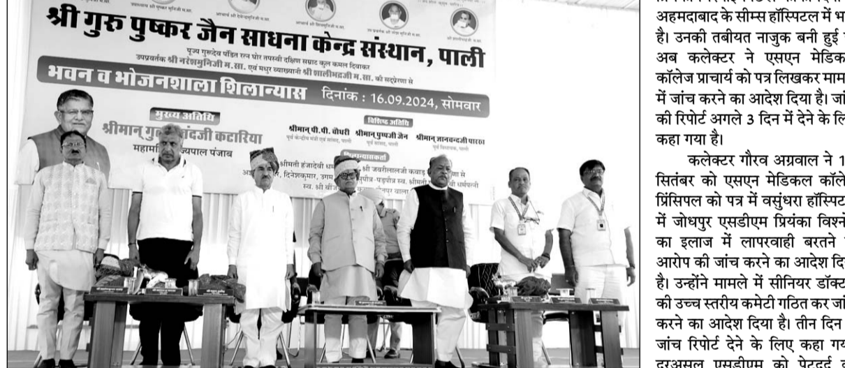
पंजाब के राज्यपाल गुलाबचन्द कटारिया ने भामाशाह द्वारा निर्मित श्री गुरु पुष्कर जैन साधना केंद्र संस्थान पाली में नया भवन व भोजन कक्ष का शिलान्यास किया।

पाली, (निं.सं.)। पंजाब के राज्यपाल गुलाबचन्द कटारिया ने आज सोमवार को पाली जिले में भामाशाह द्वारा निर्मित श्री गुरु पुष्कर जैन साधना केंद्र संस्थान पाली में नया भवन व भोजन कक्ष का शिलान्यास किया। प्रायतः जानकारी के अनुसार उन्होंने कहा कि मानव को अपने जीवन के हिस्सा पर कल्याण व उपकार में लगा