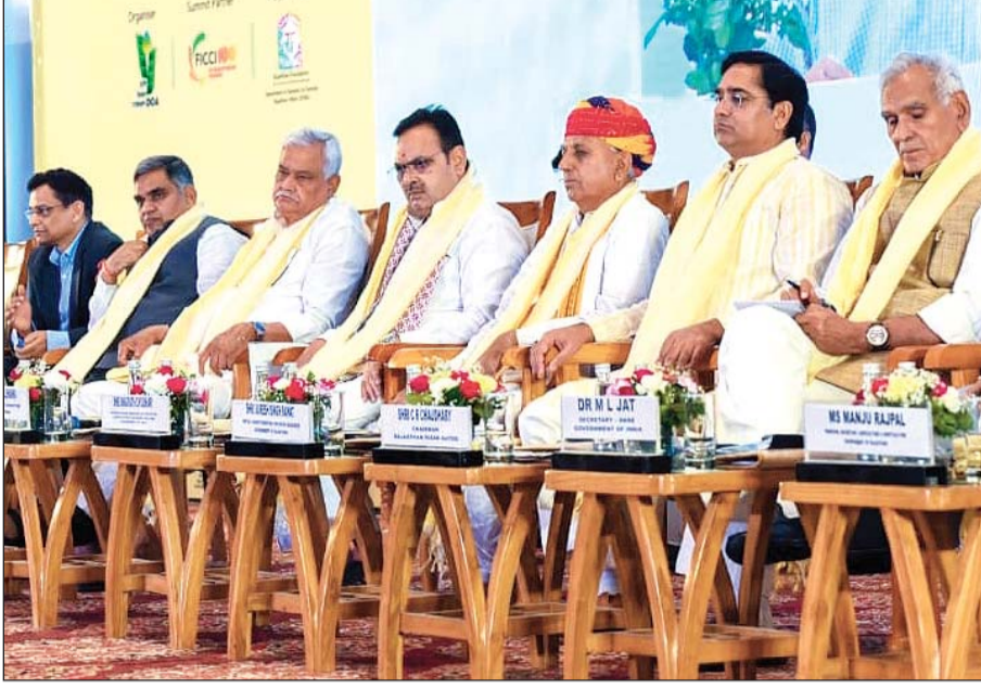
मुख्यमंत्री भजनलाल शर्मा ने गुरुवार को नई दिल्ली में आयोजित ग्राम-2026 इन्वेस्टर मीट को संबोधित किया।

मुख्यमंत्री भजनलाल शर्मा ने कहा कि बाजरा, सरसों, तिलहन, जौ, ग्वार, ईसबगोल व जौरे के उत्पादन में राजस्थान का देश में प्रथम स्थान है। दलहन उत्पादन के लिए झालावाड़ व टोंक को मॉडल जिले के रूप में विकसित किया जा रहा है।