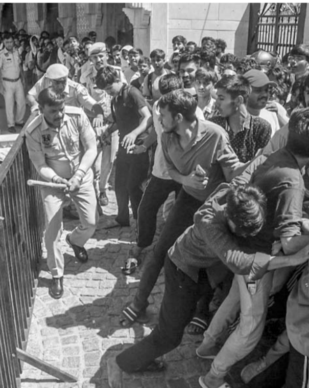
जयपुर में इंडियन प्रीमियर लीग-2026 मैच के स्टूडेंट्स के टिकट 4 घंटे में बिके : टिकट नहीं मिलने युवाओं ने फाड़े बैनर और पुलिस ने चलाये डंडे।