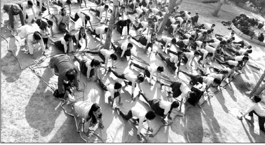
विद्यालय में सूर्य नमस्कार की 12 क्रियाओं के कई चक्र किये।

विद्यालय में सूर्य नमस्कार की 12 क्रियाओं के कई चक्र किये। उन्होंने बताया कि एक विद्यार्थी के लिए सबसे पहली आवश्यकता उसका स्वस्थ होना है, अगर