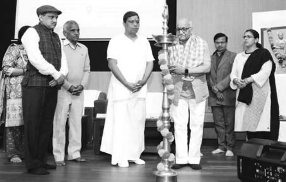
राष्ट्रीय आयुर्वेद विद्यापीठ की ओर से सोमवार को 6 दिवसीय आवासीय प्रशिक्षण कार्यक्रम 'चरकायतन' का शुभारम्भ हुआ।

हरिद्वार। आयुष मंत्रालय के अन्तर्गत स्वायत्त संगठन राष्ट्रीय आयुर्वेद विद्यापीठ द्वारा आयुर्वेद शिक्षकों तथा आयुर्वेद के स्नातकोत्तर व स्नातक विद्वानों के लिए 6 दिवसीय आवासीय प्रशिक्षण कार्यक्रम 'चरकायतन' का आयोजन पतंजलि आयुर्वेद कॉलेज के तत्वाधान में किया गया।