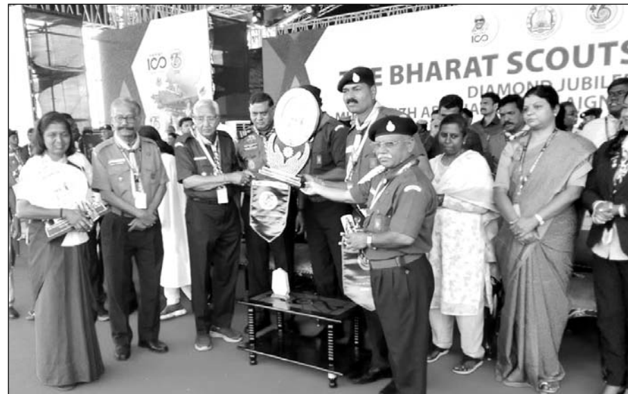
तमिलनाडु के शिक्षा मंत्री ने राजस्थान दल के पदाधिकारी को सर्वोच्च अवार्ड की शील्ड एवं पताकाएं प्रदान कर सम्मानित किया

प्रदर्शन से जंबूरी की सर्वोच्च शील्ड अपने नाम करते हुए एक बार फिर राजस्थान का परचम फहराया। राजस्थान के दल ने डायमंड जुबली जंबूरी में स्काउट विभाग की प्रथम स्थान की नेशनल कमिश्नर स्काउट शील्ड, गाइड विभाग की प्रथम स्थान की नेशनल कमिश्नर गाइड शील्ड एवं ओवरऑल प्रदर्शन में प्रथम स्थान प्राप्त करते हुए चीफ नेशनल कमिश्नर अवार्ड