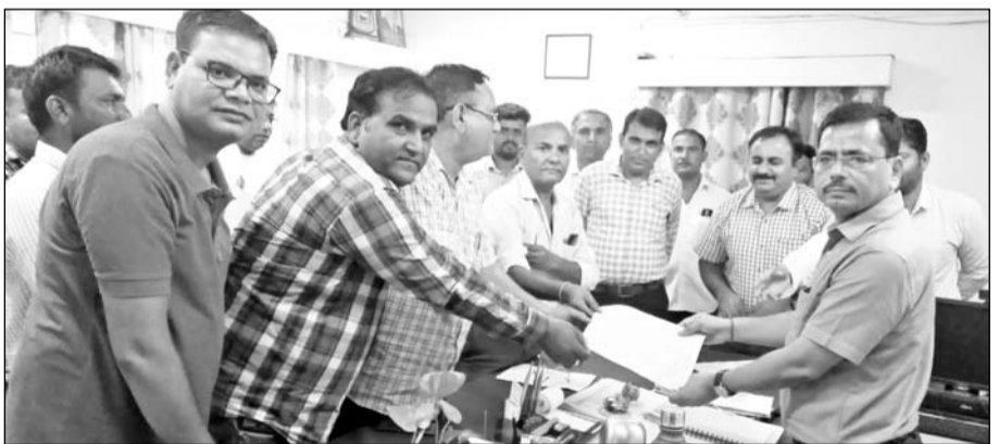
बाड़मेर में कार्य के बहिष्कार की मांग को लेकर डिस्कॉम के अधीक्षण अभियंता को ज्ञापन सौंपा गया। फोटो-राष्ट्रदूत

बाड़मेर, (नि.सं.)। बाड़मेर जिले के रामसर उपखण्ड के 33/11 केवी सब स्टेशन आसाडी में इंजीनियर सुपरवाइजर पर जानलेवा हमला करने, राजकार्य में बाधा पहुंचाने एवं रूपरेखा छीनकर ले जाने के मामले में घटना के सात दिन बाद भी आरोपियों की गिरफ्तारी नहीं होने पर सोमवार को डिस्कॉम कर्मचारियों ने प्रदर्शन करते हुए अधीक्षण अभियंता एवं पुलिस अधीक्षक को ज्ञापन सौंपा।