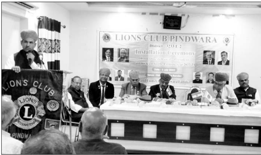
पिंडवाड़ा में लॉयंस क्लब के 37 वें शपथ समारोह का कार्यक्रम आयोजित हुआ।