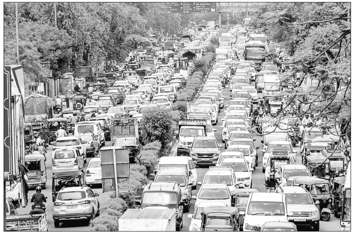
जयपुर कलेक्ट्री सकिंल से एम.आई.रोड तक ट्रेफिक जाम की समस्या विकराल रूप ले चुकी है। आये दिन वाहनों का लंबा रैला यहां दिनभर रंग-रंगकर आगे बढ़ता है। इस समस्या से लोग परेशान हैं, लेकिन ट्रेफिक पुलिस और शहर के विकास का खाका तैयार करने वाले जिम्मेदार अफसरों का इस ओर कोई ध्यान तक नहीं है।