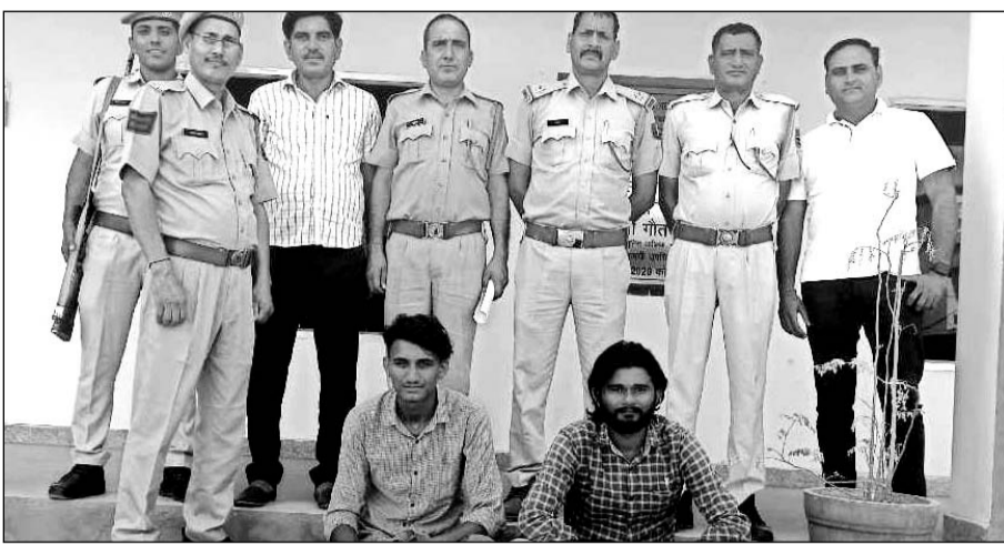
अवैध शराब तस्करी कर पंजाब से गुजरात ले जाते गिरफ्तार आरोपीगण।