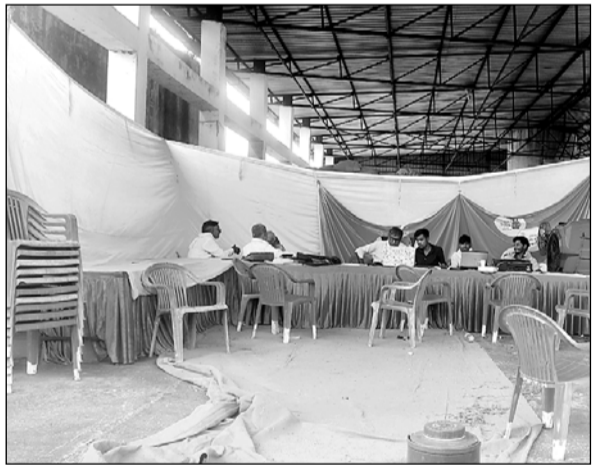
किशनगढ़ बास अनाज मंडी में लग रहे महंगाई राहत कैम्प में लोगों का इंतजार करते कर्मचारी।

अनाज मंडी किशनगढ़ बास में करीब 10 दिन से लग रहा है कैम्प 'ऐप नहीं चलने के कारण किसानों को ऑनलाइन गिरदावरी जमावंदी की नकल नहीं मिल पा रही है'