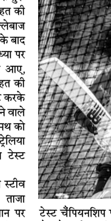
टेस्ट चैम्पियनशिप फाइनल में शतक टोका है और एशेज सीरीज में टीम के अहम

ऑस्ट्रेलिया के स्टार बल्लेबाज स्टीव स्मिथ बुधवार को आईसीसी की ताजा बल्लेबाजों की रैंकिंग में दूसरे स्थान पर पहुंच गए हैं। उन्होंने भारत के खिलाफ विश्व