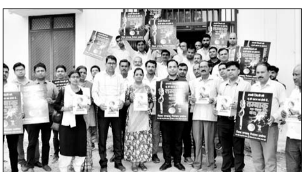
चूरु में तम्बाकू मुक्ति एवं इसके प्रभाव विषय पर पेंटिंग एवं स्लोगन, यूथ सेल्फ़ी प्रतियोगिता आदि गतिविधियों की जानकारी दी गई।

मुख्य चिकित्सा एवं स्वास्थ्य अधिकारी ने कहा कि आज के दौर में रोगियों में 63 प्रतिशत आबादी गैर संक्रामक रोगों से ग्रस्त होती है। इनमें सबसे ज्यादा रोगों का कारण तम्बाकू सेवन है। उन्होंने बताया कि सिगरेट एवं अन्य तम्बाकू उत्पाद अधिनियम कोटपा की पालना के साथ ही समुदाय में व्यवहार में परिवर्तन लाने के लिये जागरूकता गतिविधियों पर विशेष रूप से फोकस रखना आवश्यक है।