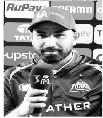
खिलाड़ियों को रिलीज कर सकती है। शमी ने आईपीएल 2023 में परफॉर्म करेगी जीता था और 28 विकेट अपने नाम किए थे। उनकी टीम गुजरात उप विजेता रही थी।

नई दिल्ली, 3 अक्टूबर। भारतीय क्रिकेट टीम के स्टार तेज गेंदबाज मोहम्मद शमी इस समय अपनी इंजरी से उबर रहे हैं। वनडे वर्ल्ड कप 2023 के बाद से वो टीम इंडिया से बाहर चल रहे हैं। शमी अपनी फिटनेस पर जमकर काम कर रहे हैं और कुछ रिपोर्ट्स के मुताबिक वो न्यूजीलैंड के खिलाफ घरेलू टेस्ट सीरीज के जरिए।