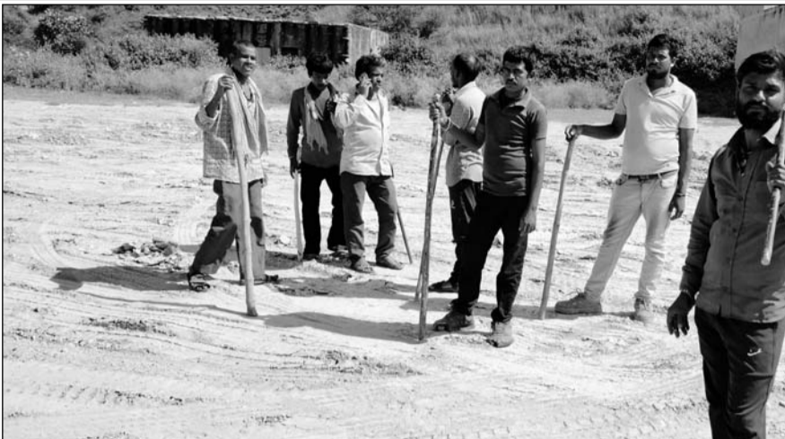
पैंथर के हमले से बचने के लिए गांववासी लड़ व कुल्हाड़ी हाथों में लिए चल रहे हैं।