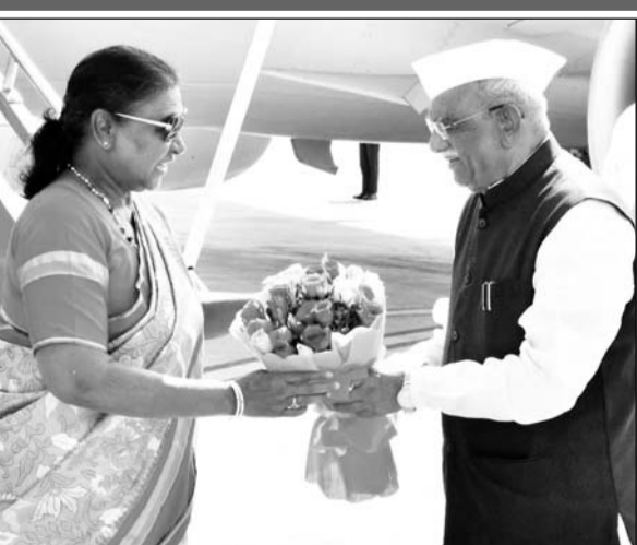
राष्ट्रपति द्रौपदी मुर्मू का एयरपोर्ट पर राज्यपाल बागडे ने स्वागत किया।

उदयपुर, (कासं)। राष्ट्रपति द्रौपदी मुर्मू ने कहा है कि शिक्षा ही सशक्तकरण का सर्वश्रेष्ठ माध्यम है। शिक्षित और सूर्यस्कारित व्यक्ति अपने परिवार, समाज और देश की उन्नति में महत्वपूर्ण भूमिका निभा सकता है। राष्ट्रपति द्रौपदी मुर्मू गुरुवार को उदयपुर के मोहनलाल सुखाड़िया विश्वविद्यालय के 32 वें दीक्षान्त समारोह को बतौर मुख्य अतिथि संबोधित कर रही थीं।