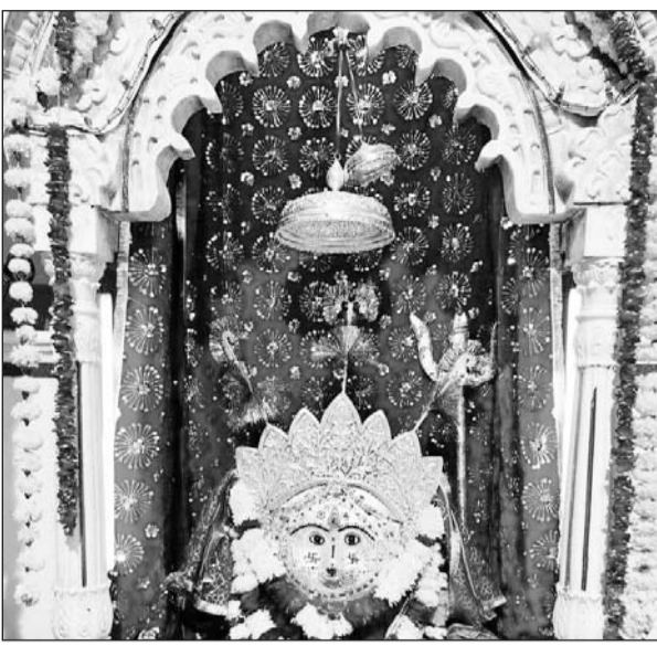
बीकानेर के नागणेचीजी मंदिर में शारदीय नवरात्र पर श्रद्धालुओं का तांता लगा रहा।

गली-मोहल्लों और सार्वजनिक स्थलों पर दुर्गा प्रतिमाओं को स्थापित कर उनकी पूजा-अर्चना की जायेगी। पंडालों में धार्मिक और सांस्कृतिक कार्यक्रम होंगे। डांडिया व गरबा नृत्य होंगे। देवी पाठ और मंत्र जाप होंगे। पूजन उत्सव की पूर्णहृत्त पर पंडालों में पूजित देवी प्रतिमाओं का जल में विसर्जन किया जायेगा। बंगाली मंदिर में बंगाल की परंपरा अनुसार दुर्गा पूजा महोत्सव का आयोजन होगा। शारदीय नवरात्र के