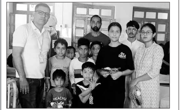
द संजीवनी लाइफ बियोन्ड की ओर से कैंसर पीड़ित बच्चों को कलर बुक, कलर्स, कैप, जुराबे व स्माइल बाल्स बांटे।