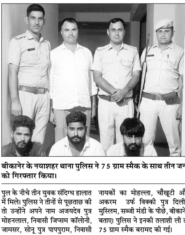
बीकानेर के नयाशहर थाना पुलिस ने 75 ग्राम स्मैक के साथ तीन जनों को गिरफ्तार किया।