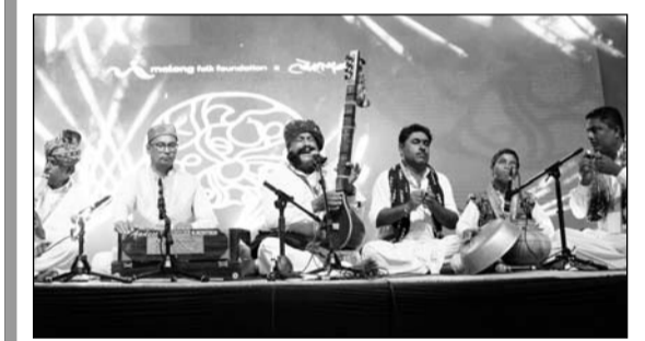
कबीर यात्रा के उद्घाटन अवसर पर रविन्द्र रंगमंच ओपन थियेटर में कलाकारों ने समां बांधा।