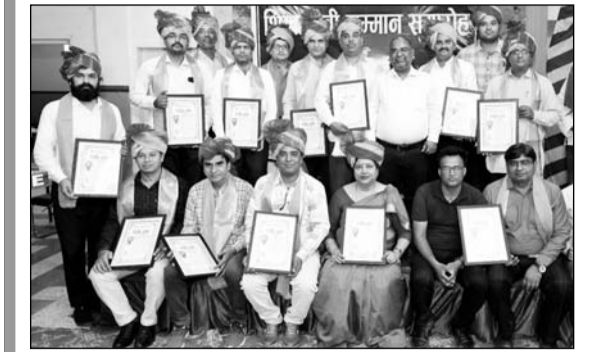
दुर्गा देवी व्यास फाउण्डेशन ने शिक्षा के क्षेत्र में उल्लेखनीय कार्य करने वाले शिक्षक-शिक्षिकाओं को सम्मानित किया।