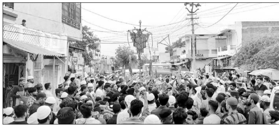
मंडार में मुस्लिम समाज ने हजरत अब्बास अलमबरदार की याद में अलम का जुलूस निकाला।