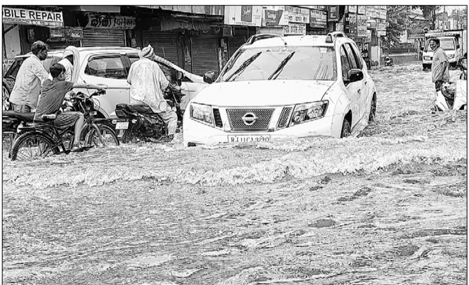
बारिश के बाद दर्जनों दुकानों और शहर के निचले इलाकों में पानी भर गया।