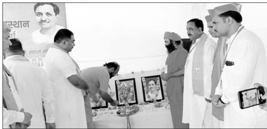
नंदगांव में भाजपा के तीन दिवसीय विस्तारक प्रशिक्षण वर्ग का शुभारंभ हुआ।

रविवार को जिला कलेक्टर के निर्देशानुसार ब्लॉक स्तरीय अधिकारियों द्वारा नंदीशाला गोलासन, सियाणा, सोना रूप गोशाला गुडा बालोतान, महावीर गोशाला सांचौर, माखपुरा गोशाला, सांथु गोशाला सहित जिले में स्थित विभिन्न गोशालाओं में पशु चिकित्साधिकारियों के साथ पहुंचकर व्यवस्थाएं देखीं गईं। उनके द्वारा पूरे क्षेत्र में पशुपालकों को लंपी स्किन बीमारी के प्रति जागरूक करने एवं बीमार पशुओं को उपचार के संबंध में जानकारी ली। भीमनाल में संक्रमित गोवंश के लिए अलग से अस्थायी उपचार केंद्र खोला गया है। वही जिलेभर की गोशालाओं में नियमित रूप से फोगिंग एवं साईपरमैशिन दवा का छिड़काव किया जा रहा है।