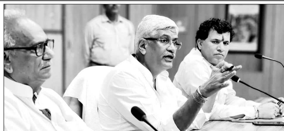
जोधपुर के डीआरडीए हॉल में मंत्रियों ने लंपी स्कीन बीमारी को लेकर जानकारी ली।

रविवार को बैठक के बाद मीडिया के साथ अनौपचारिक बातचीत में केन्द्रीय मंत्री शेखावत ने कहा कि गुजरात के रास्ते से आकर पिछले दो महीने में पश्चिमी राजस्थान के लगभग सभी जिलों में लंपी वायरस कहर बरपा है। हजारों गायों की मौत हो चुकी है। यदि पश्चिमी राजस्थान का आंकड़ा उठाकर देखें तो लगभग एक लाख से ज्यादा पशुधन इससे संक्रमित