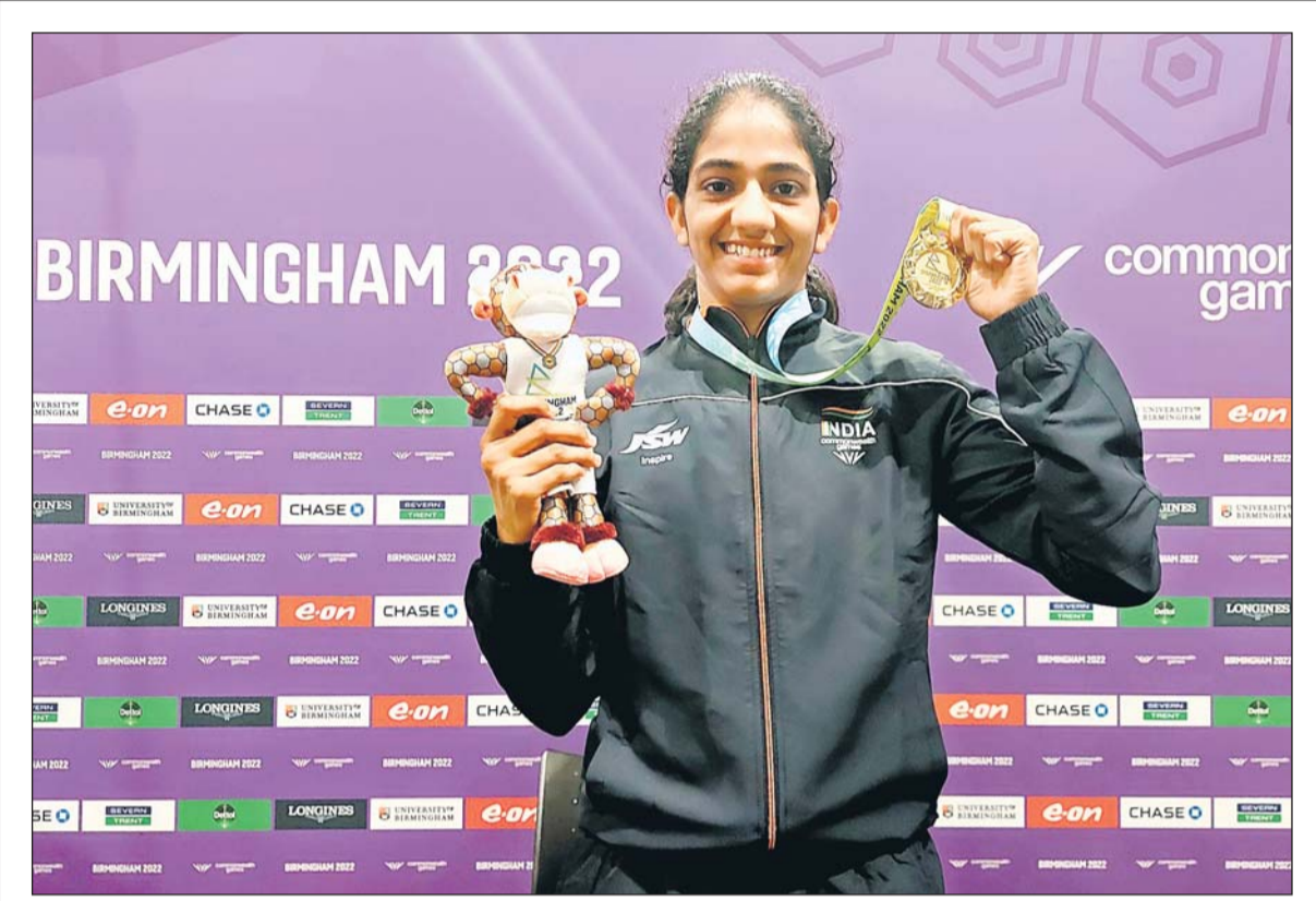
महिला मुक्केबाज नीतू घंघस ने कॉमनवेल्थ गेम्स महिला 48 किग्रा मुक्केबाजों में गोल्ड मैडल हासिल किया। नीतू ने मुक्केबाजी प्रतियोगिता के फाइनल मैच में मेज़बान इंग्लैंड की मुक्केबाज डेमी जेड को जबरस्त तरीके से मात दी। दो बार की विश्व यूथ चैंपियन नीतू ने अपनी विपक्षी को 4-0 के एकतरफा फैसले से मात दी। नीतू ने जीत के बाद कहा, "मैं स्वर्ण पदक जीतने के बाद बेहद खुश हूँ। मैं यह पदक अपने देशवासियों के नाम करना चाहती हूँ। मैं भारत सरकार, भारतीय खेल प्राधिकरण और भारतीय मुक्केबाजी महासंघ के समर्थन के लिये उनकी शुक्रगुजार हूँ। मैं अपने कोचों, और अपने परिवार की भी शुक्रगुजार हूँ क्योंकि मैं उनके समर्थन के बिना यह स्वर्ण नहीं जीत सकती थी।"