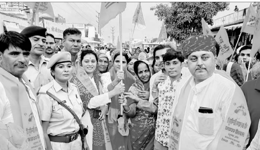
डिग्गी मेले के समापन अवसर पर पदयात्रा का शाही ध्वज मंदिर शिखर पर चढ़ाया गया।