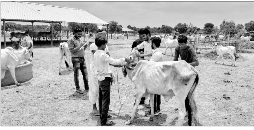
सांचौर के निकट गोधाम पथमेड़ा में गुजरात से आई चिकित्सा टीम ने गायों का टीकाकरण किया।

सांचौर, (निस)। सांचौर क्षेत्र में स्थित गोधाम पथमेड़ा जहां पर लंपी बीमारी की वजह से गौवंश खतरे में है। क्षेत्र में स्थाई इलाज के अभाव में पांच सौ से अधिक गौवंश की मौत हो गई है एवं गौशालाओं के समक्ष गायों को इस महामारी से बचाने की चुनौती पैदा हो गई है। पालडी स्थित गौशाला में सबसे अधिक इस महामारी से गौवंश शिकार हुआ है जिसमें करीब 350 के करीब गाय इस महामारी की चपेट में आ चुकी है। चिकित्सा विभाग की टीम लगातार प्रयास करके स्वस्थ गौवंश का टीकाकरण कर रही है।