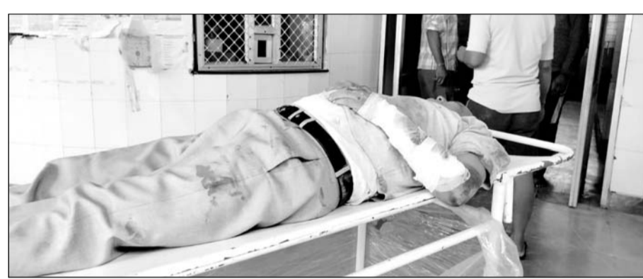
घायलों का रिंगस सीएचसी में उपचार किया गया।

रिंगस, (निस)। खाटूश्यामजी के दर्शनों के लिए नोएडा से आ रही एक बस राजमार्ग पर दूसरे वाहन के साइड दबावे से बचने के प्रयास में पलट गई।