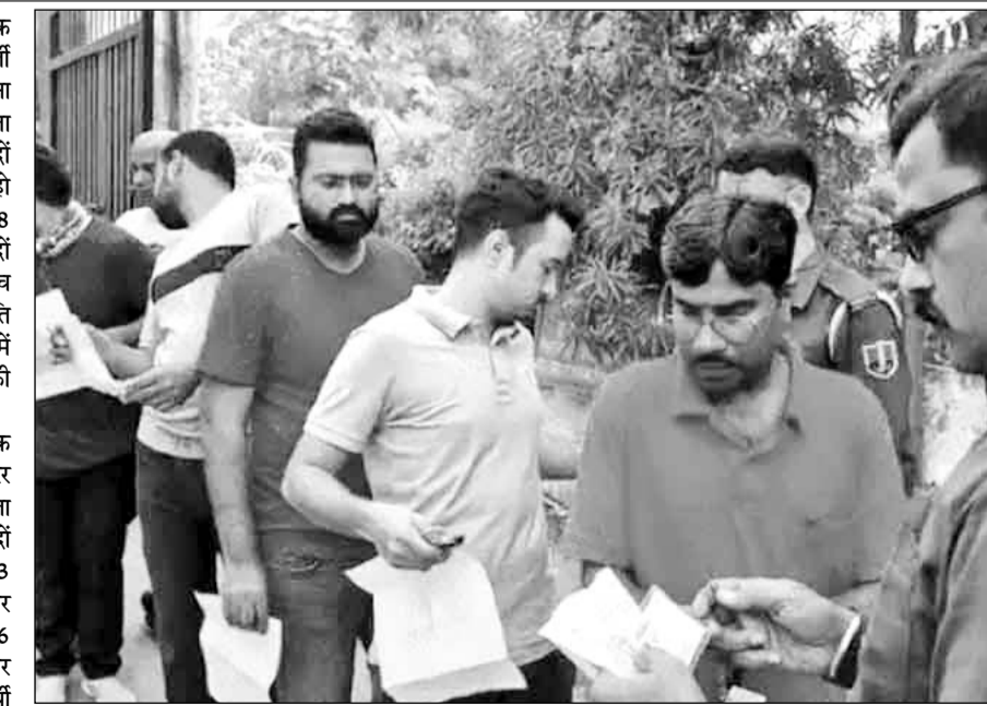
परीक्षा केंद्र पर जांच के बाद परीक्षा देने जाते अभ्यर्थी।