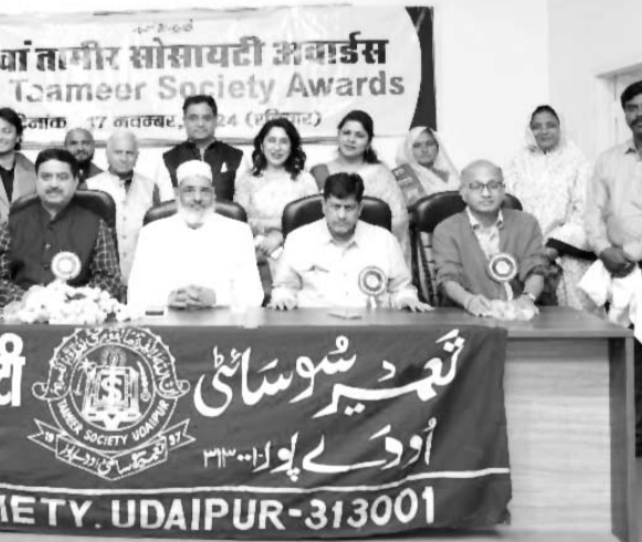
तामीर सोसायटी ने उल्लेखनीय कार्य कर रही प्रतिभाओं का सम्मान किया।