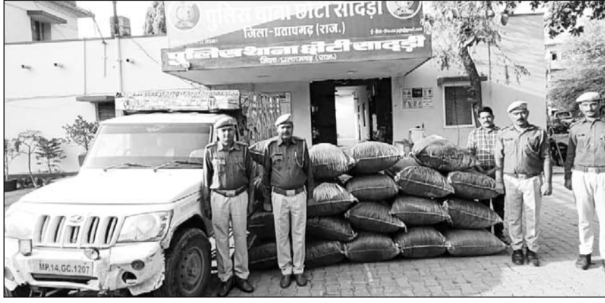
छोटी सादड़ी थाना पुलिस की टीम ने 325 किलो डोडा-चूरा जब्त किया।