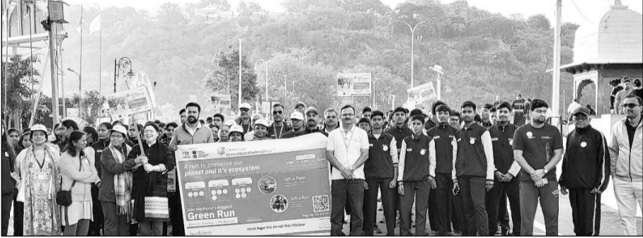
फतहसागर पाल दौड़ में उदयपुर प्रतिभागियों ने उत्साह से भाग लिया।