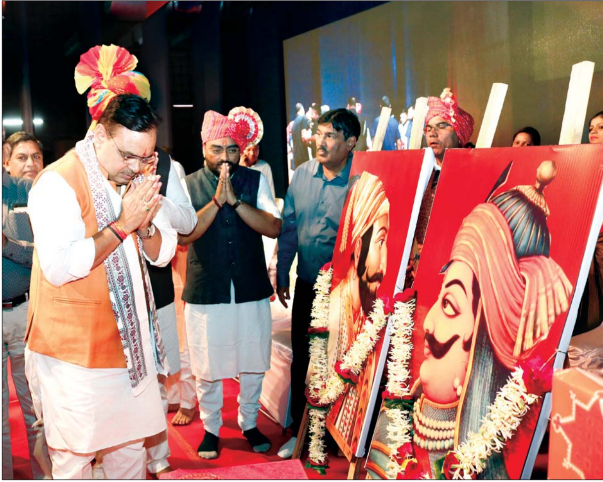
महाराष्ट्र में चुनाव प्रचार के दौरान राजस्थान के मुख्यमंत्री भजनलाल शर्मा ने प्रवासी राजस्थानी सम्मेलनों में भाग लिया। प्रवासी राजस्थानियों ने उनका भावभंगी स्वागत किया।