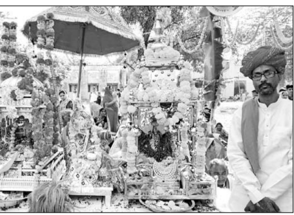
खटीक समाज की ओर से आयोजित सामूहिक विवाह सम्मेलन में शामिल शालिग्रामजी एवं तुलसा जी की श्रृंगारित प्रतिमाएं।