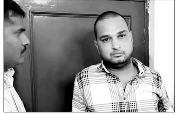
पांच माह से फरार आरोपी को पुलिस ने गिरफ्तार किया।