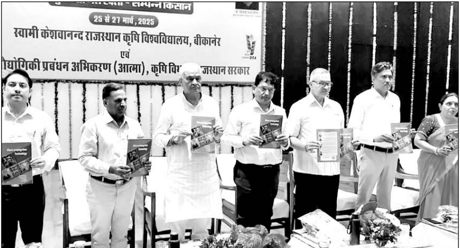
स्वामी केशवानंद राजस्थान कृषि विश्वविद्यालय बीकानेर में तीन दिवसीय कृषि मेले का उद्घाटन कर कृषि मंत्री किरोड़ी लाल मीणा ने स्मारिका का विमोचन किया।

बीकानेर, (कांस)। स्वामी केशवानंद राजस्थान कृषि विश्वविद्यालय में मंगलवार को तीन दिवसीय किसान मेला प्रारंभ हुआ। कृषि मंत्री डॉ. किरोड़ी लाल मीणा ने किसान मेले का उद्घाटन किया और मेले में लगी विभिन्न स्टाल्स का अवलोकन कर किसानों को दी जा रही विभिन्न तकनीकों, प्रौद्योगिकी, नवाचारों और विश्वविद्यालय द्वारा किए जा रहे कृषि अनुसंधान को जानकारी ली।