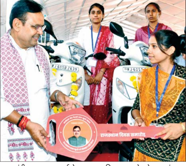
मुख्यमंत्री भजनलाल शर्मा ने राजस्थान दिवस समारोह के श्रृंखला में बाड़मेर में आयोजित राज्य स्तरीय महिला सम्मेलन को संबोधित किया। इस अवसर पर उन्होंने बालिकाओं को 5 हजार स्कूटी वितरित की।

मुख्यमंत्री शर्मा ने महिला सम्मेलन में विभिन्न योजनाओं की चयनित लाभार्थियों से संवाद किया तथा महिला