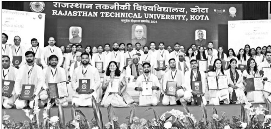
राजस्थान तकनीकी विश्वविद्यालय, कोटा के दीक्षांत समारोह में राज्यपाल एवं कुलाधिपति हरिभाऊ बागड़े ने विभिन्न पाठ्यक्रमों में उपाधियों प्रदान कीं।

समारोह की अध्यक्षता करते हुए राज्यपाल एवं कुलाधिपति हरिभाऊ बागड़े ने दीक्षांत भाषण प्रदान करते हुए कहा कि दीक्षांत शिक्षा का अंत नहीं बल्कि आपके एक नये जीवन का आरंभ है। यह वह समय है जब आप अजित ज्ञान का उपयोग समाज व देश के प्रति समर्पित कर जनकल्याण हेतु करने के लिए तैयार हुए हैं। तकनीकी शिक्षा की पहली आवश्यक्ता यह है कि हम जो भी बात कहें, तर्क से कहें। भारत विज्ञान और प्रौद्योगिकी में बहुत अग्रणी रहा है। तकनीकी शिक्षा केवल पुस्तकों तक सीमित नहीं है, यह नवाचार, अनुसंधान और व्यावहारिक ज्ञान का संगम है। नई शिक्षा नीति विद्यार्थियों के सर्वांगीण विकास पर