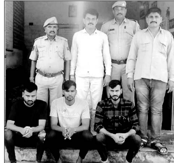
ठगी के मामले में कोतवाली पुलिस द्वारा गिरफ्तार तीन आरोपी।