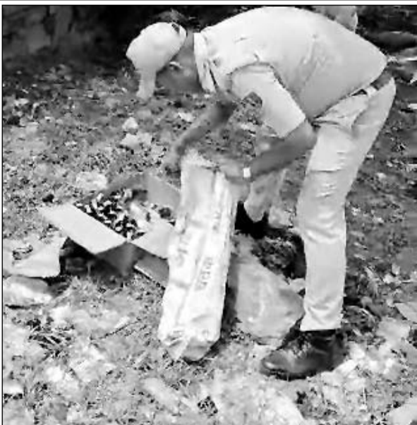
पुलिस ने अवैध शराब जब्त की।