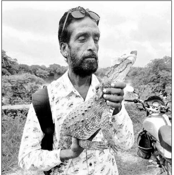
उदयपुर के आयड नदी से मगरमच्छ को सुरक्षित बाहर निकाला।