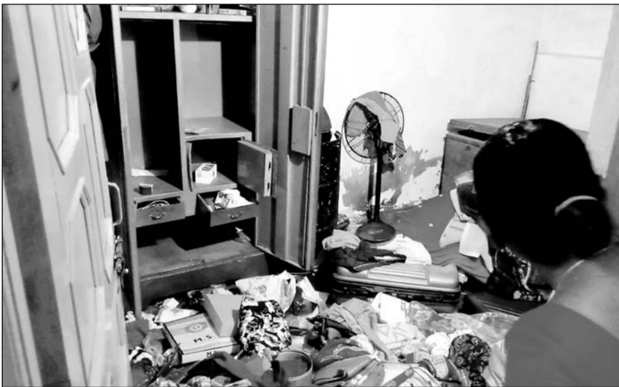
घुघरा में चोरी के वारदात के बाद बिखरा पड़ा सामान।