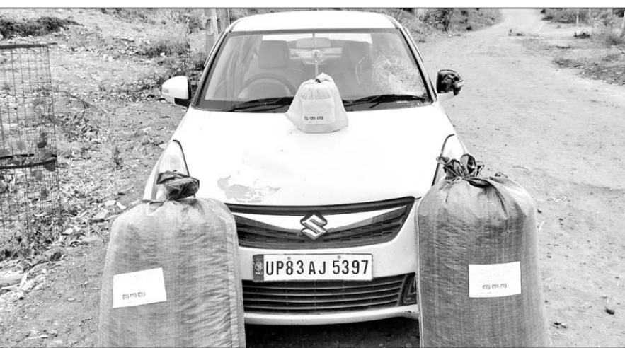
ग्रामीण पुलिस की विशेष टीम व मंडाना पुलिस टीम ने कार व अवैध मादक पदार्थ जब्त किया।