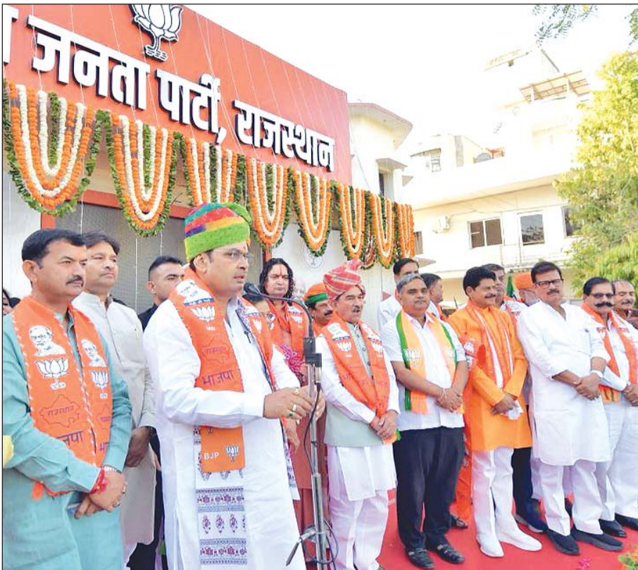
मुख्यमंत्री भजनलाल शर्मा ने सोमवार को भाजपा के स्थापना दिवस पर प्रदेश मुख्यालय पर आयोजित कार्यक्रम को संबोधित किया। इस अवसर भाजपा प्रदेश अध्यक्ष मदन राठौड़, पूर्व मुख्यमंत्री वसुंधरा राजे व वरिष्ठ नेता मौजूद थे।

वसुंधरा राजे ने अपने संबोधन में कहा कि भाजपा का 46 वर्षों का सफर संघर्ष, निष्ठा और विचारधारा के प्रति समर्पण का परिणाम है। उन्होंने स्पष्ट कहा कि राजनीतिक नियुक्तियों और महत्वपूर्ण दायित्व केवल उन्हीं कार्यकर्ताओं को