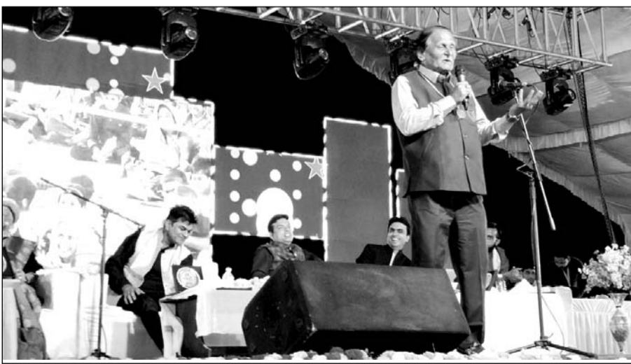
जालोर महोत्सव में कवि सम्मेलन का आयोजन हुआ।