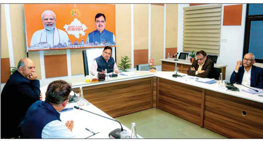
मुख्यमंत्री भजनलाल शर्मा ने वीसी के माध्यम से जयपुर संभाग के विकास कार्यों एवं बजट घोषणाओं की प्रगति की समीक्षा की। उन्होंने संभाग के सभी जिला कलक्टरों को आगामी तीन दिन में पिछले बजट वर्ष, 2024-25, की घोषणाओं के लम्बित प्रकरणों की रिपोर्ट भेजने के निर्देश दिए। कहा कि खादूस्थान जी के मंदिर को भी अनुपालना में विश्वस्तरीय आने वाले श्रद्धालुओं को सुलभ एवं भव्यता प्रदान करने की बजट घोषणा सुविधाएँ विकसित की जाएँ ताकि बेहतर व्यवस्थाएँ उपलब्ध हो सकें।

मुख्यमंत्री ने झुंझुनू जिले के विकास कार्यों की समीक्षा करते हुए कहा कि लोहारगल सहित अन्य पर्यटन स्थलों के विकास के लिए विस्तृत कार्य योजना तैयार की जाए। उन्होंने सीकर जिले की समीक्षा करते हुए